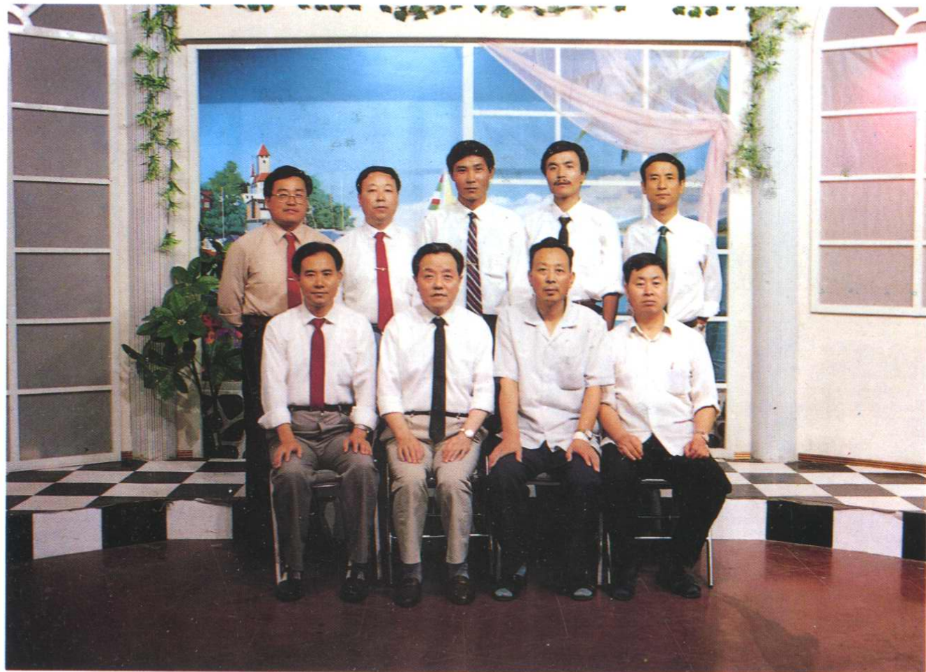
《寶鷄市監察志》編纂領導小組人員合影