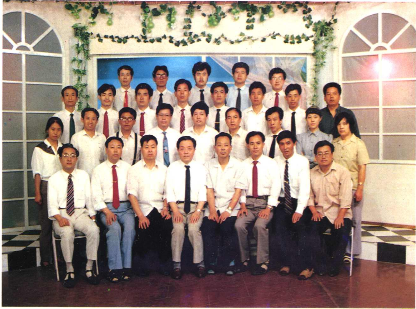
寶鷄市監察局全體同志合影