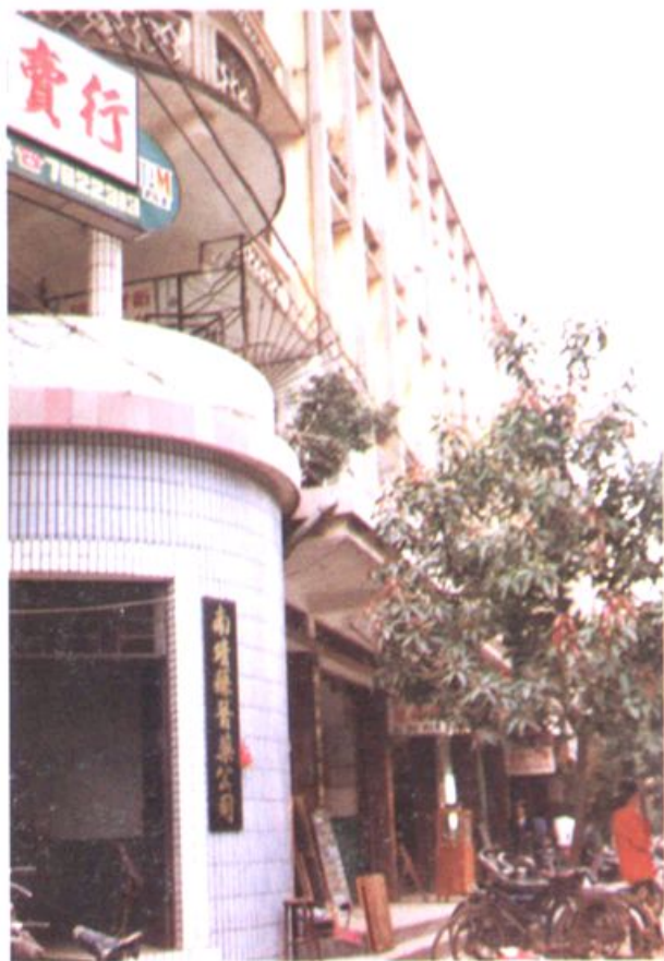
▲ 漳州市第二医药公司