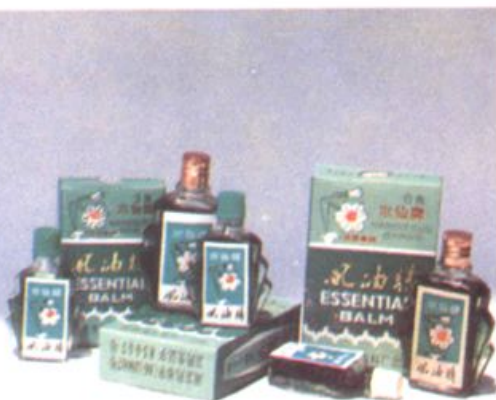
▲ 风油精 (荣获国家银质奖)