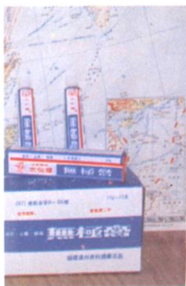
▲ 无极膏 (福建省首届博览会金奖)