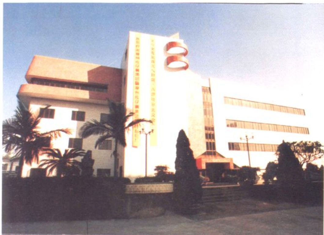
▲ 漳州片仔癀集团公司（漳州市制药厂）