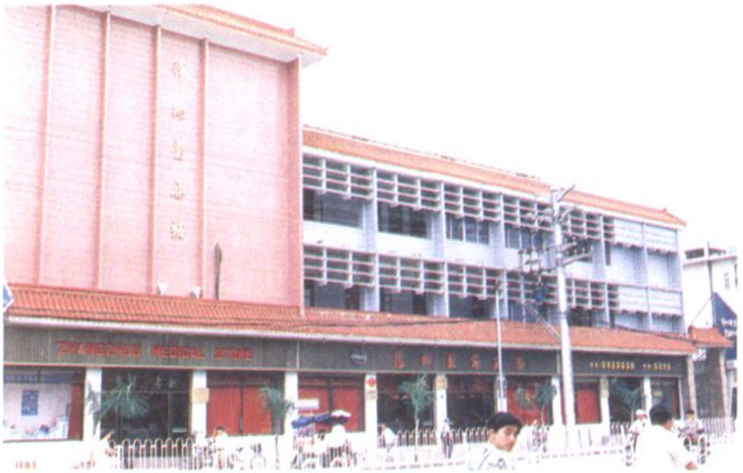
▶ 医药站中西药经营部