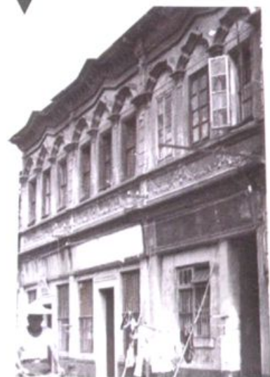
▲ 民国时期最大的私营药材行谦益旧址 （新华东路）