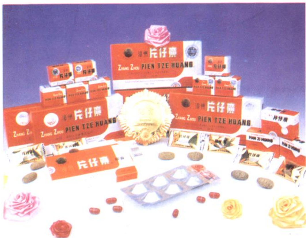
▲ 片仔癀 (荣获国家金质奖)