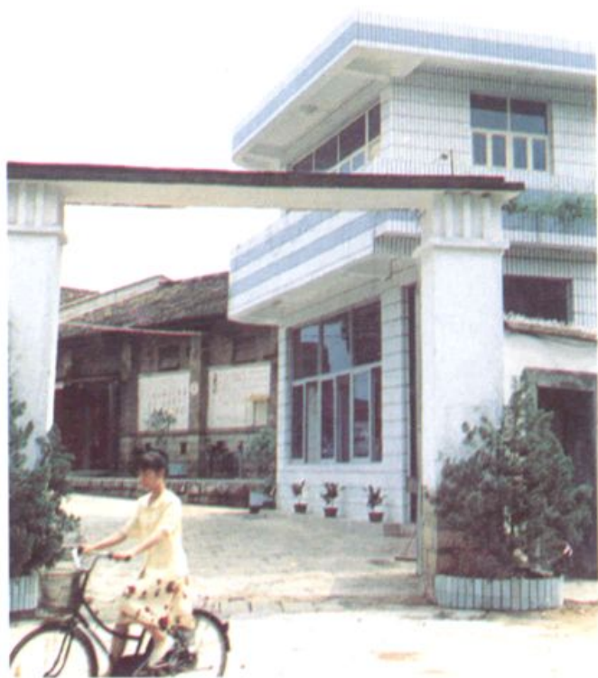
▼ 岭兜 中成药材仓库