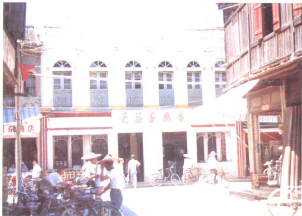
▼ 天益寿药局（台湾路）