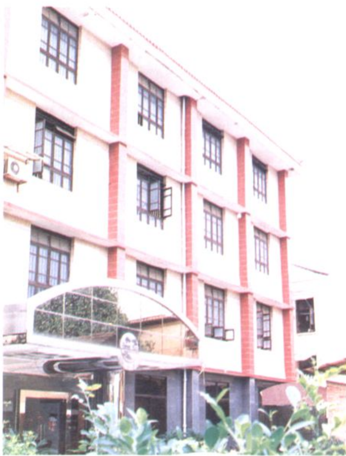
▲ 漳州医药站办公大楼