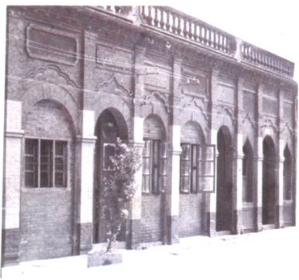
延续300多年的老笃诚 人参行旧址（新华东路）