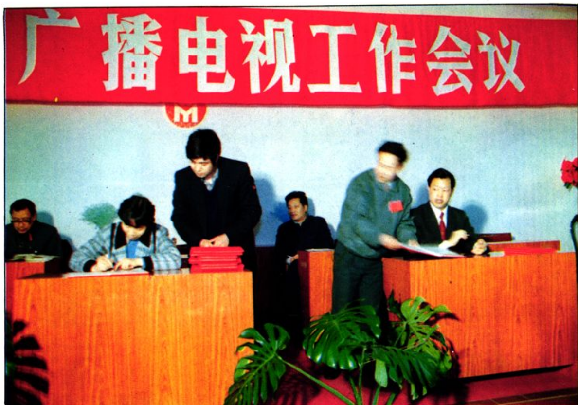
市政府与各县(市、区)领导签订农网目标责任书