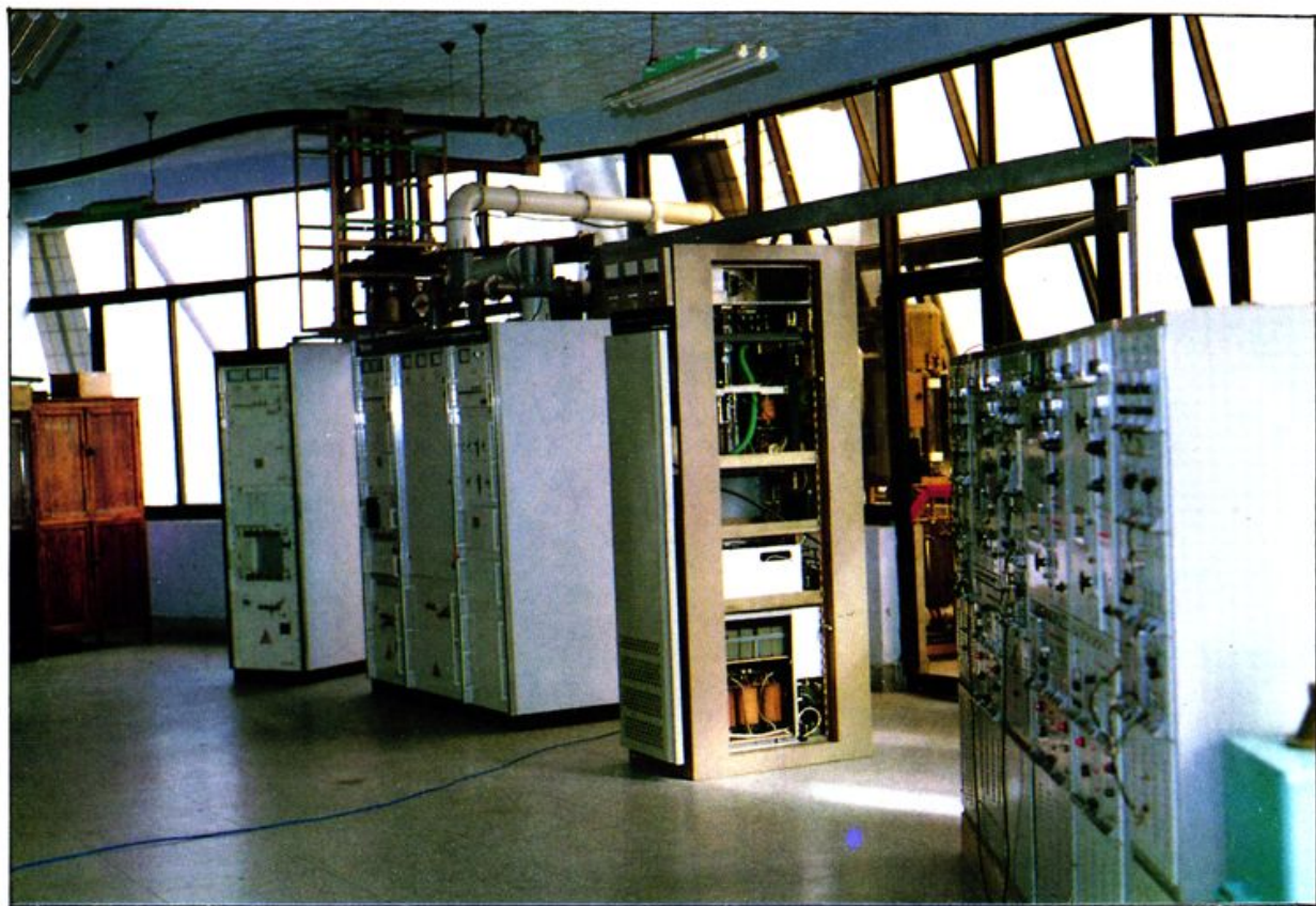
绵阳电视台发射机房