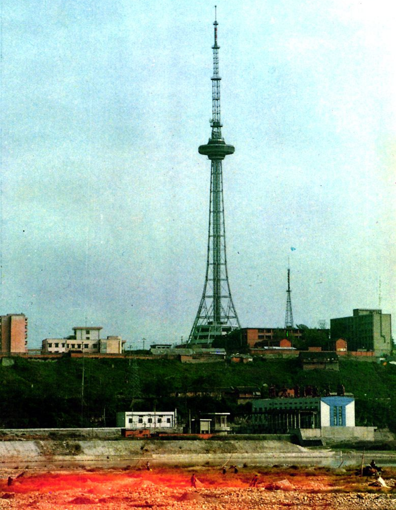
绵阳市广播电视综合发射塔(高 210 米)