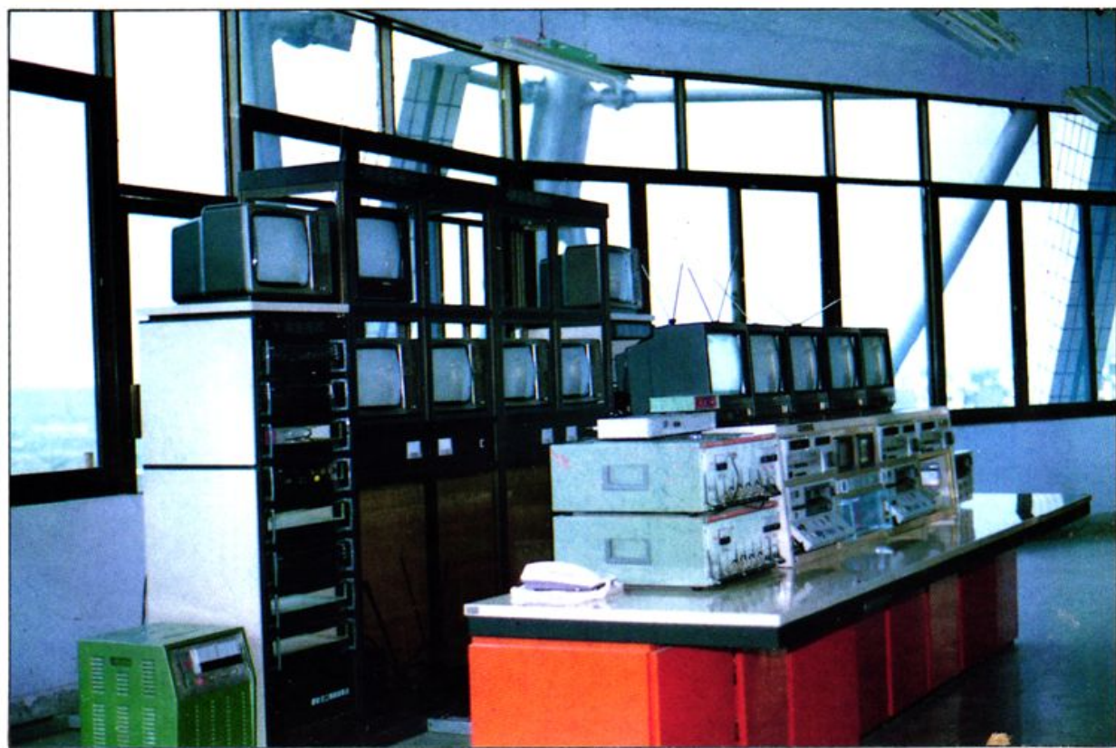
绵阳电视台发射机房中控室