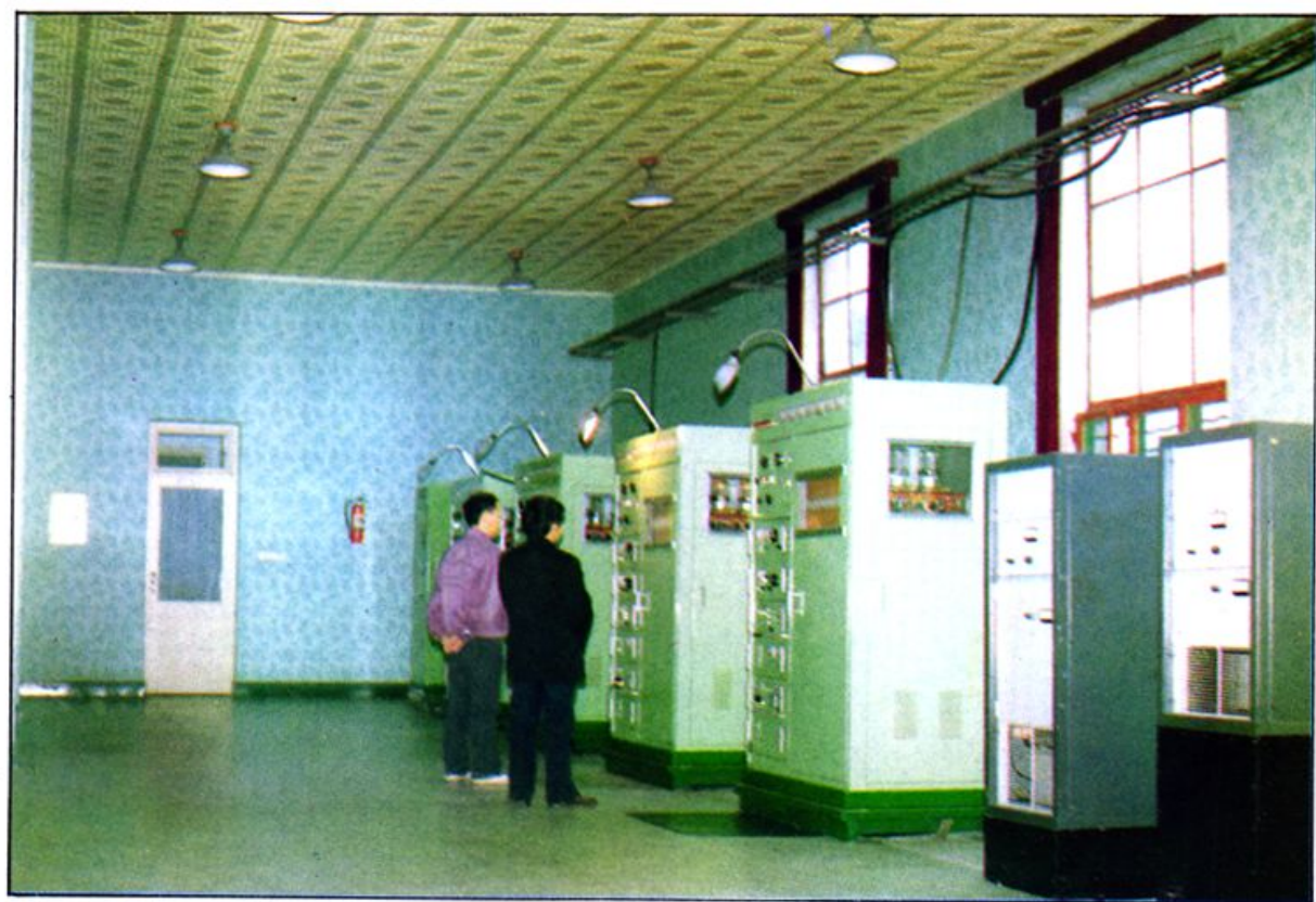
绵阳人民广播电台发射机房