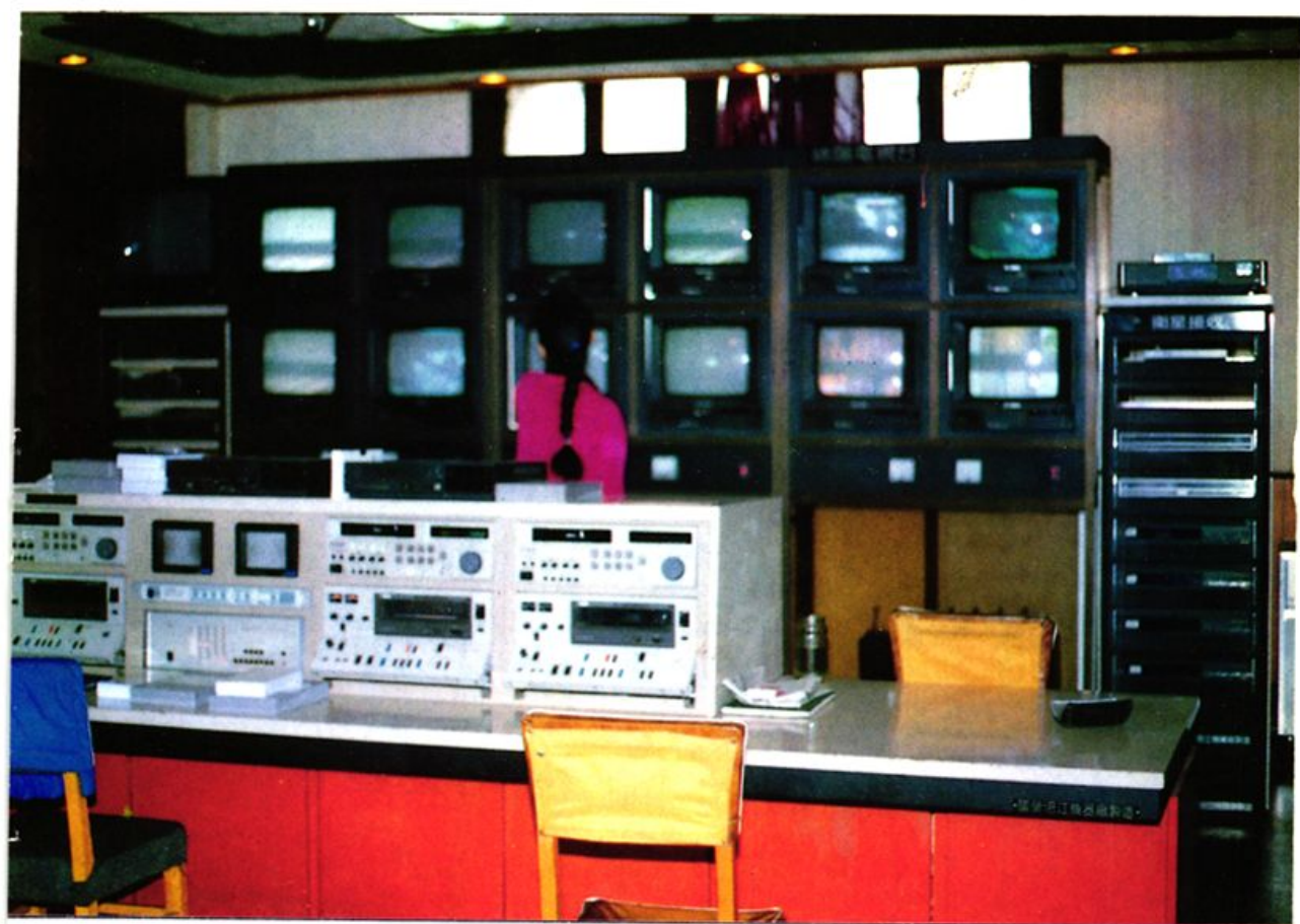
绵阳有线电视机房