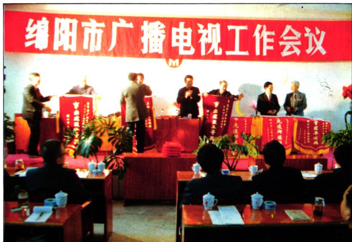
市政府向各县(市、区)颁发奖旗和证书