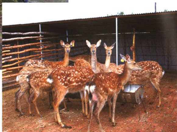
四海店镇农民家庭养鹿