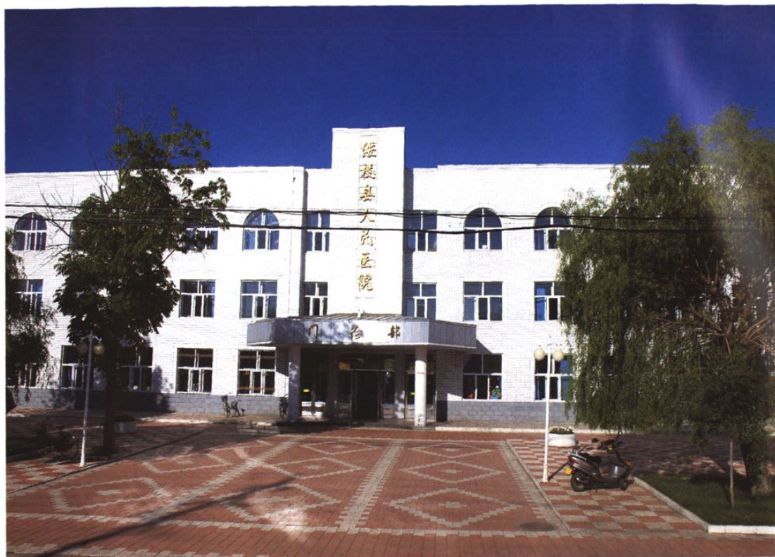
绥棱县人民医院门诊部