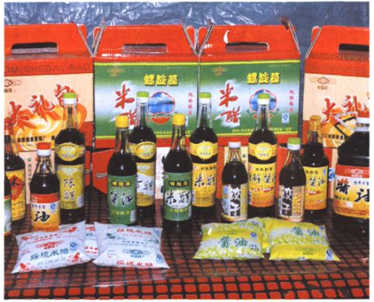
绥棘米醋系列产品