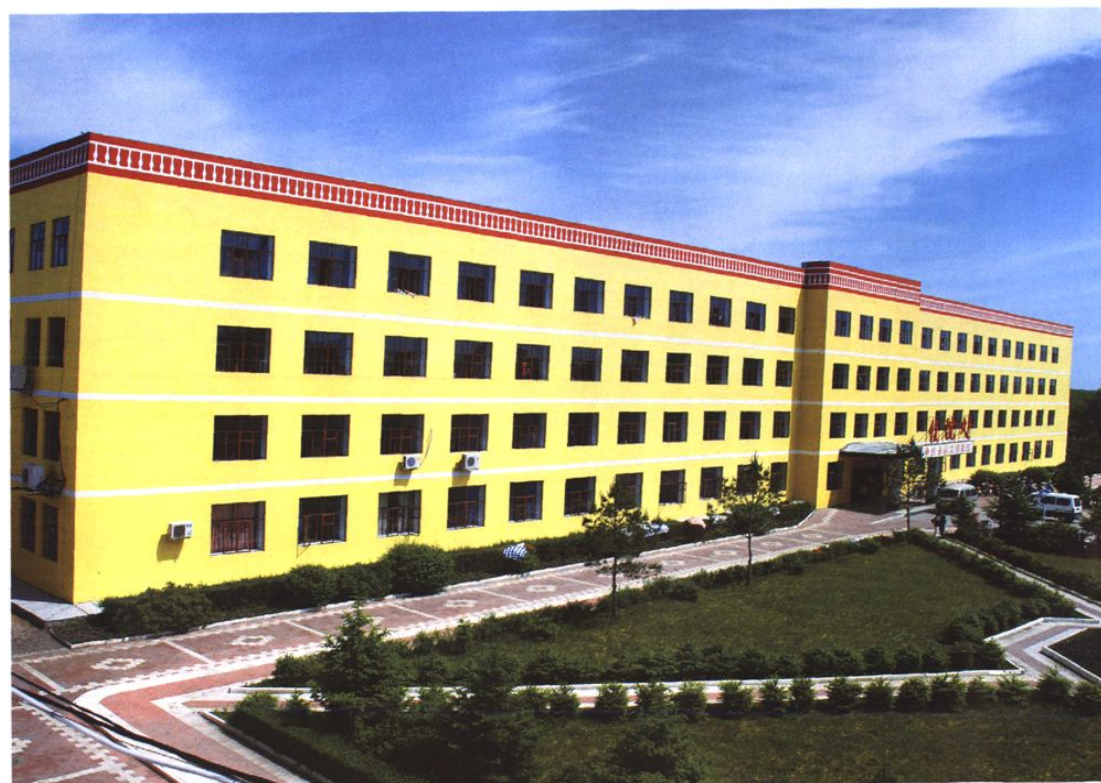
绥棱县人民医院住院处