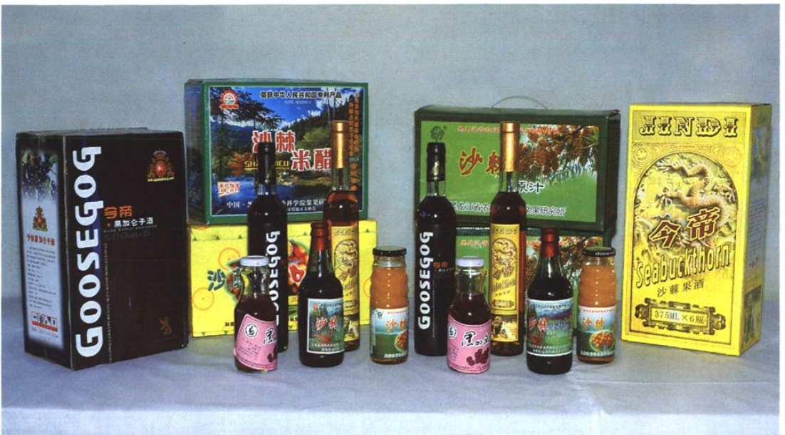
绥棘沙棘系列产品