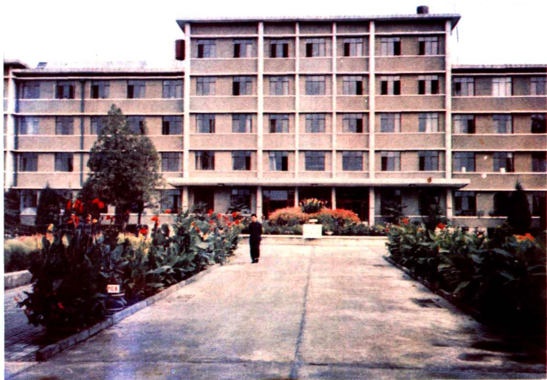
△ 蓟县政府、人大、政协办公楼