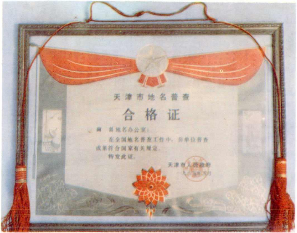
天津市人民政府颁发的蓟县首次地名普查合格证