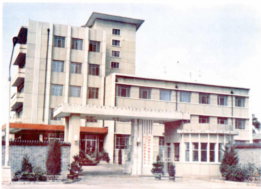
△中国共产党蓟县委员会