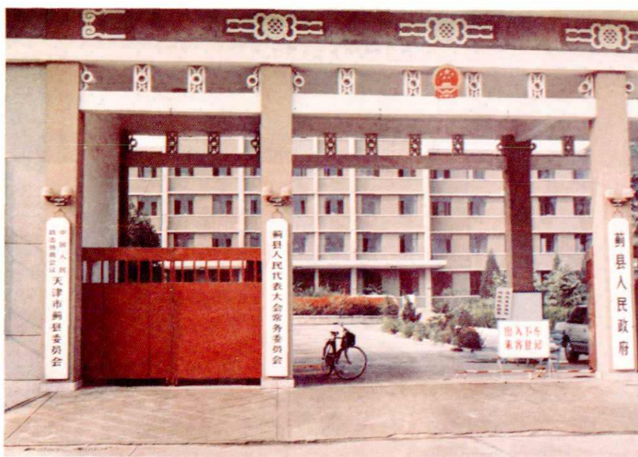
△蓟县人民代表大会常务委员会