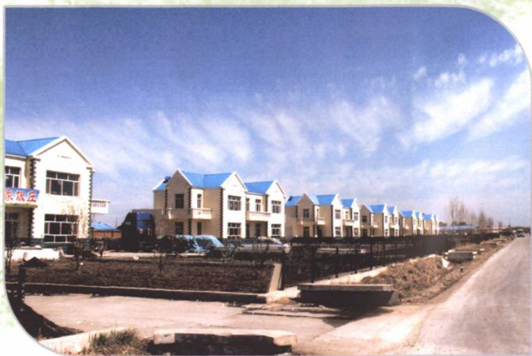
◆ 三合乡胜利村住宅小区