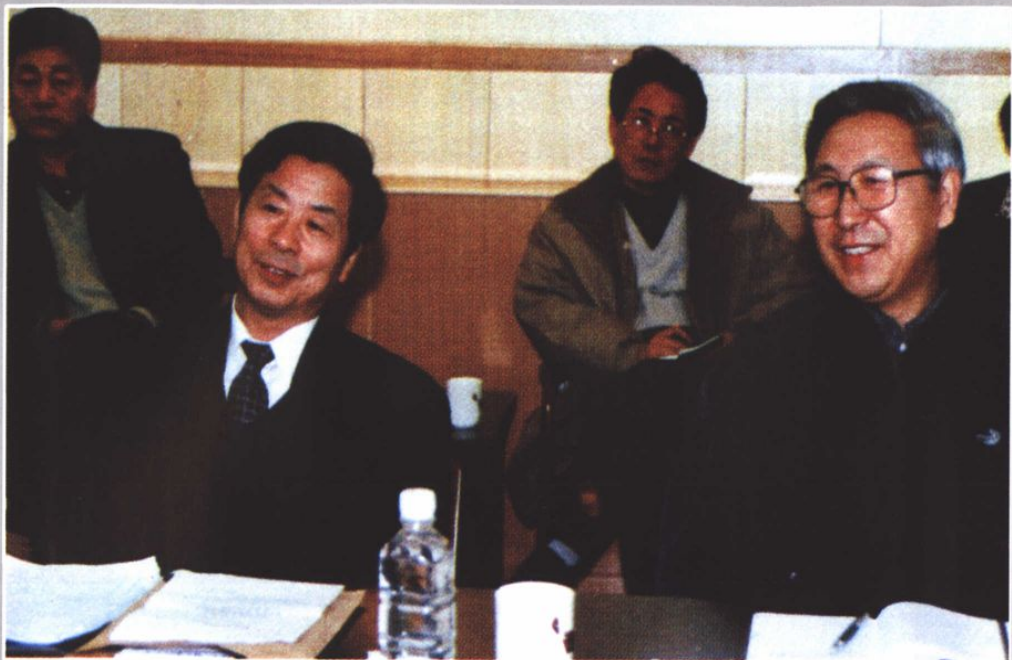
◆ 副省长王先民、市委书记刘海生到林甸研究地热开发