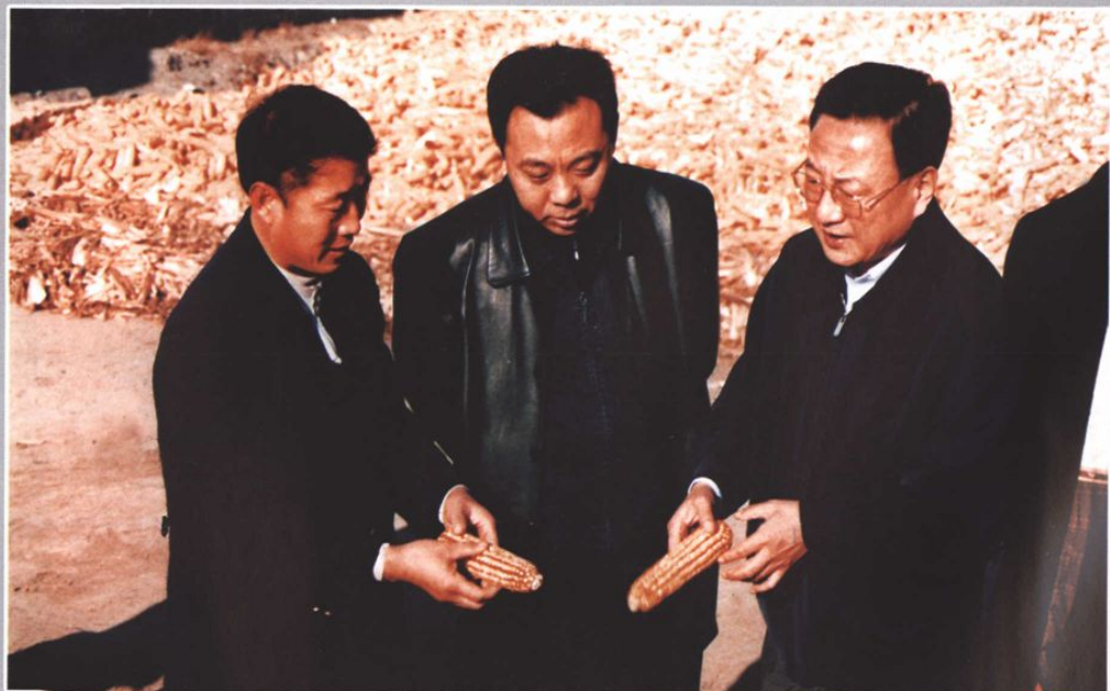
◆ 副省长申立国到林甸检查粮食生产