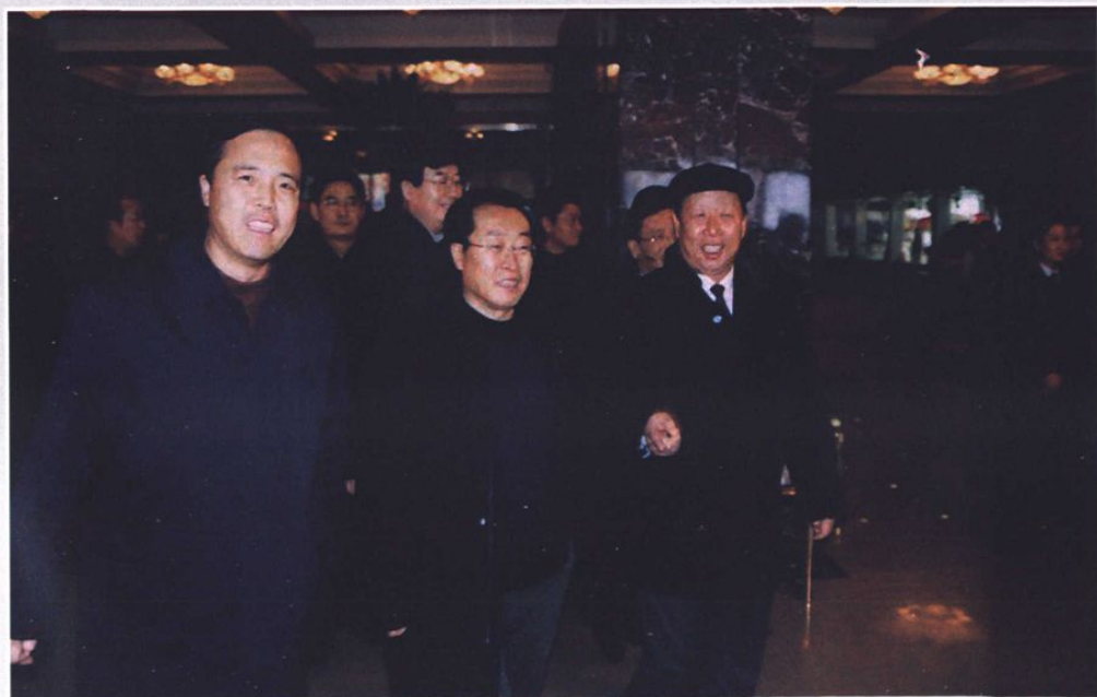
◆ 省委副书记、省长张左己来林甸视察