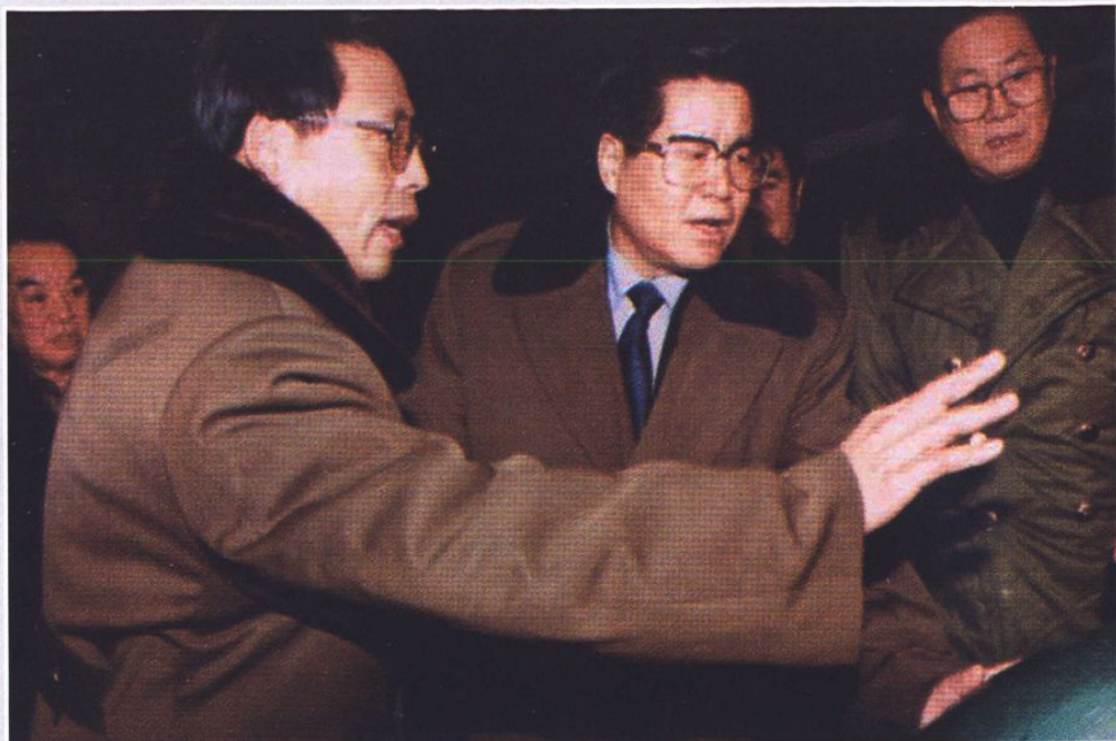
◆ 省委副书记、省长宋法棠、省政协主席马国良来林甸视察