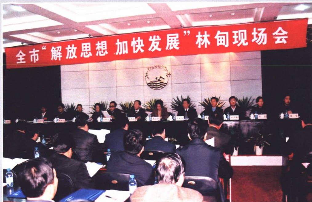
◆ 全市“解放思想 加快发展”林甸现场会