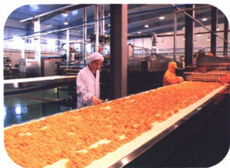
◆ 大庆星客食品有限公司