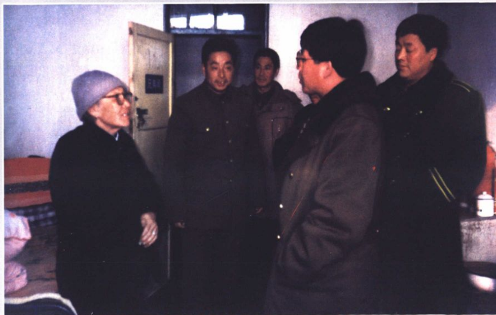
◆ 县委书记宋志臣走访贫困户