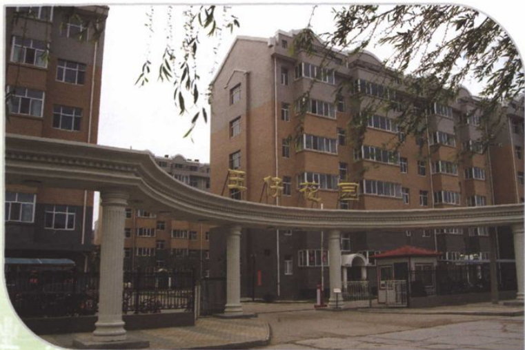
◆ 王仔花园住宅小区