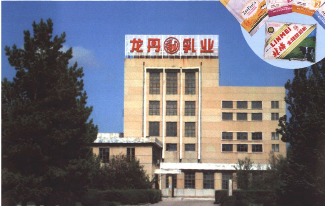
◆ 林甸龙丹乳业有限责任公司