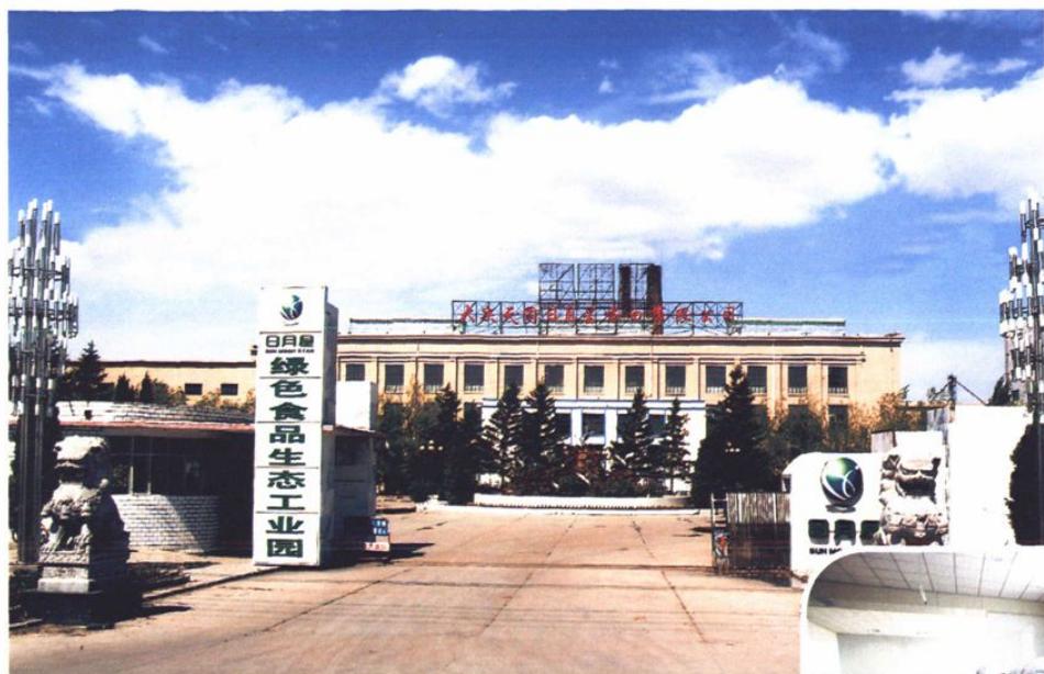
◆ 大庆天圆日月星蛋白有限公司