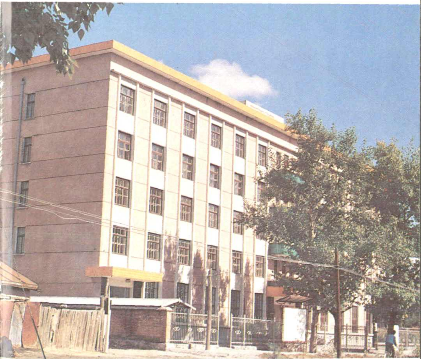
海拉尔市二轻局办公楼