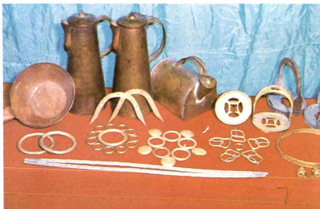
铜制民族用品 民族用品厂