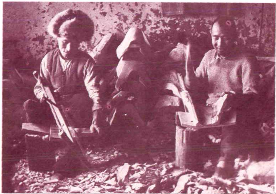
天兴合鞍鞴铺工人制做马鞍子