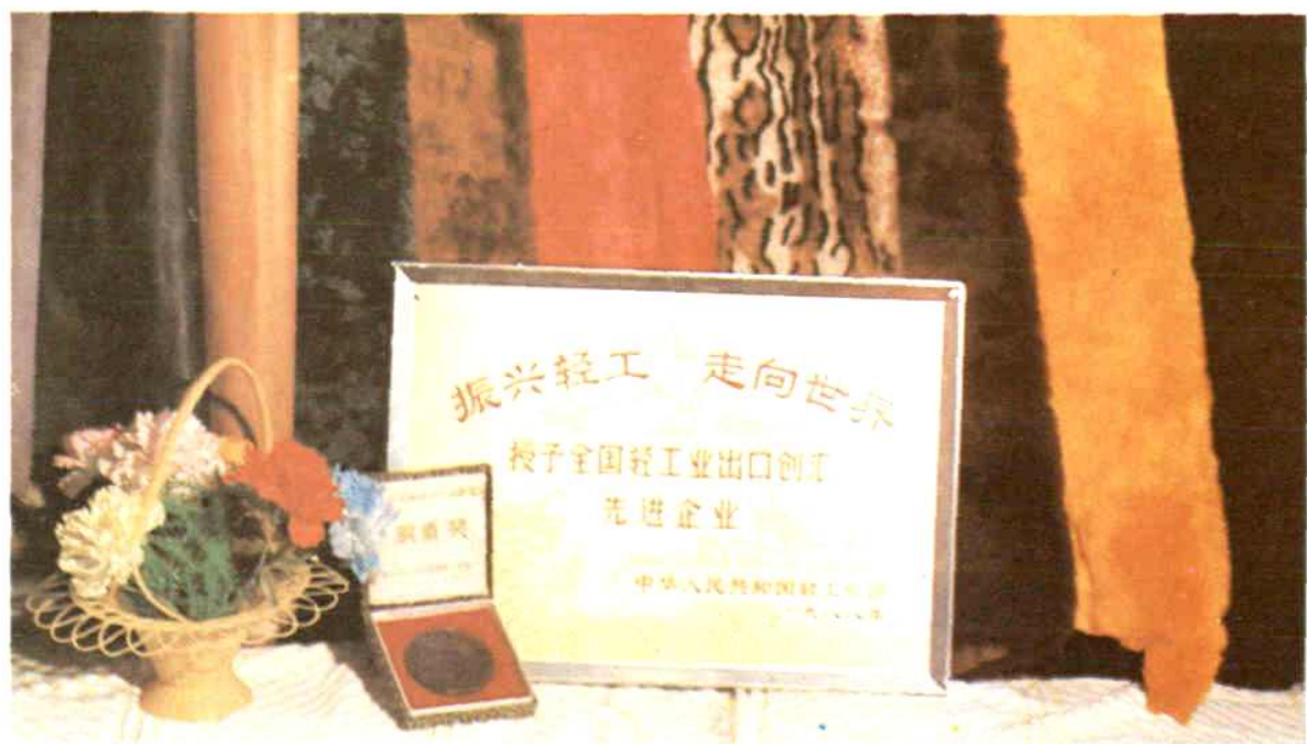
出口产品雪莲牌毛司维革 国营毛皮厂 雪蓉牌苏式皮大衣 自治区优质产品 皮毛厂