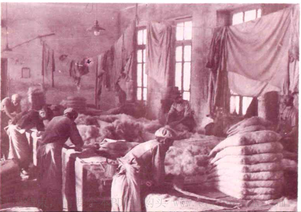
皮毛社毡疋磨车间一角