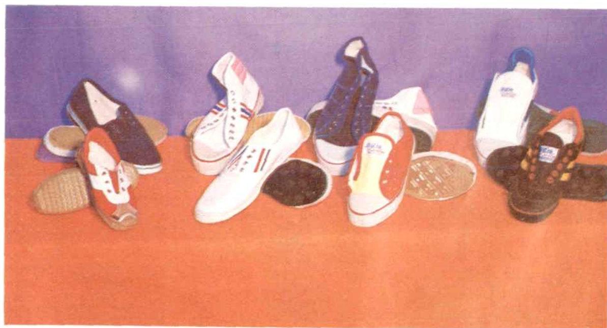
橡胶厂部分胶鞋产品