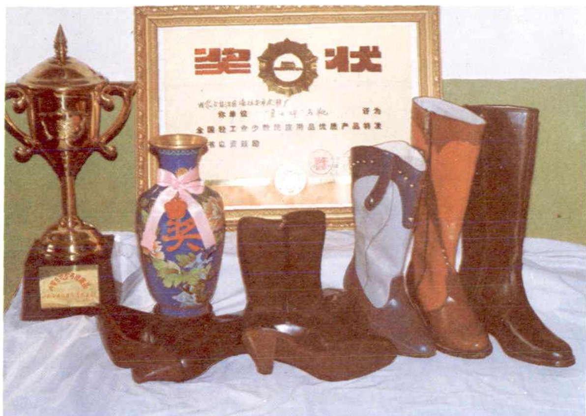
勇士牌马靴 轻工业部优质产品 皮鞋厂