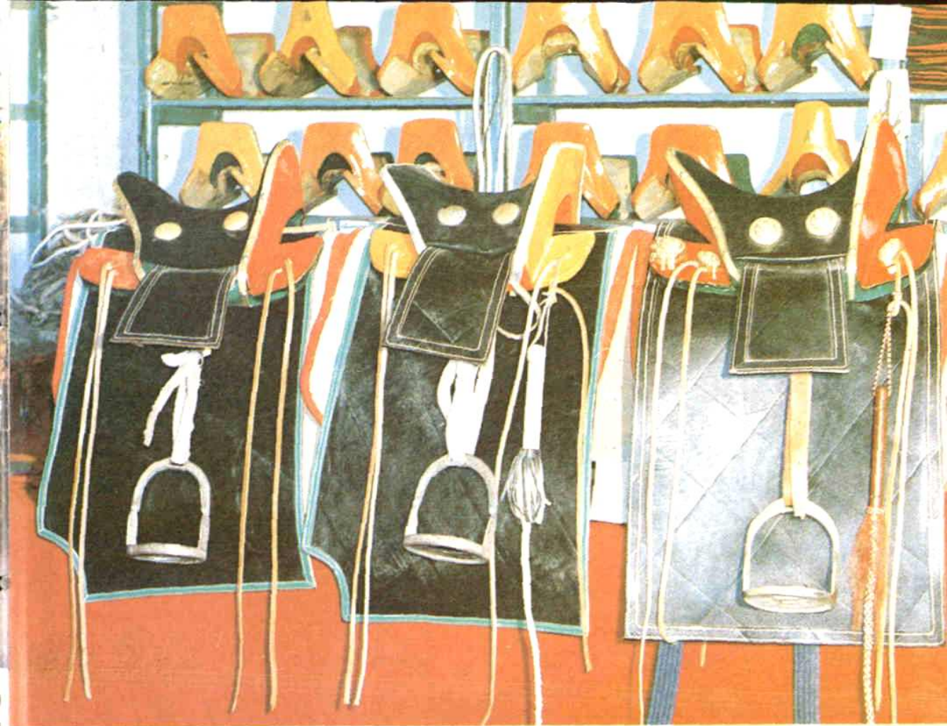
民族用品厂鞍具柜台