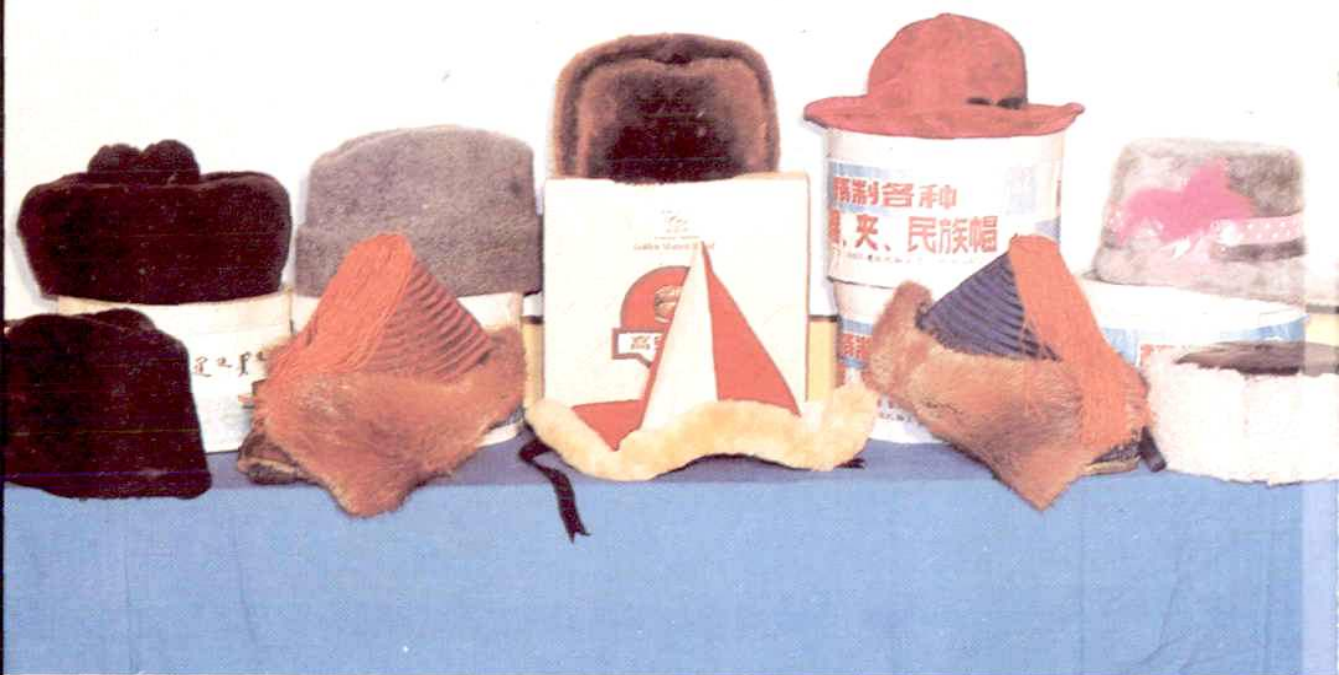
各种民族帽 制帽厂