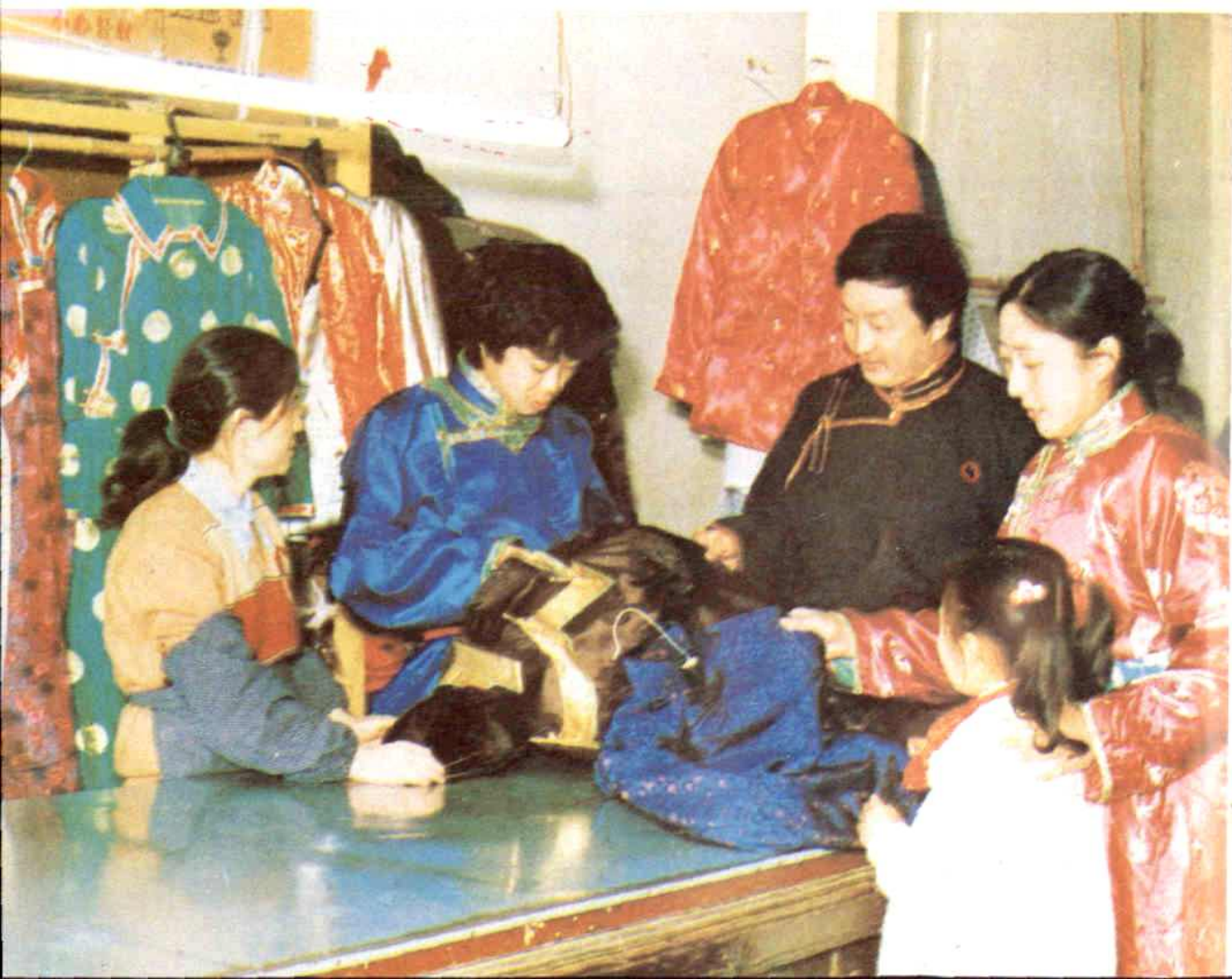
民族服装厂加工门市部