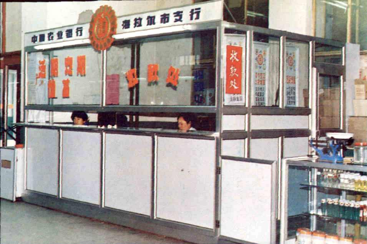
钢窗厂为农业银行制做的铝合金营业厅