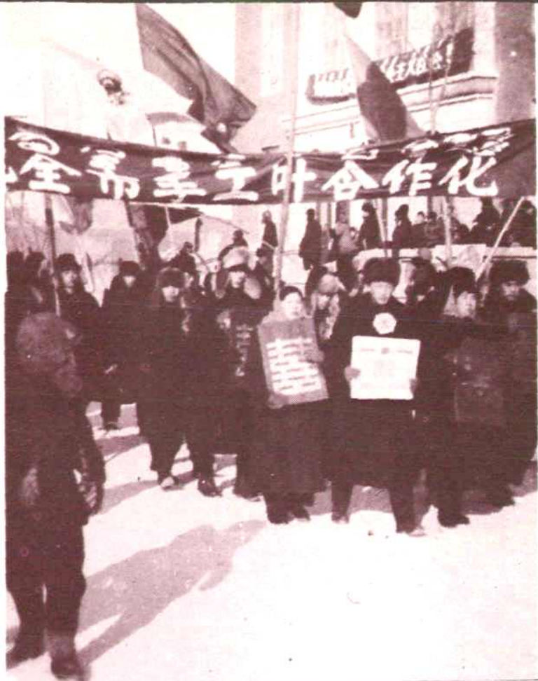
庆祝海市 手工业合作化 照片二帧 (1956. 1)