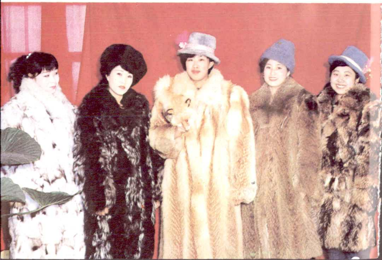
出口裘皮大衣 制帽厂