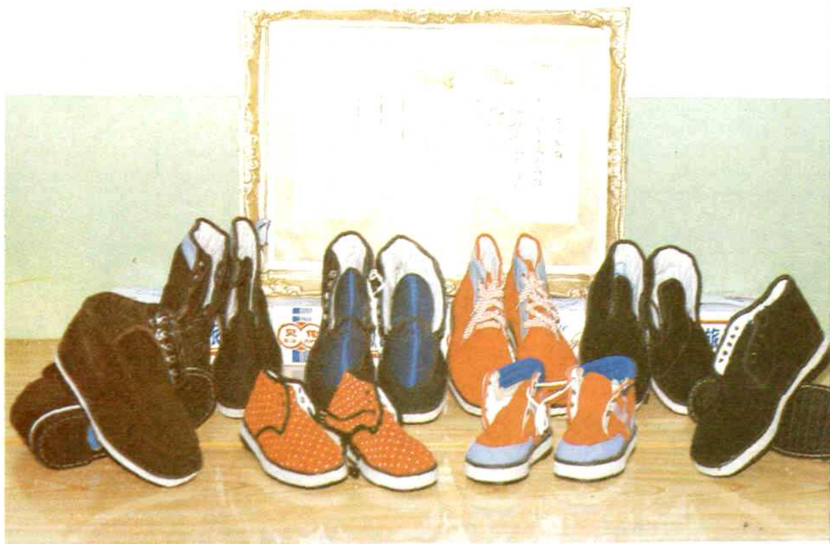
贝伦牌男女毡底棉鞋