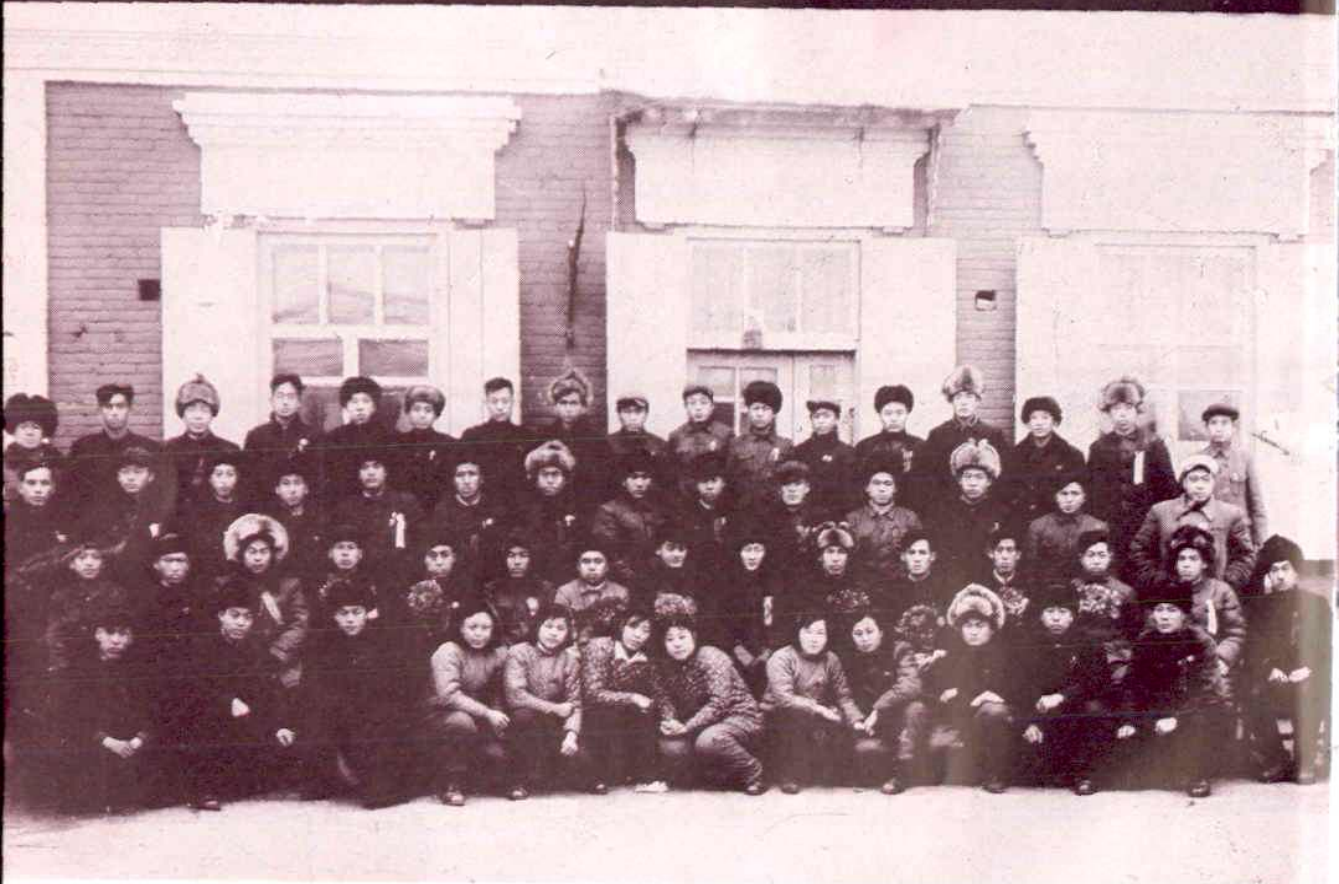
海市手工业联社首届一次社员代表大会全体合影 (1954, 12.17)

海拉爾市手工業生產合作社聯合社首屆第一次社員代表大會全體合影 1954.12.17