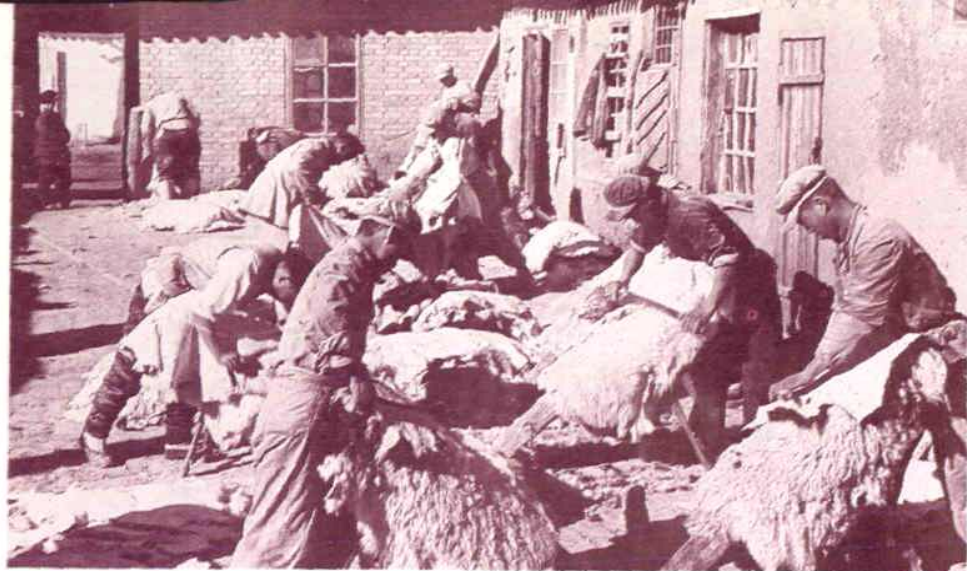
皮毛社刮皮小组在劳动中