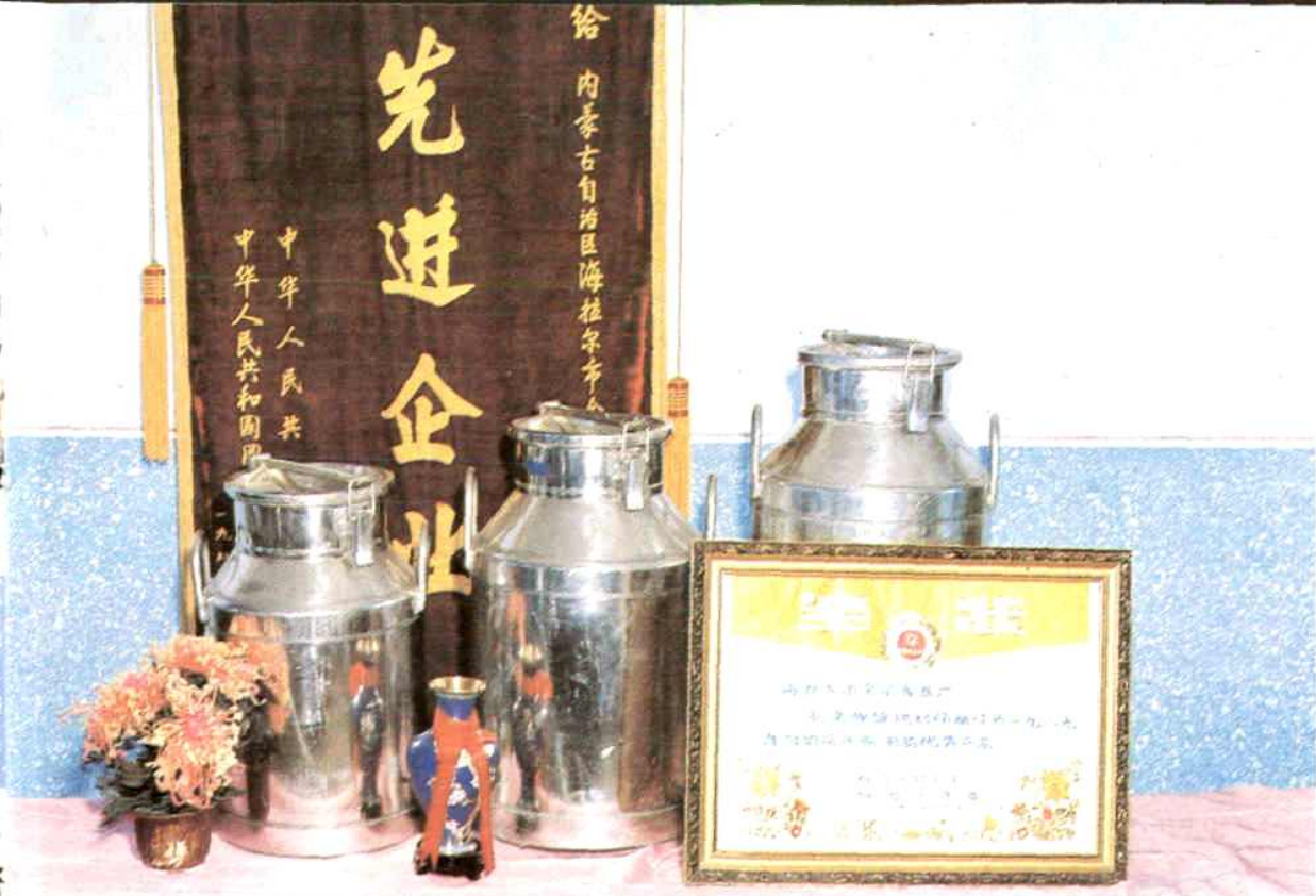
乳泉牌镀锡奶桶 金属容器厂