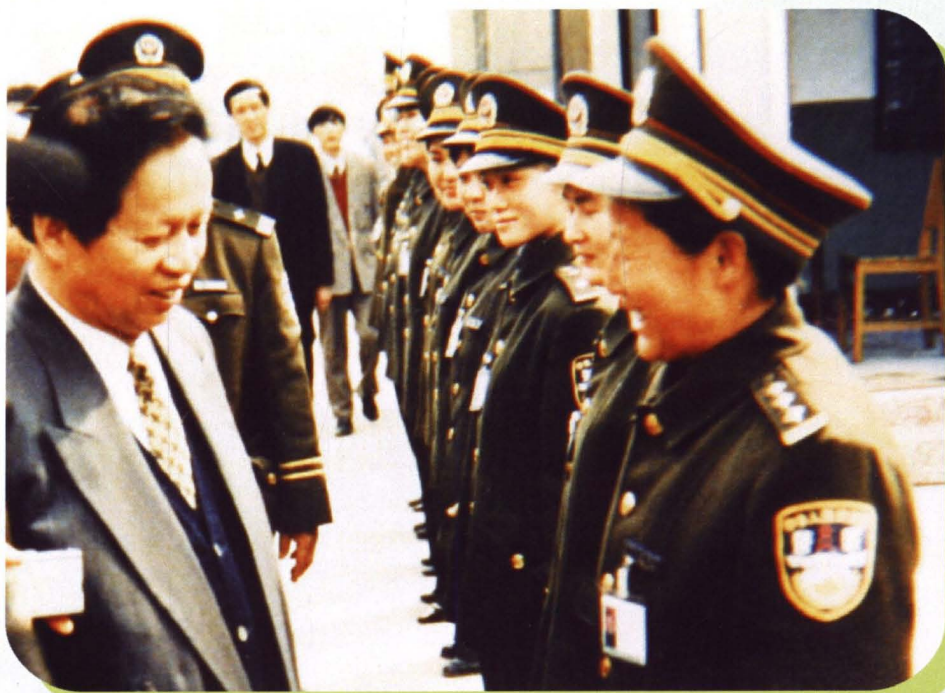
■ 2001年10月，司法部部长肖扬（左一）接见武汉市劳教干警