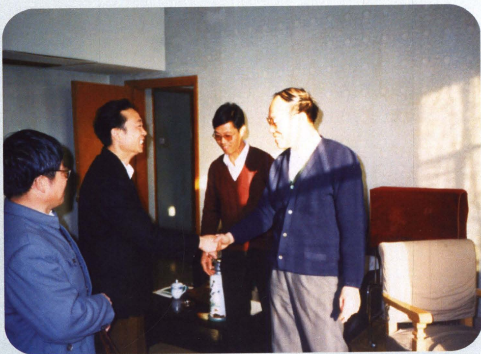
■ 1987年10月，司法部部长金剑（右一）检查武汉市普法教育工作