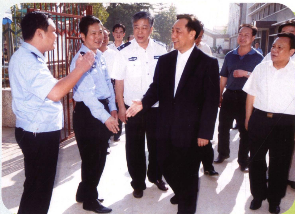
■ 2007年6月，司法部副部长陈训秋（右二）看望戒毒所劳教干警