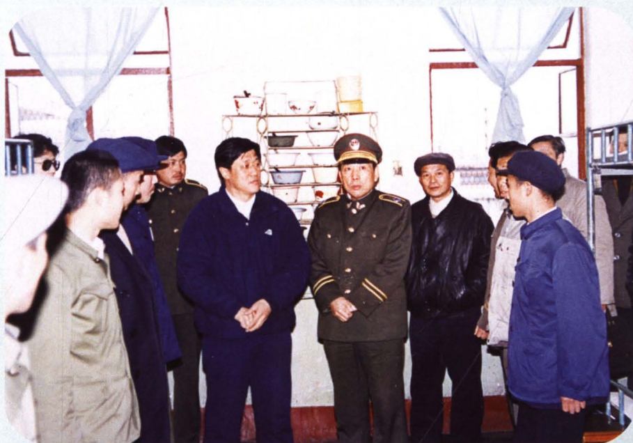
■ 1988年10月，市长王守海（中）到何湾劳教所看望劳教学员