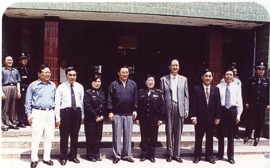
■ 1999年5月，中央政法委书记罗干（左四）与何湾劳教所干警合影