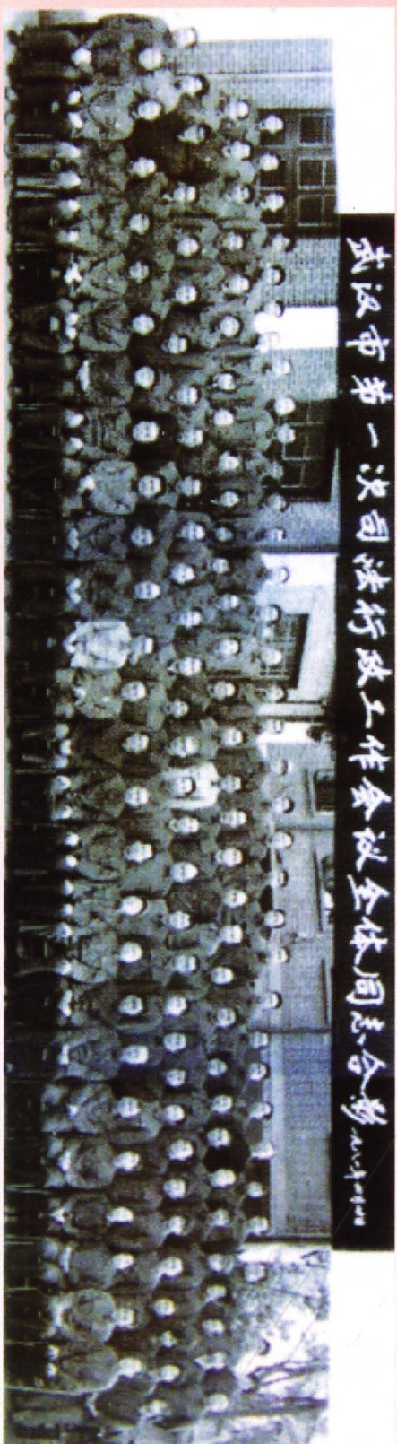
1981年4月武汉市第一次司法行政工作会议全体合影