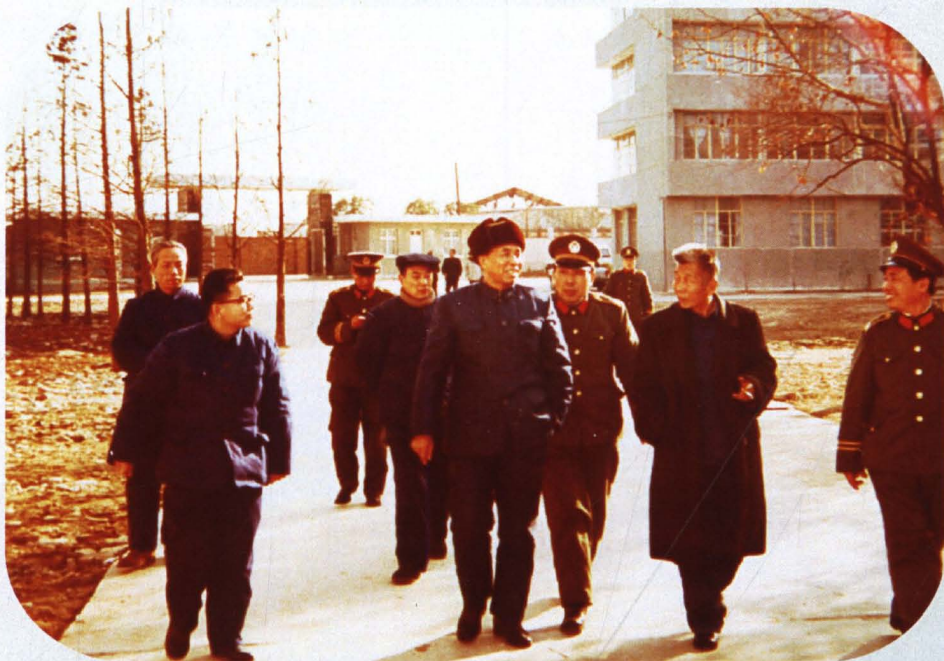
■ 1984年12月，中共中央政治局常委、纪委书记，时任武汉市市长的吴官正（左二）在市司法局局长黄德炎（左一）的陪同下视察武汉女子劳教所