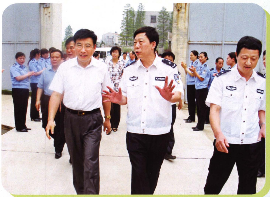
■ 2005年7月，武汉市委书记苗圩（左一）视察武汉市劳教场所