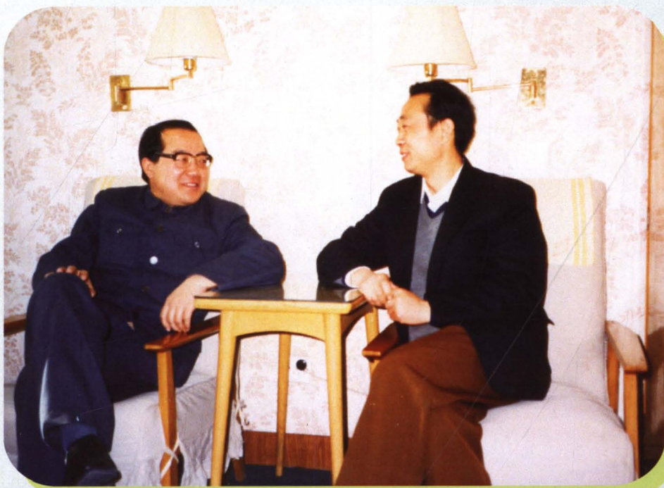
■ 1988年4月，司法部副部长张耕（左一）听取武汉市普法工作汇报