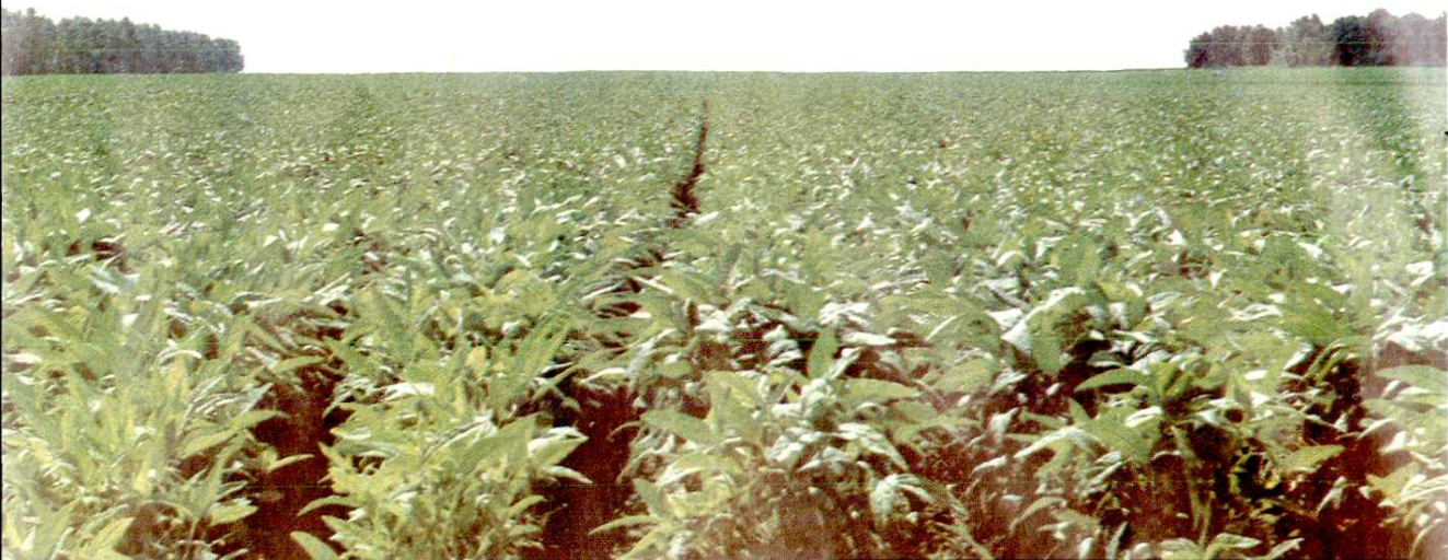
大豆主栽品种北83-3308长势喜人