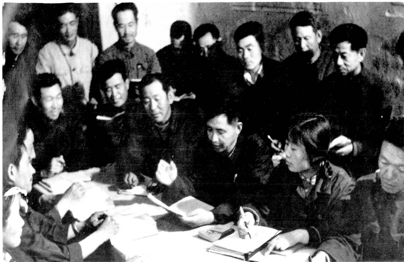
60年代末，农场革命委员会成员在研究工作。