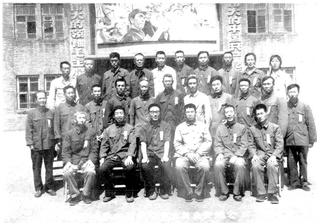
1979年7月18日，中共长水河农场第五届全委合影。