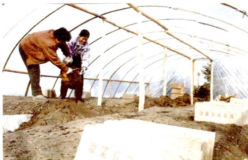
甜菜纸筒育苗技术引入农场