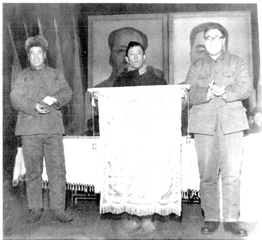
1979年，长水河农场农业大丰收，赢利396万元，第一次实现扭亏为盈，农场召开大会表彰先进单位和个人。