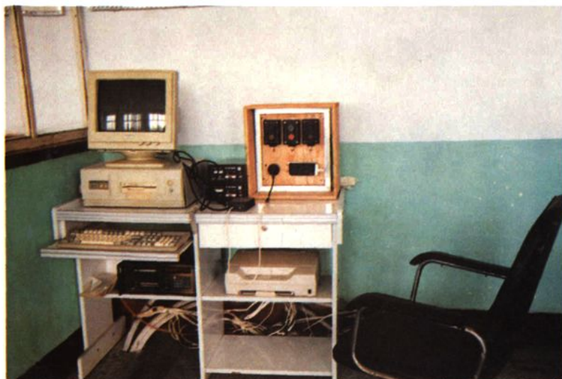
微喷灌溉的微机室