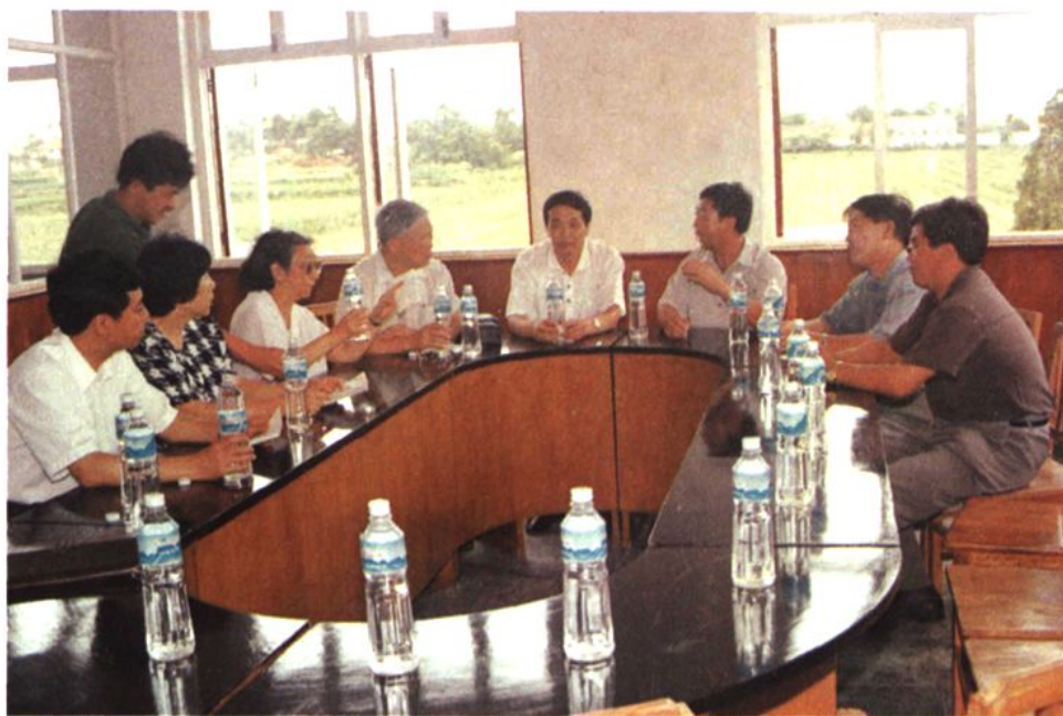
1994年原水电部部长、现全国政协副主席钱正英来西古现视察工作。（左起四人钱正英）