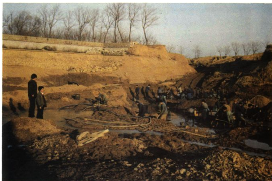
一九九三年建下河大口井施工现场