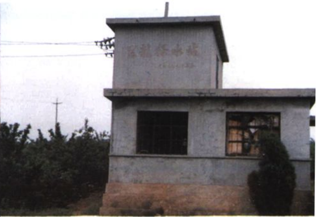
西古现部分水利工程（金矿大口井、南泊大口井、东风池，松岚塔扬水站、龙王庙扬水站、巨龙扬水站）