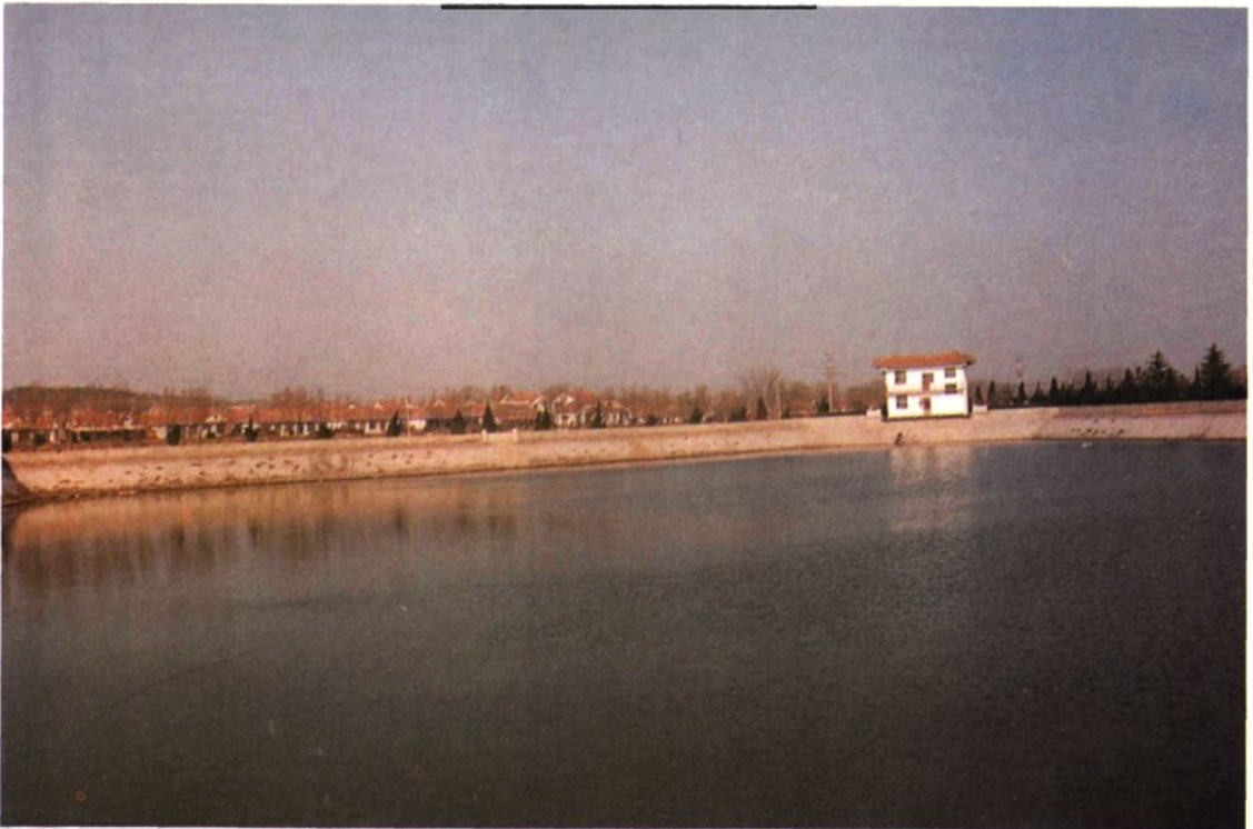
清阳园 清阳池大口井