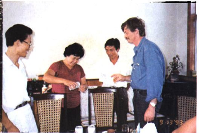
皮特在于笃平家进午餐