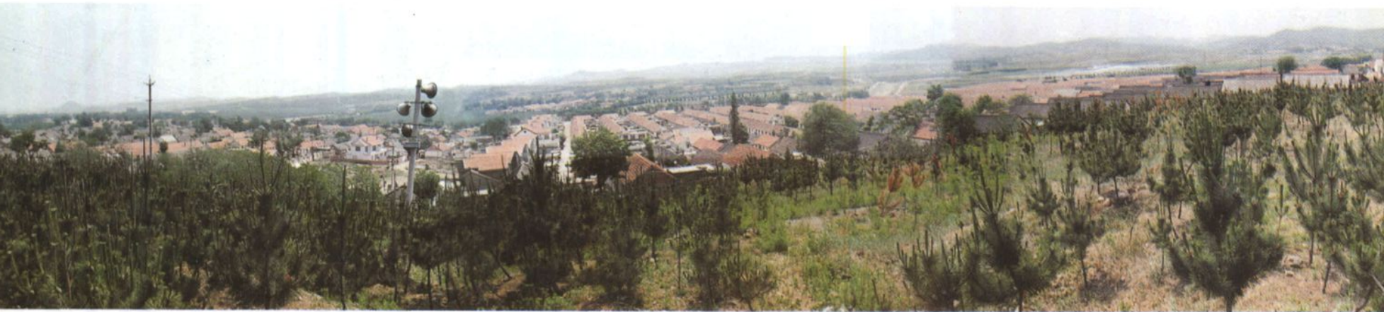
村区鸟瞰（自西孤顶）