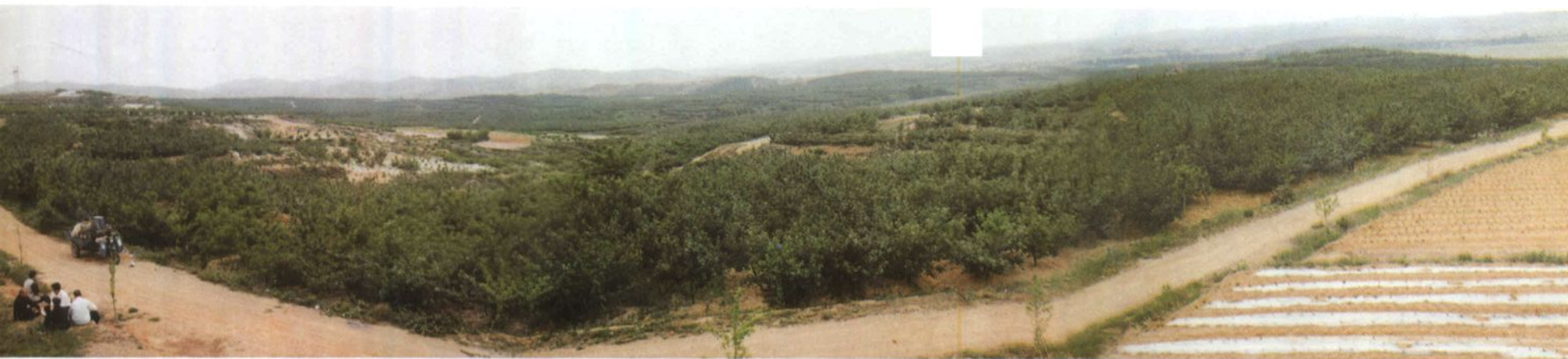
村区鸟瞰（自龙王庙）