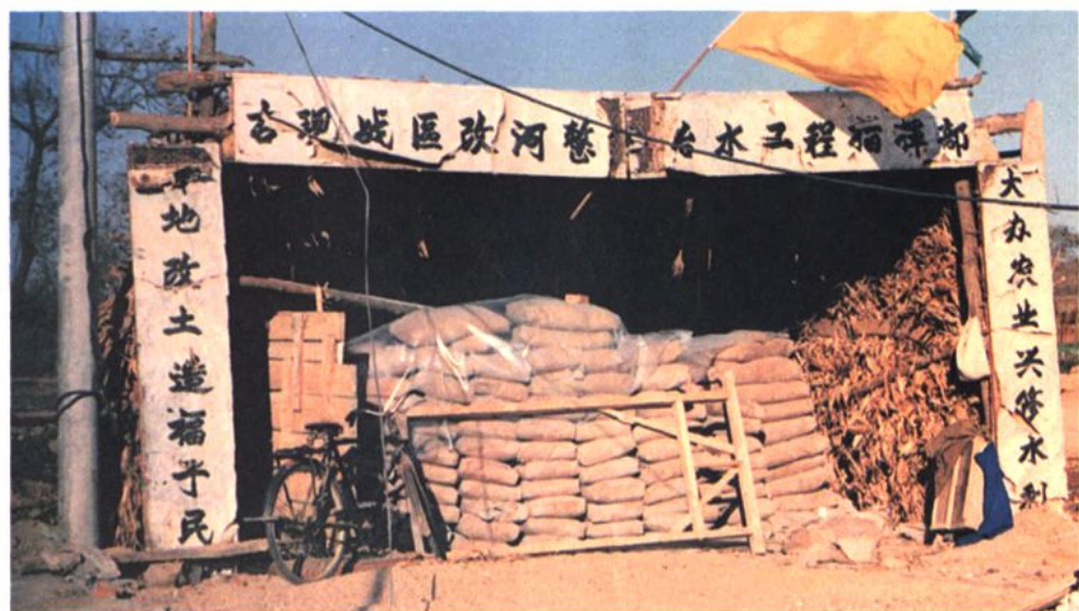
一九九〇年、一九九一年施工中的清阳池、清阳楼