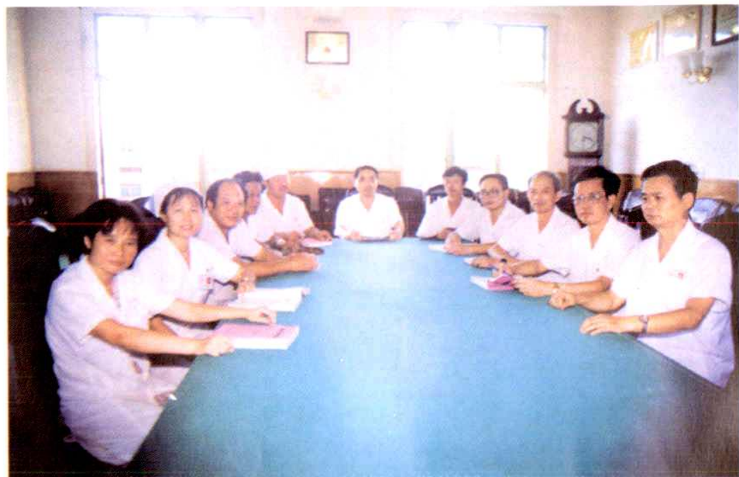
丰城市人民医院志审编委员会成员合影