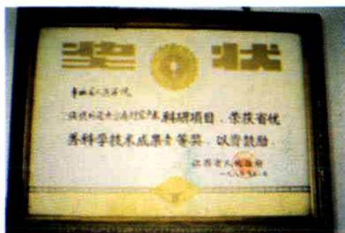
省优秀科学技术成果一等奖