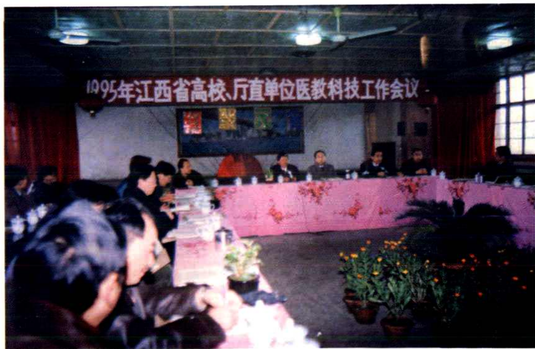
省高校、厅直单位医教科技工作会议首次在县市级医院——本院召开。（1995年2月21日）