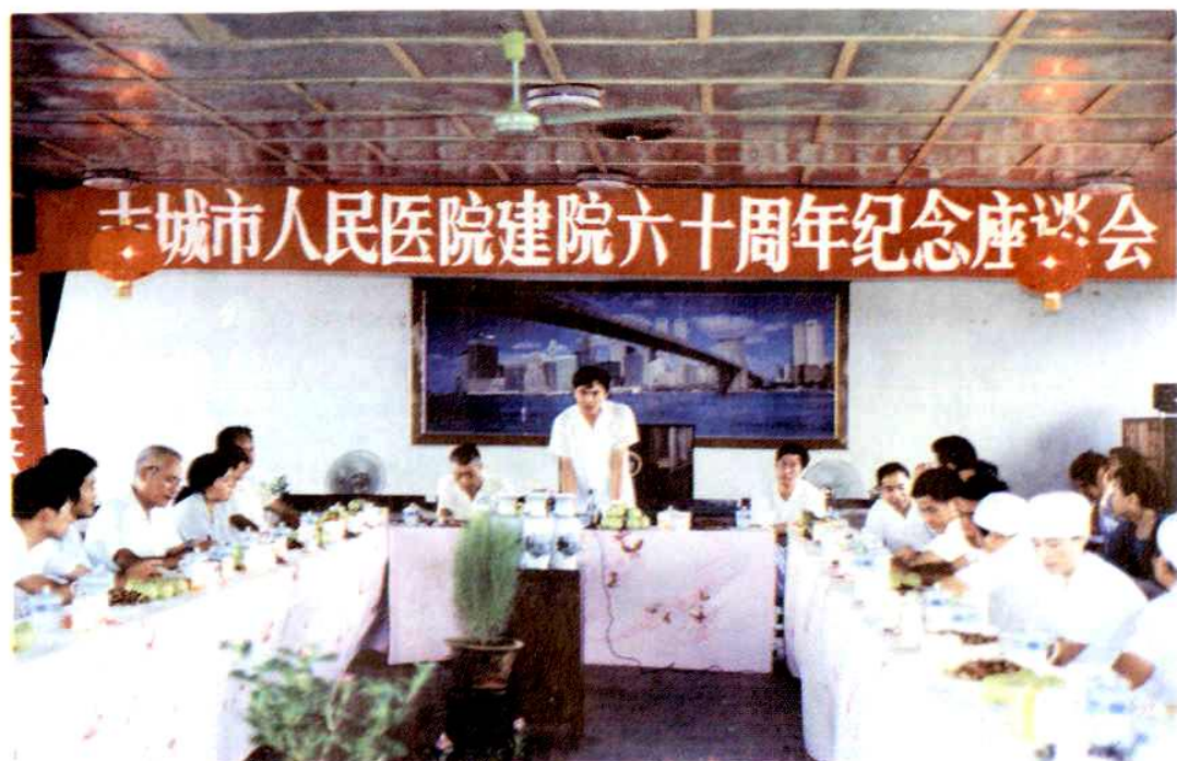
图为1991年8月15日建院六十周年座谈会