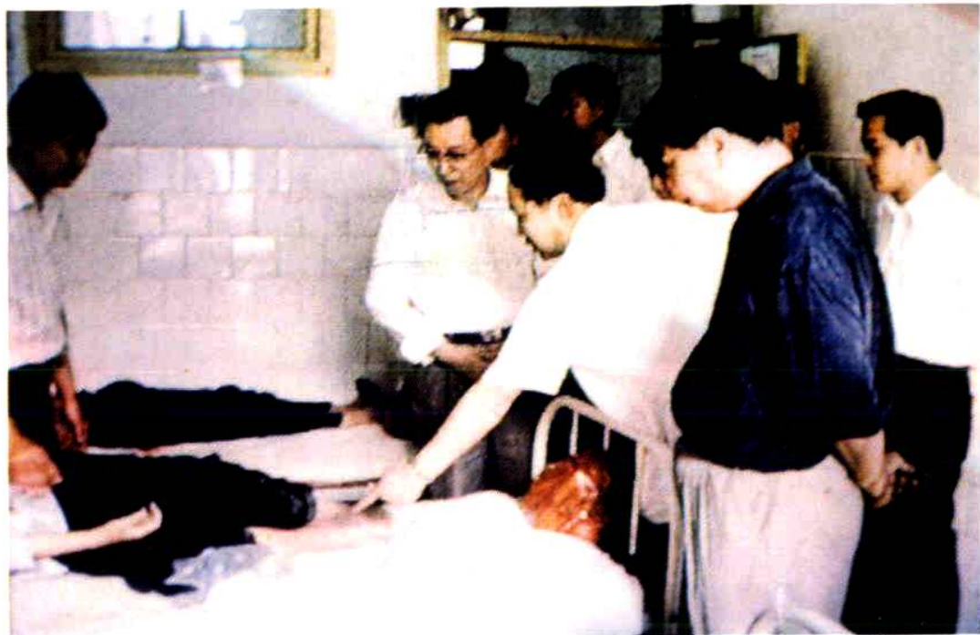
省长舒圣佑在宜春行署专员伍自尧、丰城市委书记胡芳兰陪同下，到医院慰问遭风暴袭击受伤的农民及学生。（1998年4月23日）