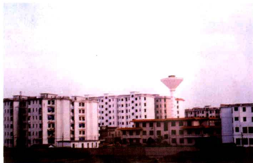
排列 成行的职 工宿舍