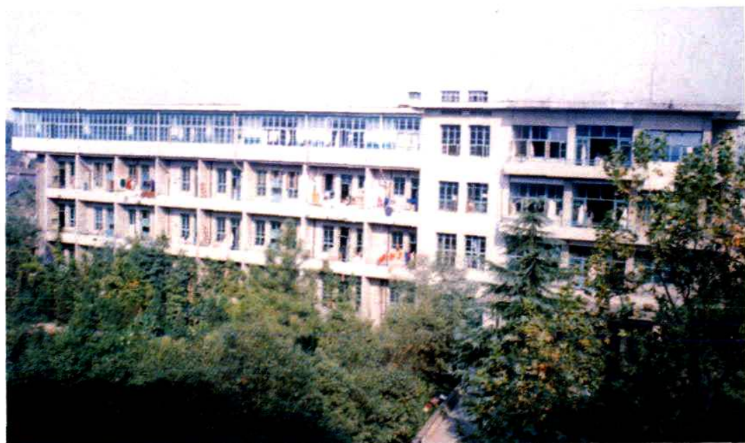
曲廊相连的住院部（1981年建）