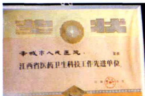
1991年10月江西省卫生厅授予本院为江西省医药卫生科技工作先进单位。