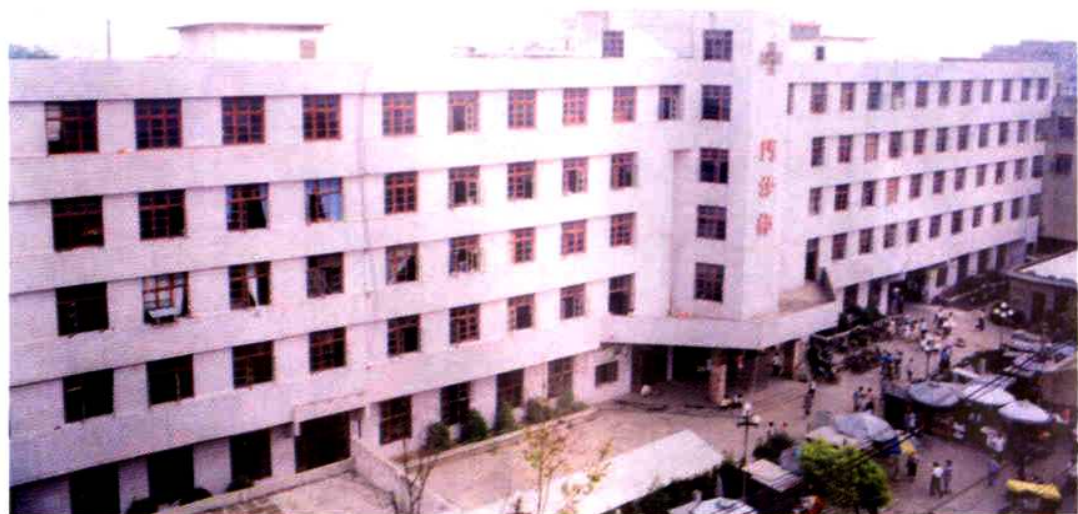
功能较全的门诊部（1988年10月建）