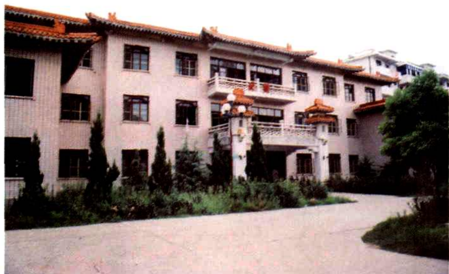
典雅 古朴的北 楼病区 (1990年)