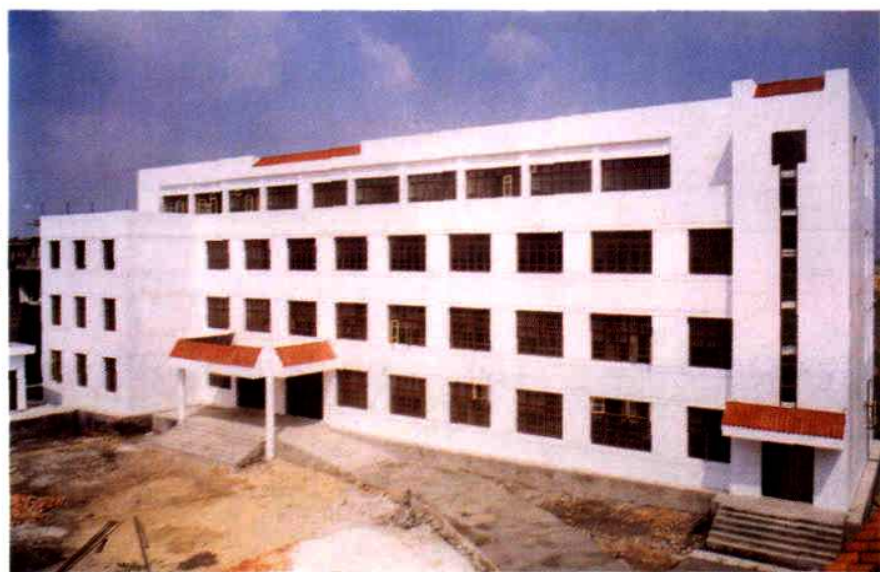
宽敞 明亮的教 学楼