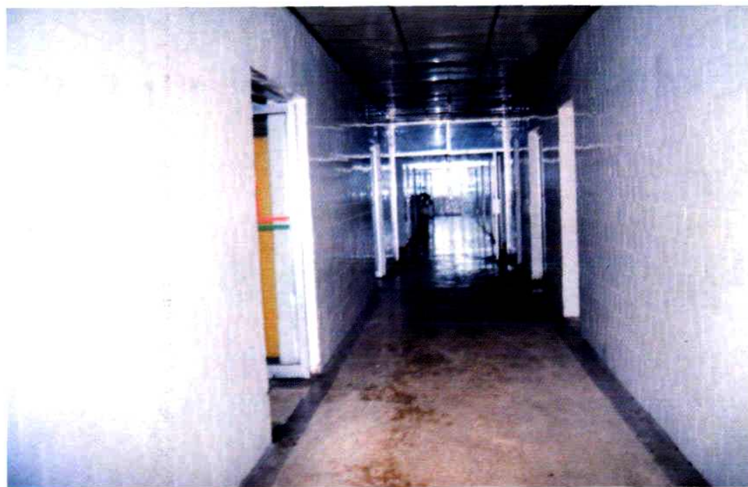
设施先进的手术室（1991年）