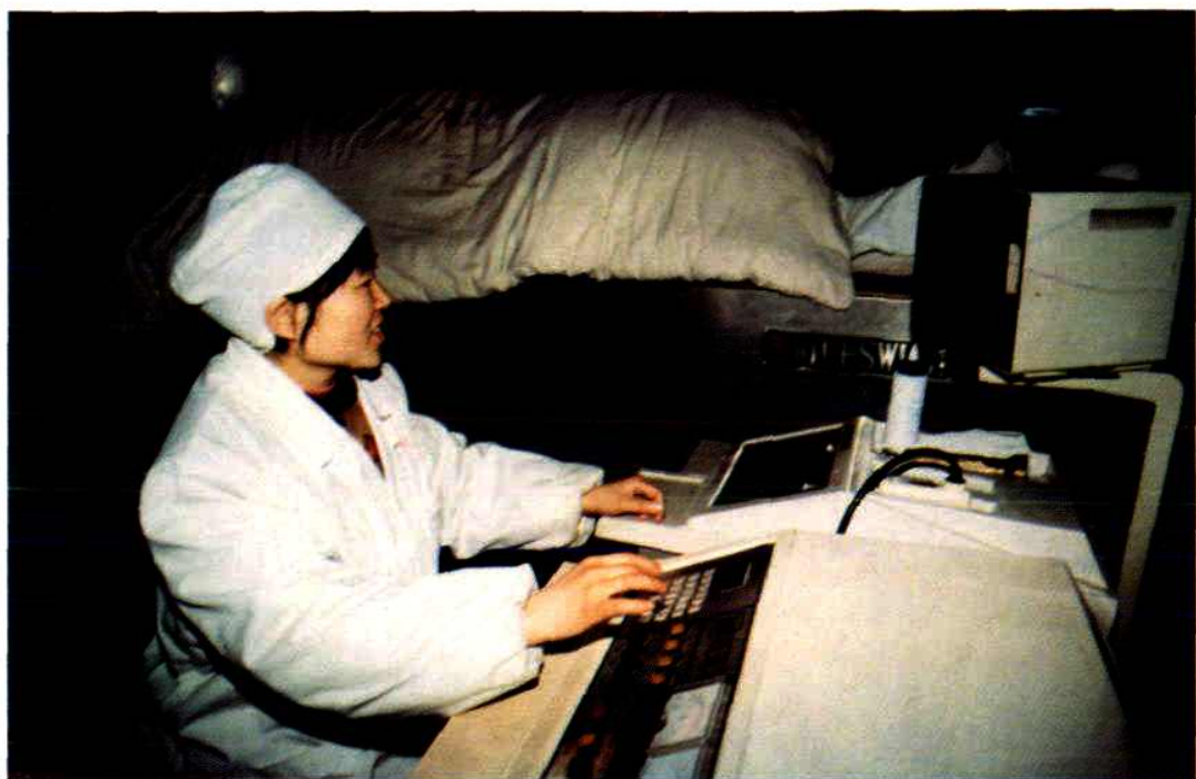
MPESWL91 型震波碎石机 (1988 年)