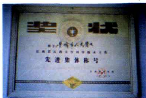
1990年6月、江西省卫生厅授予省医卫生科技工作先进集体。