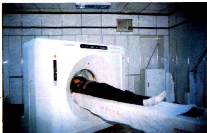
CE公司产 CT(1996年7 月)