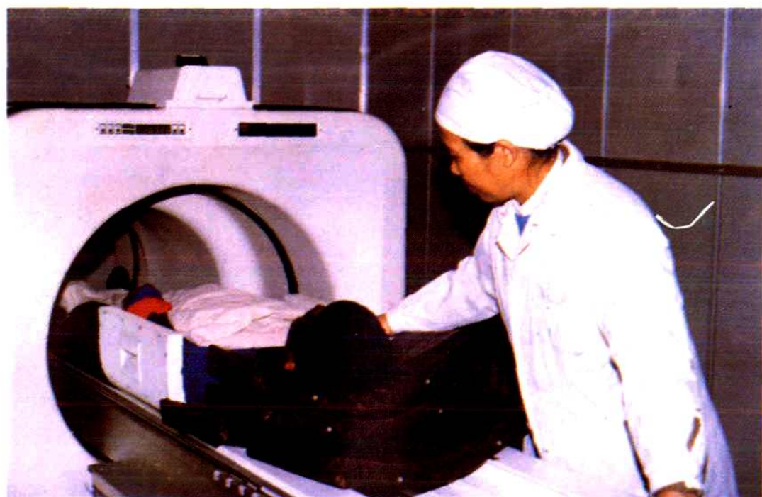
LMW-400 型磁共振 (1991 年)