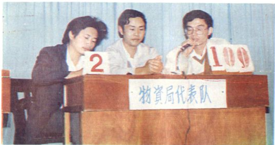
知识竞赛。 州市计委口组织的 市物资局参加漳