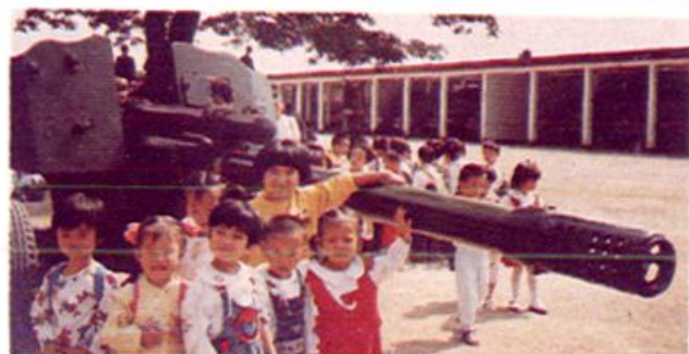
▲ 漳州市物资幼儿园重视抓好少儿国防知识的启蒙教育。图为该园组织小朋友到驻地某高炮团观看装备和战士表演操炮。