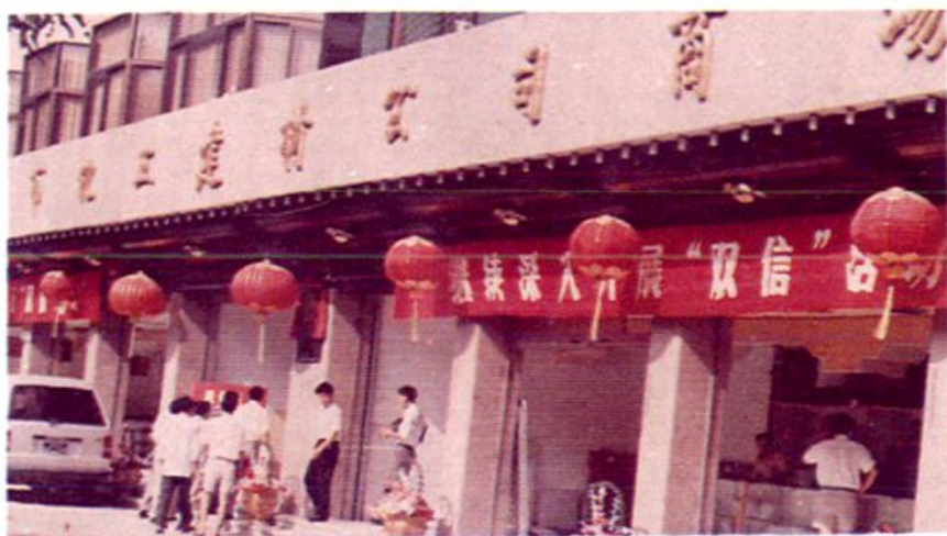
◀ 公司商场。 漳州市化工建材