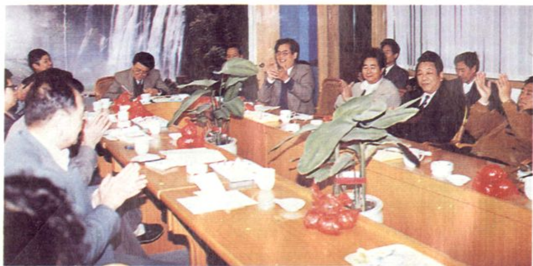
▲漳州市物资经济学会围绕经济建设中心，积极开展物资经济理论研究，探索物资体制改革路子，为物资企业出谋献策。图为该会召开研讨会。