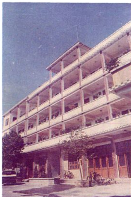
◀ 云霄县物资局办公大楼。