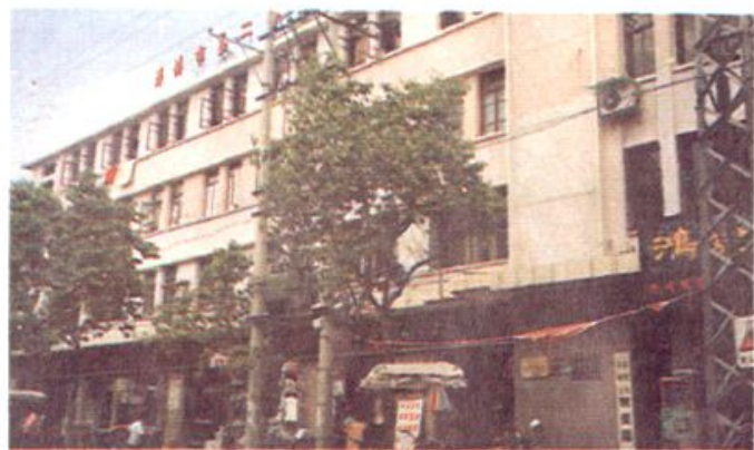
◀ 芗城区物资局 办公营业大楼。