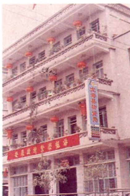
▶ 龙海市物资局 办公大楼。