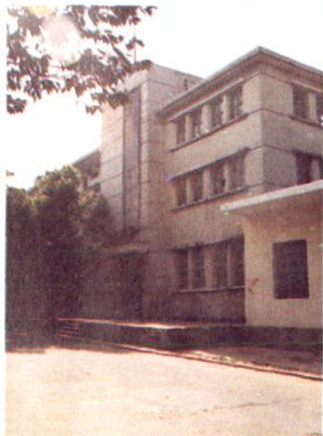
▲ 办公大楼。 东山县物资局