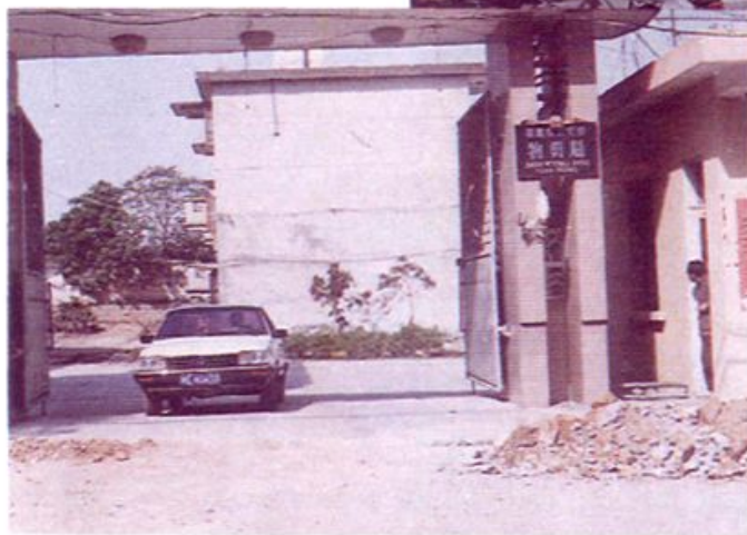
◀ 诏安县物资局 办公、仓库、住宅区。