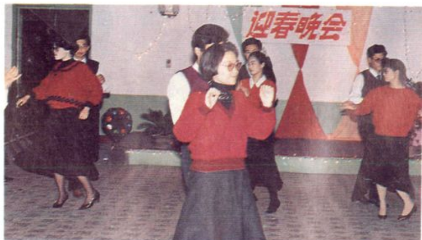
干部职工迎春晚会。 市直物资系统举办。