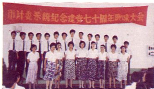
▲ 市直物资系统参加漳州市计委口组织的歌咏比赛。