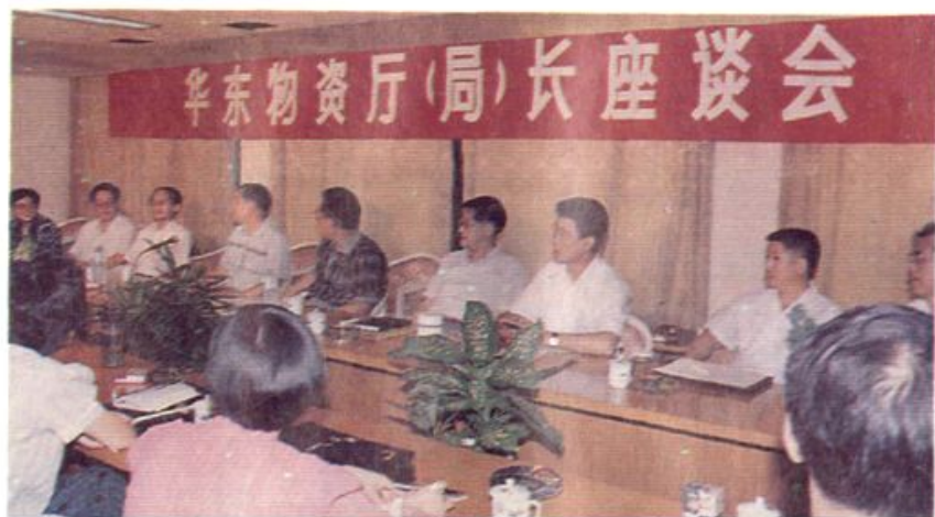
柳随年到会。 馆召开，国家物资部部长 长座谈会，在漳州市芗江宾 华东地区物资厅(局)