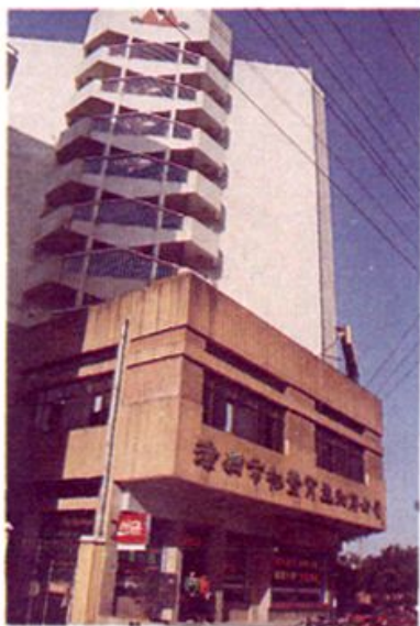
► 漳州市物资再生利用公司办公大楼