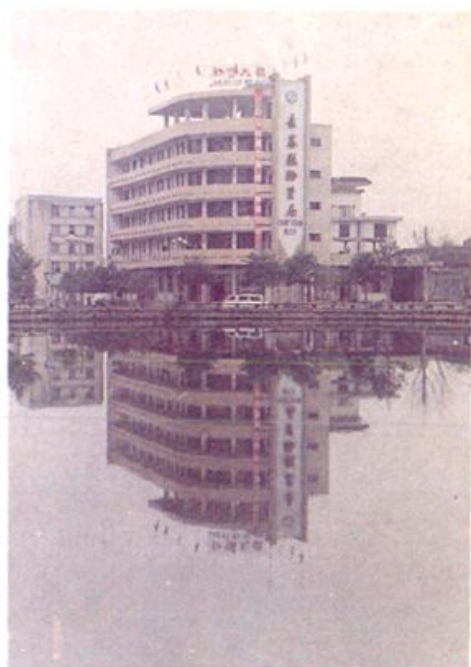
◀ 长泰县物资局办公及营业大楼。