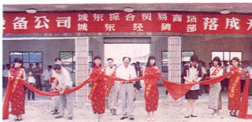
积6600多平方米。 合贸易商场，总面 公司在城东兴建综 漳州市机电设备