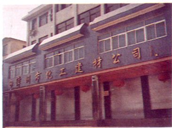
▲漳州市化工建 材公司办公营业大楼。