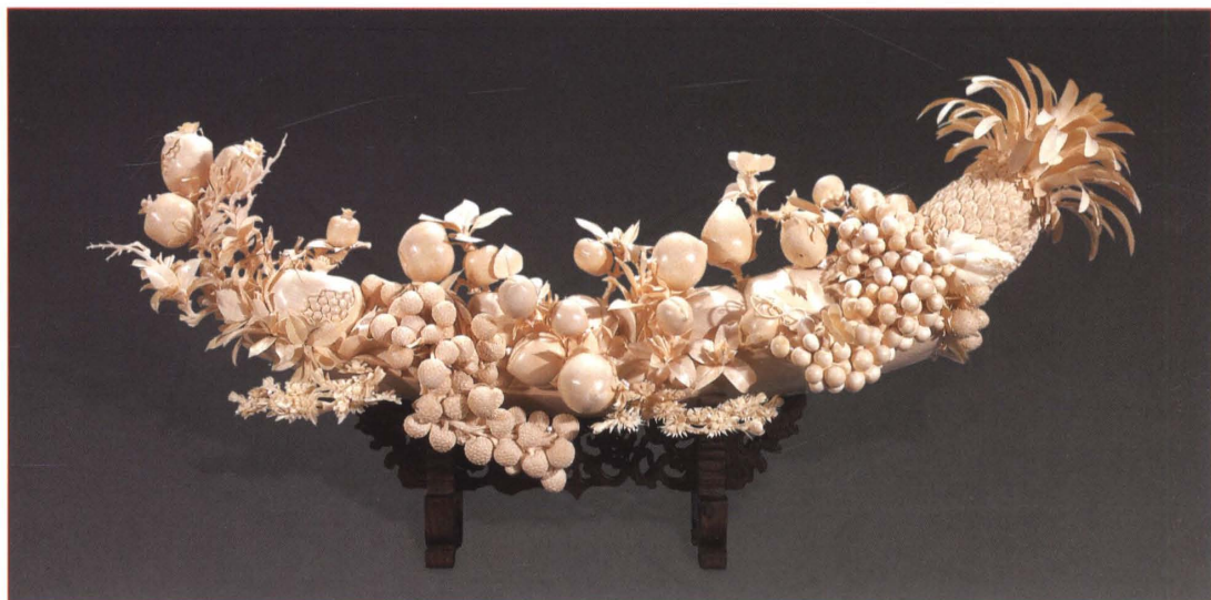
象牙雕百果草虫纹摆件