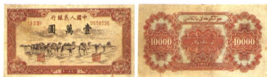
一九五一年壹萬圓駱駝队