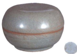
汝窑天青釉刻莲瓣纹盖盒

红太阳拍卖公司在文物拍卖中形成了自己的拍卖特色，当大家在关注漂亮的清三代瓷器时，红太阳拍卖公司迎难而上，另辟蹊径，挖掘古老的高古瓷的内在价值，加以介绍推广，使大家对高古瓷的收藏和投资有了新的认识 and 方向。高古瓷通常指明清以前的瓷器，高古瓷在国际市场颇受追捧，而国内市场较为冷落它。自从红太阳拍卖公司致力于高古瓷的研究、征集、推介、拍卖，高古瓷在红太阳拍出了应有的价格，很多回流国宝还留在了国内。红太阳拍卖公司不仅致力于高古瓷的拍卖，还致力于宋、元、明、清古字画的回流和拍卖，此外还有邮币卡及家具的推广与拍卖。