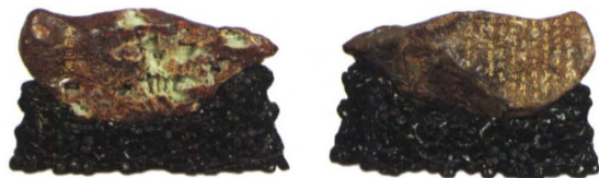
黄玉虎溪三笑山子