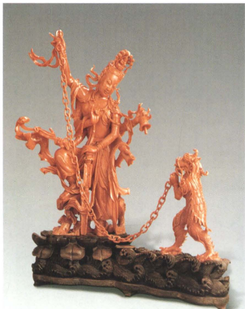
《珊瑚六臂佛锁蛟龙》 潘秉衡