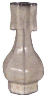
官窑粉青釉六棱双耳瓶