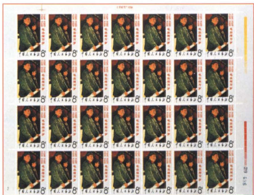
文2毛主席万岁毛主席和林彪整版