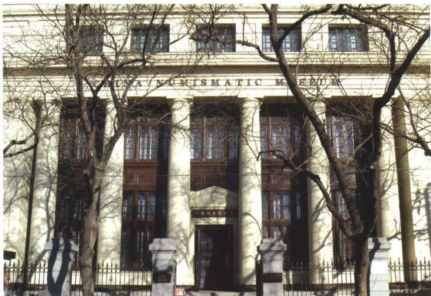
中国钱币博物馆外景

中国钱币博物馆成立以来,除以中国历史货币为主要内容的基本陈列外,还举办了“反假人民币展”、“建国五十周年人