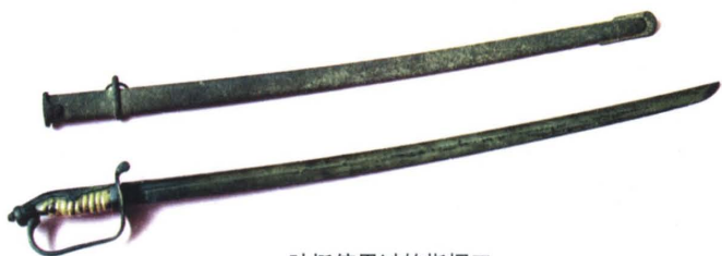
叶挺使用过的指挥刀

物馆收藏中国古代和近现代军事历史文物14万余件,历史图片10万余张。在这些藏品中有西周时期“薛师”戟、东汉时期匈奴铁剑、元代至正年间的火铳、北洋水师镇远舰铁锚、朱德手枪、中华苏维埃共和国中央革命军事委员会钢印、红军带到陕北的唯一一门山炮、抗美援朝时期王海驾驶的九星战机,以及毛泽东、周恩来、朱德等老一辈无产阶级革命家在各个历史时期用过的手枪、望远镜、公文包、亲笔起草的作战命令、为革命牺牲的烈士遗物等大量珍贵文物。军事博物馆藏品丰富,陈列艺术形式多姿多彩,气势宏大而又有民族风格,是一部直观形象的中国军事史画卷,是了解军事历史特别是了解中国人民解放军历史的重要窗口。