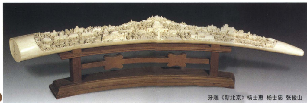
牙雕《新北京》杨士惠 杨士忠 张俊山