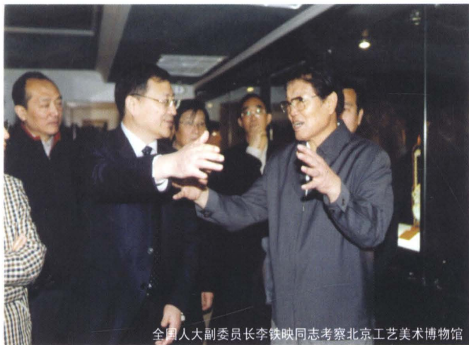
全国人大副委员长李铁映同志考察北京工艺美术博物馆