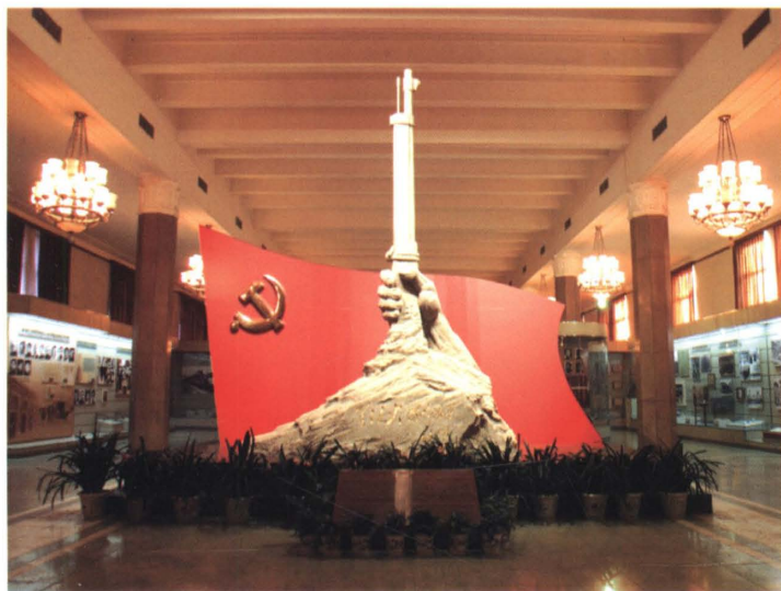
土地革命战争馆序厅

物馆收藏中国古代和近现代军事历史文物14万余件,历史图片10万余张。在这些藏品中有西周时期“薛师”戟、东汉时期匈奴铁剑、元代至正年间的火铳、北洋水师镇远舰铁锚、朱德手枪、中华苏维埃共和国中央革命军事委员会钢印、红军带到陕北的唯一一门山炮、抗美援朝时期王海驾驶的九星战机,以及毛泽东、周恩来、朱德等老一辈无产阶级革命家在各个历史时期用过的手枪、望远镜、公文包、亲笔起草的作战命令、为革命牺牲的烈士遗物等大量珍贵文物。军事博物馆藏品丰富,陈列艺术形式多姿多彩,气势宏大而又有民族风格,是一部直观形象的中国军事史画卷,是了解军事历史特别是了解中国人民解放军历史的重要窗口。