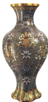
景泰蓝《墨地八宝海棠瓶》清代