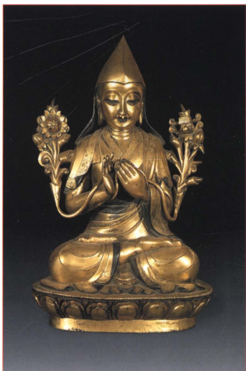
铜鎏金宗喀巴大师像