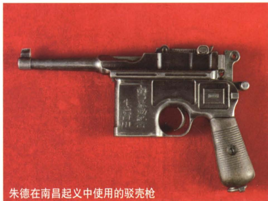
朱德在南昌起义中使用的驳壳枪