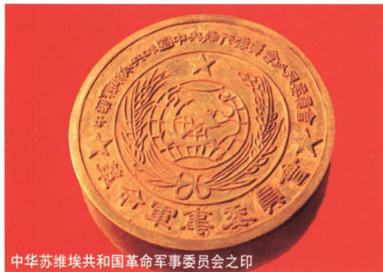
中华苏维埃共和国革命军事委员会之印