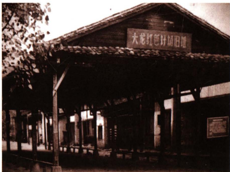
红军开办的红色圩场旧址——大龙红色圩场