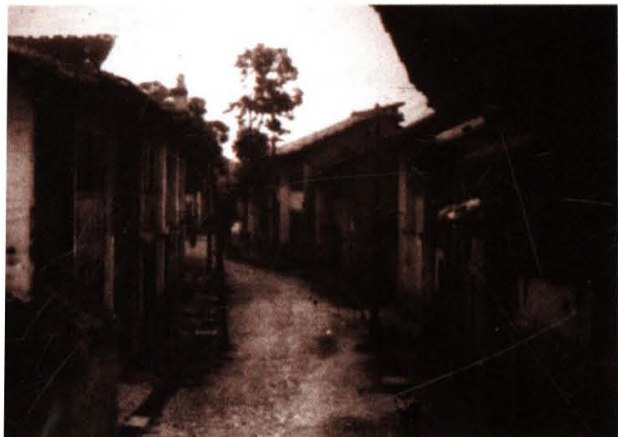
红军开办的红色圩场旧址——草林圩场