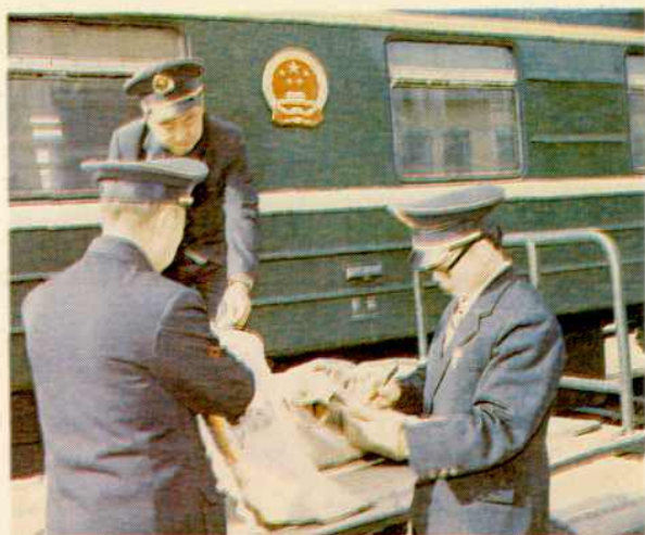
中、苏两国邮政人员 在国际列车前互换邮件