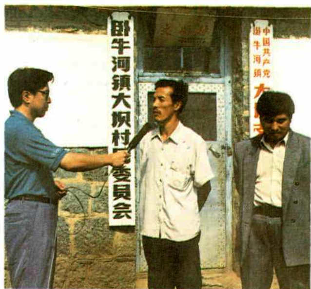
记者采访呼盟第一个电话村——扎兰屯市 卧牛河镇大坝村村长