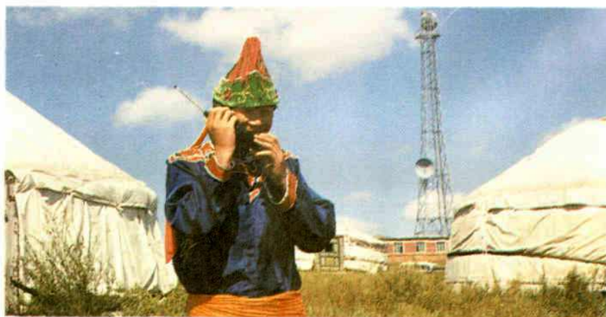
牧民使用 移动电话