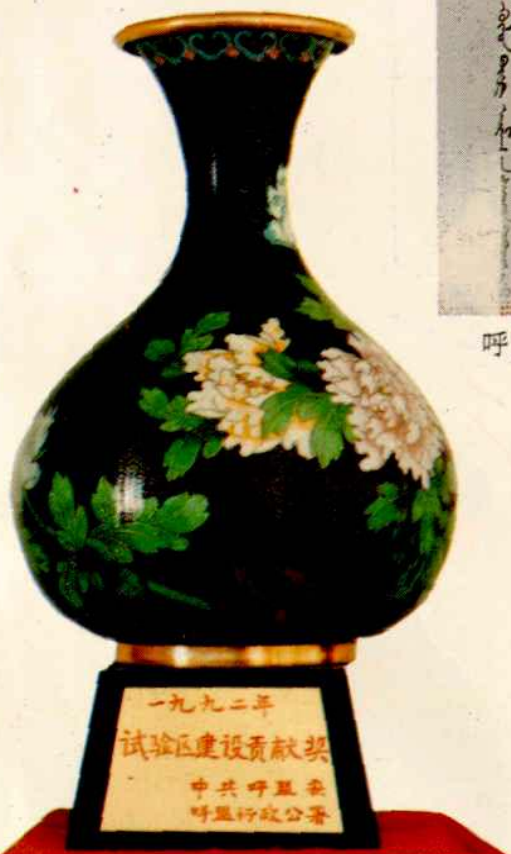
试验区建设贡献奖