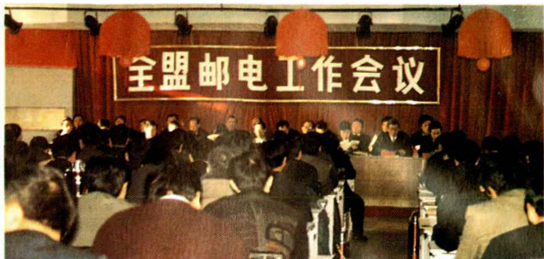
呼盟邮电工作会议