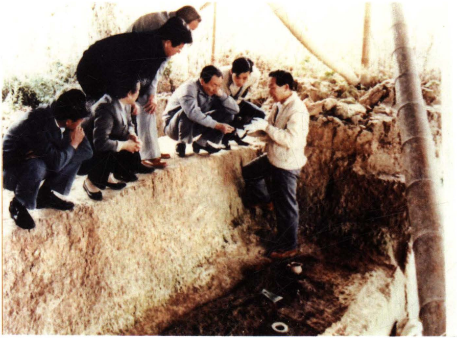
1988年10月13日，上海市市长朱镕基（右三）率领市委领导杨堤、吴邦国、曾庆红等一行，视察福泉山古文化遗址。图为他们正在一座良渚文化大墓坑旁，实地查看该墓出土文物时的情景。