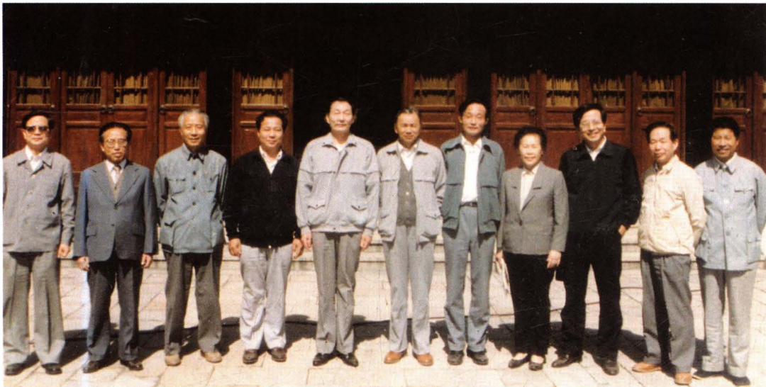
时任上海市市长的朱镕基（左五）和有关领导吴邦国（右五）、曾庆红（右三）、杨堤（右六）参观福泉山古文化遗址发掘现场后，在青浦博物馆前留影