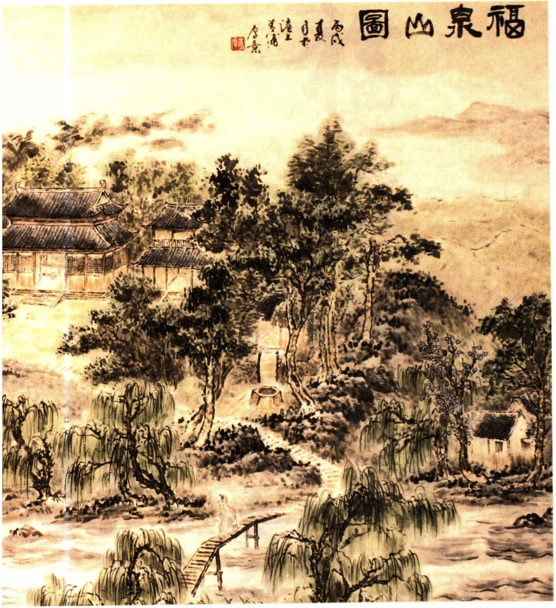
国画《福泉山图》（陈厚意 绘）