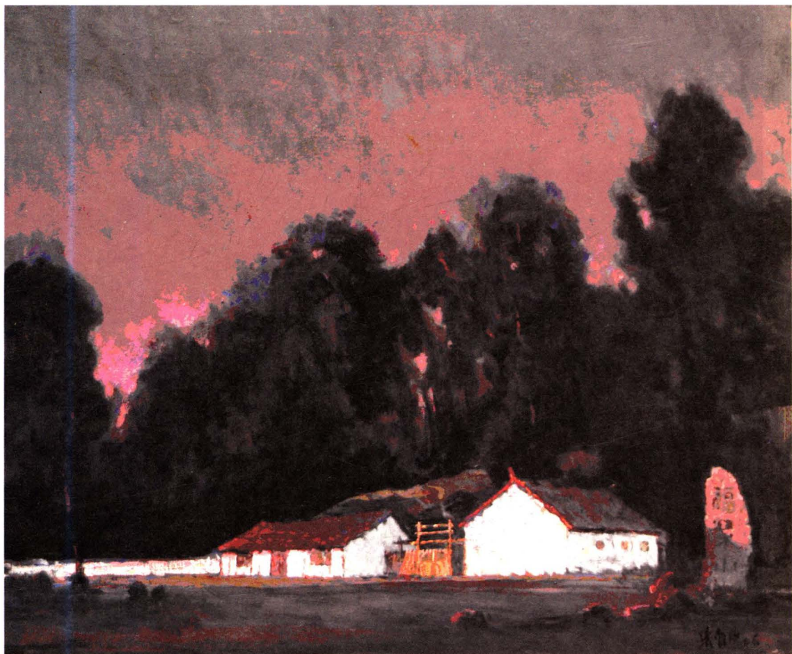
油画《福泉山》（张自申 中国著名油画家）