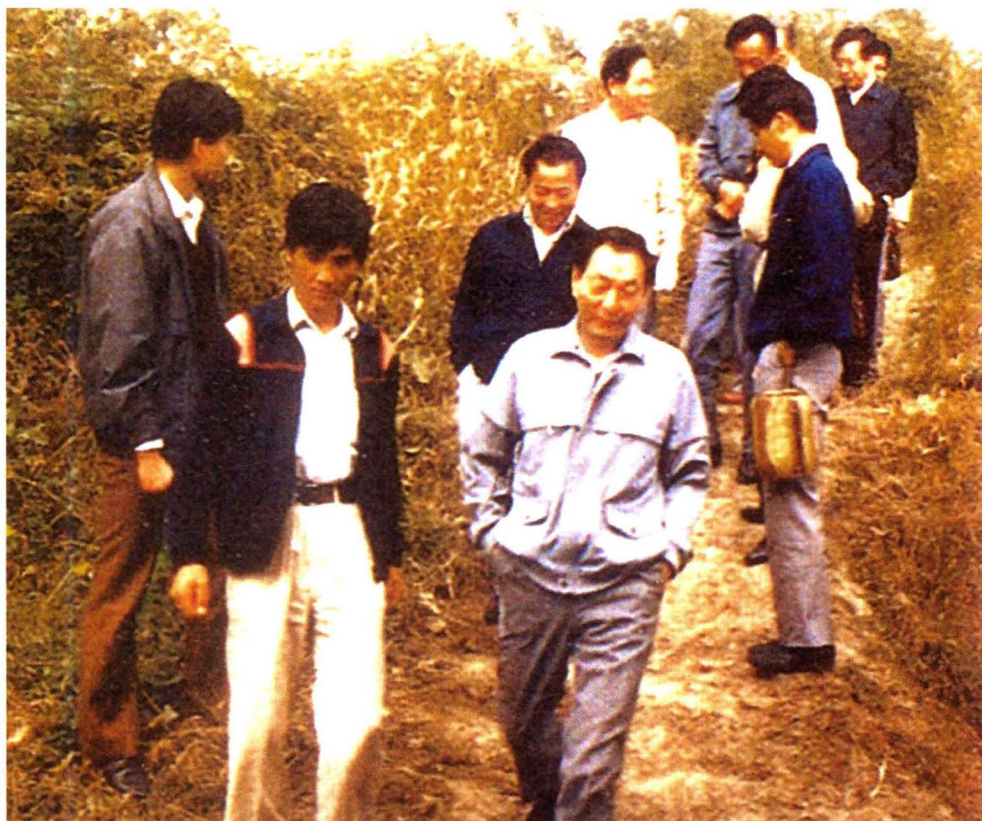
1988年10月13日，时任上海市市长的朱镕基和相关领导视察福泉山古文化遗址