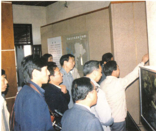
时任上海市市长的朱镕基和相关领导在青浦博物馆参观福泉山古文化遗址出土的文物