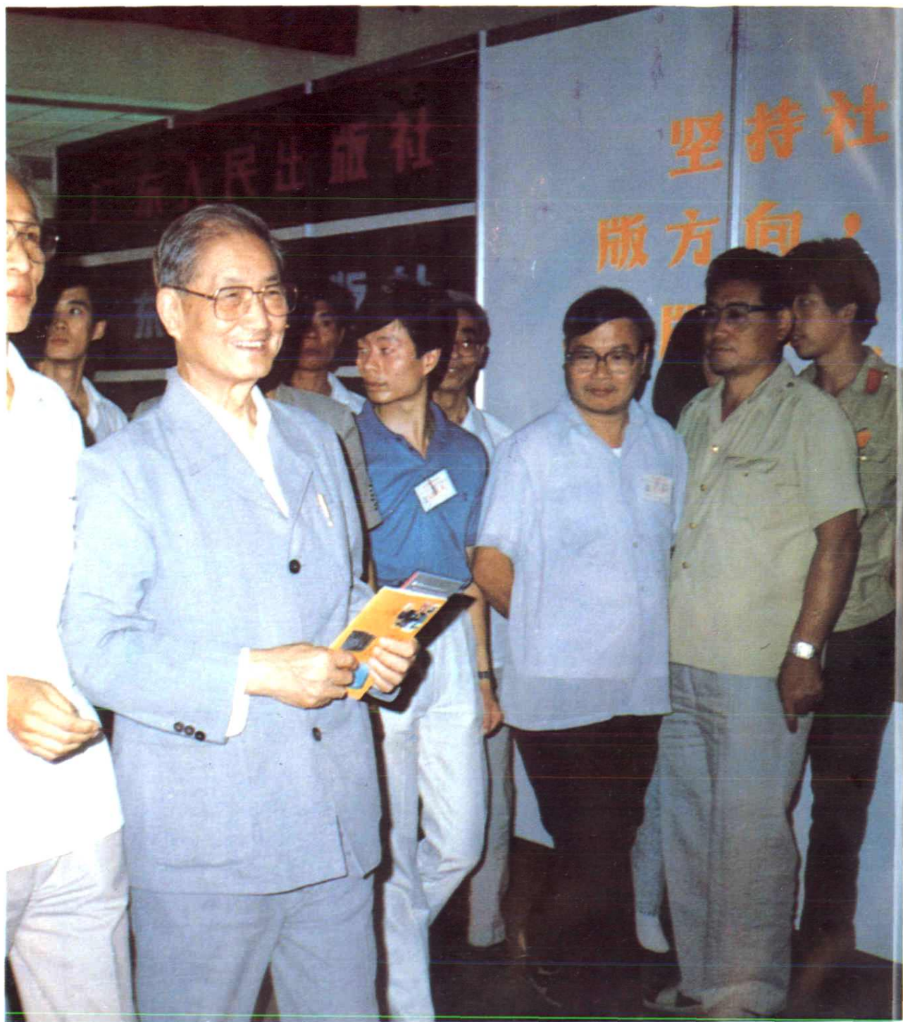
1989年8月25日，第二届全国图书展览会上，中共中央政治局常委宋平参观甘肃图书展馆