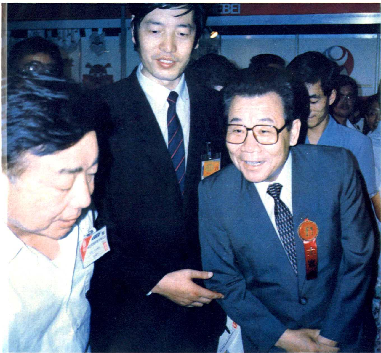
1990年9月1日，北京第二届国际图书展览会上，中共中央政治局常委李瑞环参观甘肃图书展台