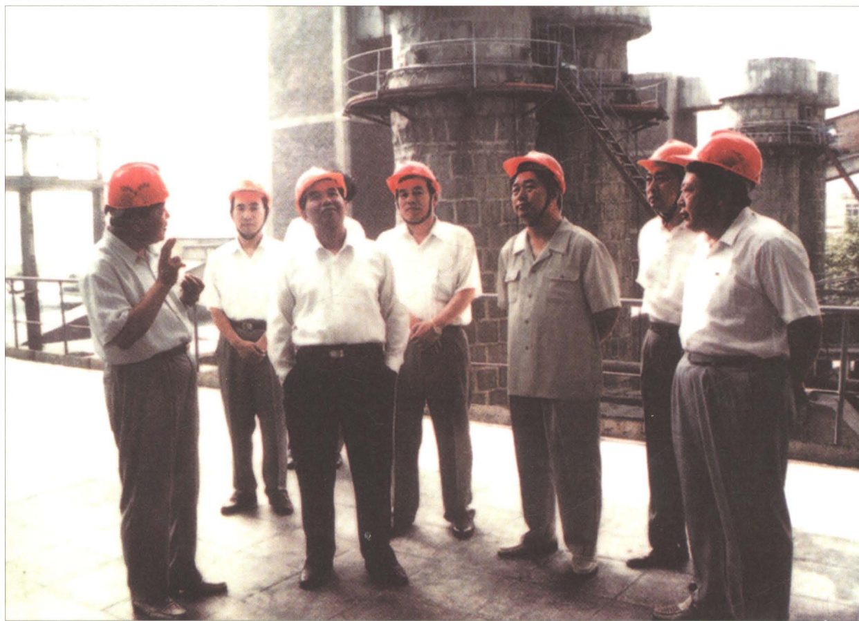
■ 原中共中央政治局委员、省委书记吴官正（左三）视察章丘电力。