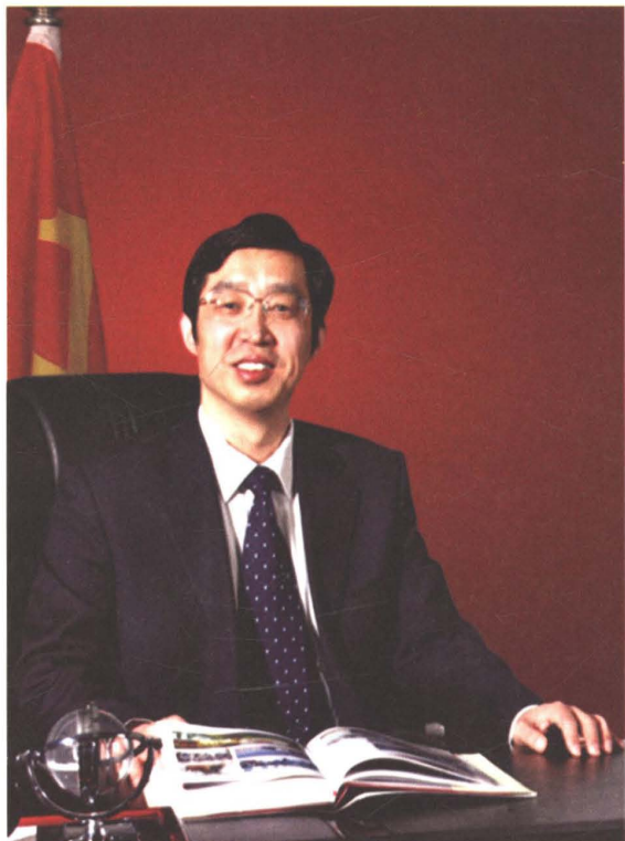
章丘市供电公司经理: