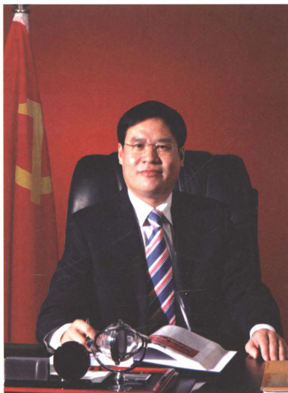
章丘市供电公司党委书记：