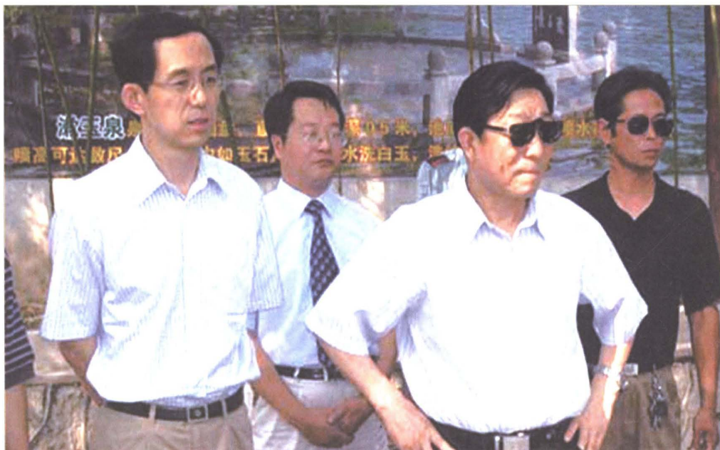
■ 原国家电监会主席柴淞岳（右二）、原山东电力集团公司总经理谢明亮（左一）来章丘市供电公司视察指导工作。