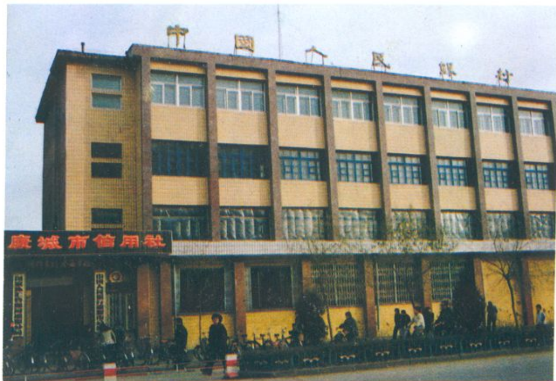
中国工商银行辽源市支行