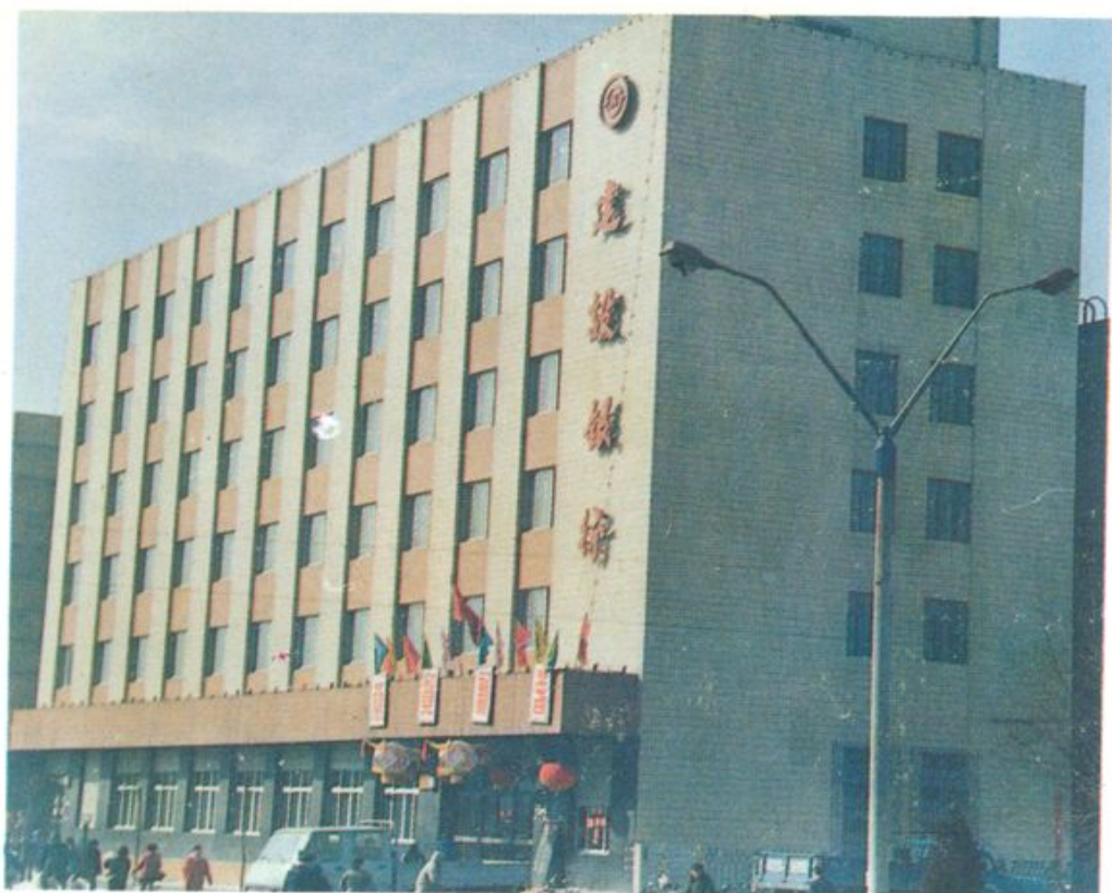
中国农业 银行辽源市中心支行