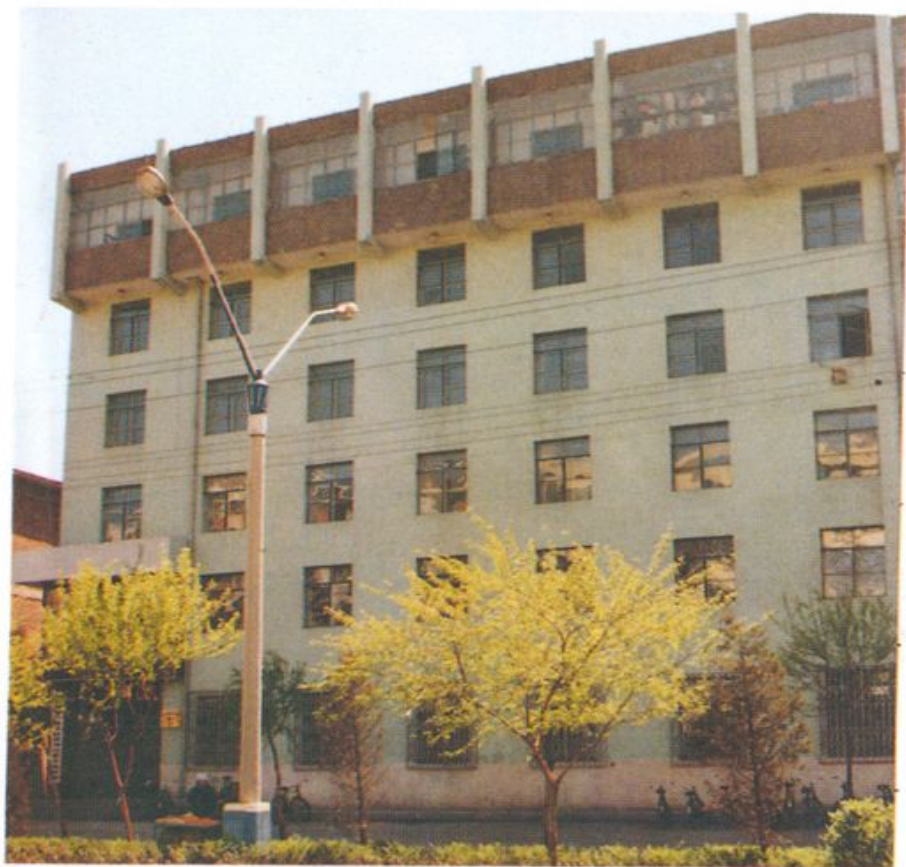
中国人民保险公司辽源市支公司