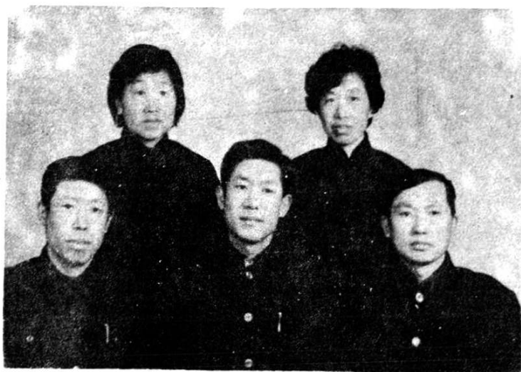
泰来县医药志编纂委员会成员合影