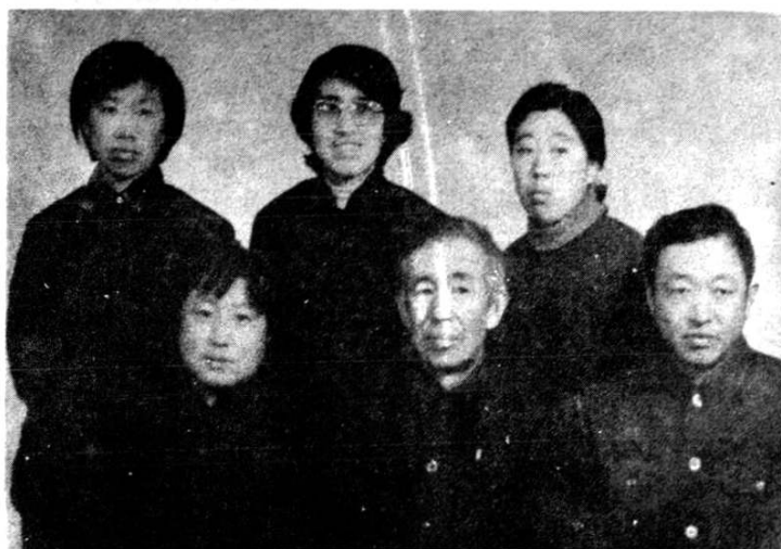
泰来县医药志编辑和编务合影