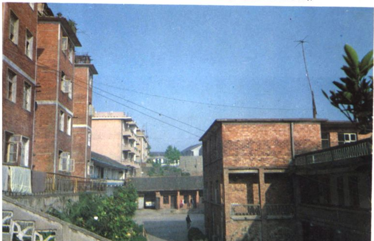
▼ 石门县卫生防疫站