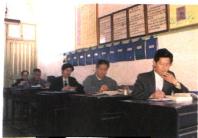
▲ 编辑人员专心撰稿