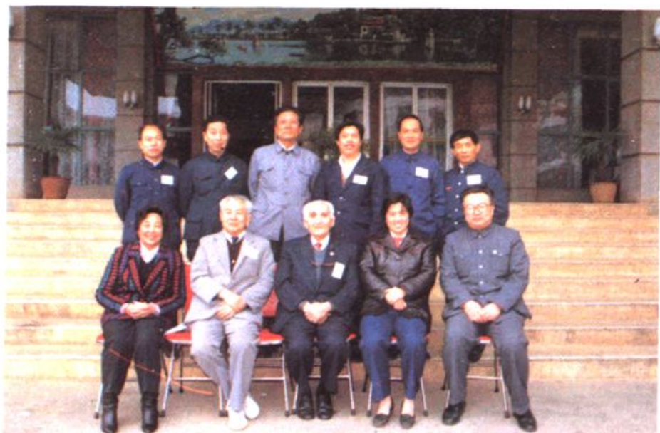
◀ 全国第三防治麻风病工作及表彰会期，卫生部副部长何界生（前排右二），著名麻风病学专家马海德（前排中）与石门代表赵庆远（后排右二）等合影