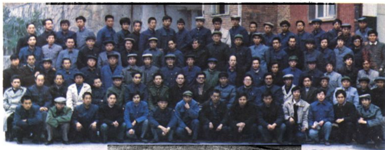
▲石门县卫生防疫工作会(1989·12)