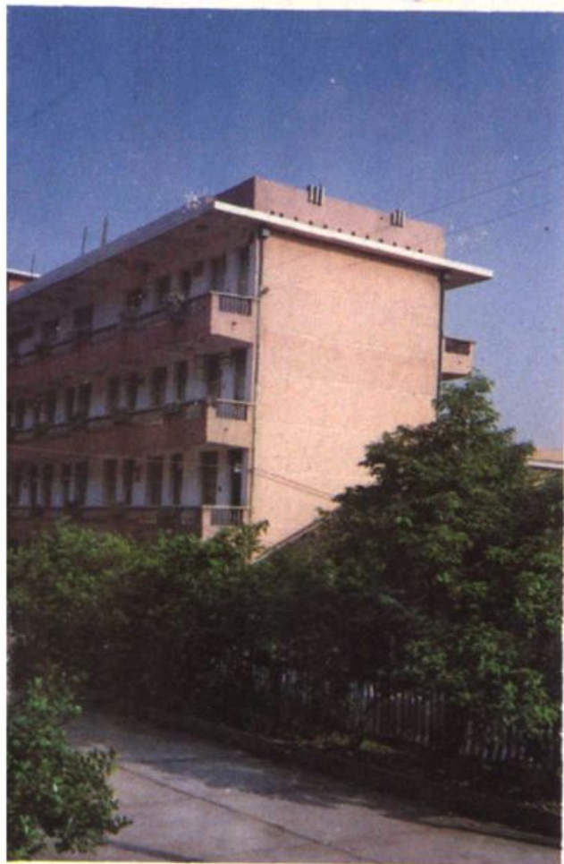
◀ 石门县卫生局办公楼