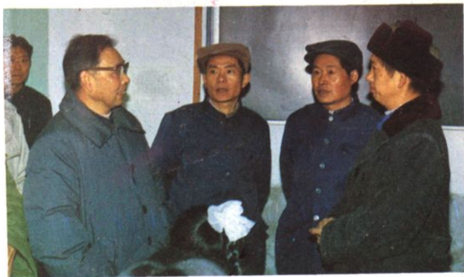
◀原卫生厅厅长游沛（前左一）在县中医职校。