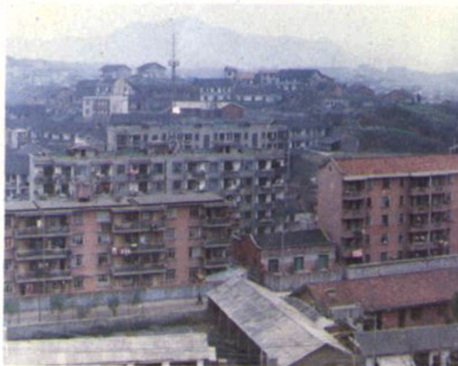
▲ 石门县人民医院一角