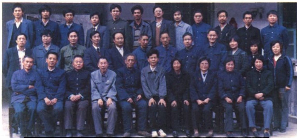
▲卫生局机关干部职工欢送离退休干部 (1989·9)