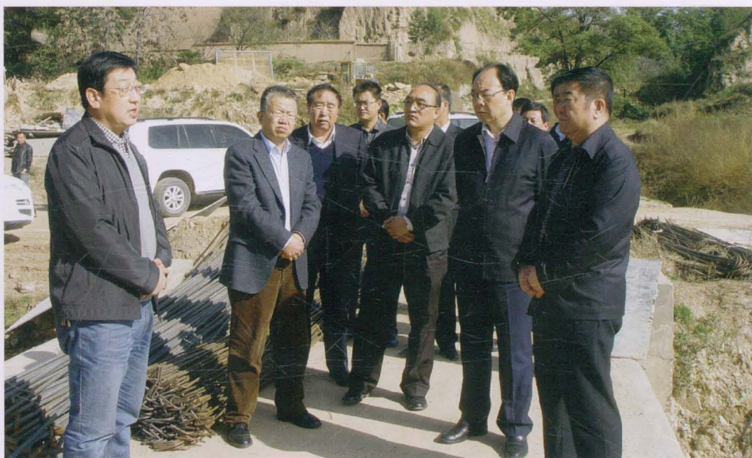
2013年10月，省政协副主席、党组副书记刘立军（右二）在市政协主席张文礼（右一）、县委书记周伟（左二）、县政协主席黄清文（左三）陪同下，深入开边镇调研双联扶贫工作