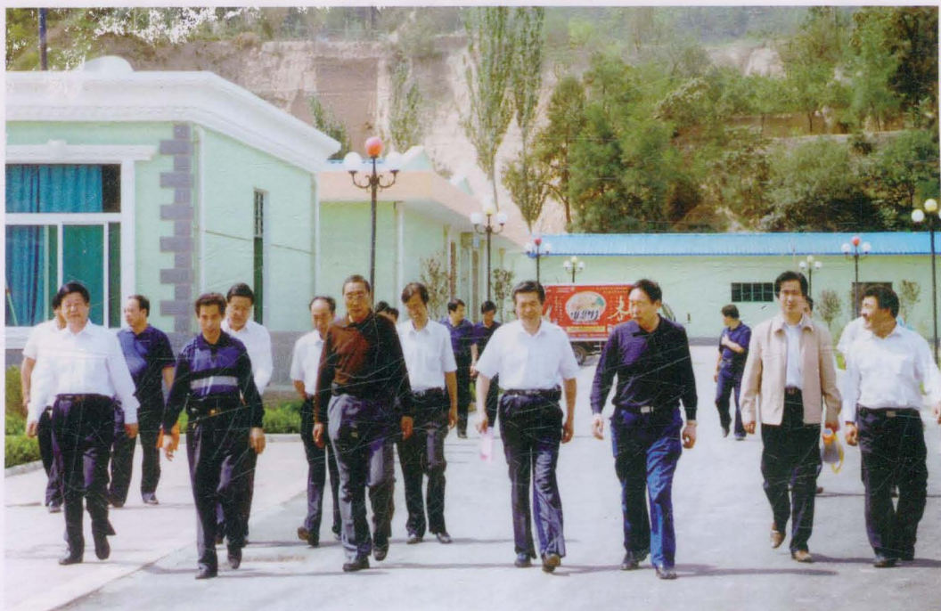
2007年9月，省政协副主席德哇仓（前排左三）在市政协副主席黄国锋（前排右四）、县委书记王小庆（前排左一）、县政协主席黄清文（前排右三）陪同下，视察镇原县金龙工业园区建设