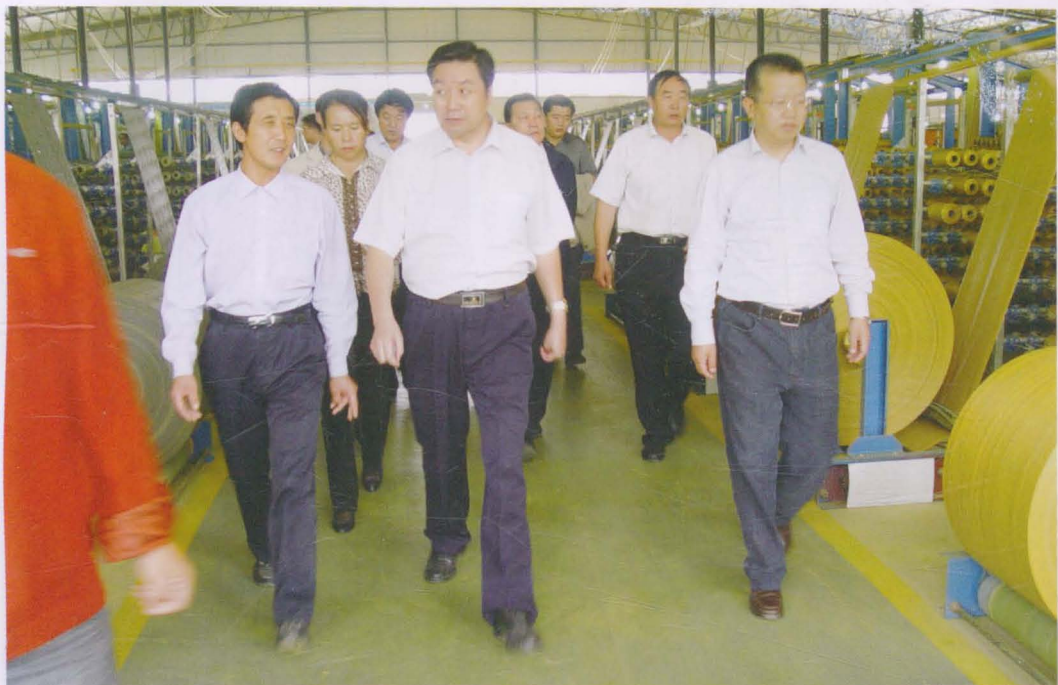
2010年9月，省政协副主席张津梁（前排中）在县委书记周伟（前排右）、县政协主席黄清文（二排右）、县委常委、副县长文芳（二排左）陪同下，调研镇原县非公企业党建工作