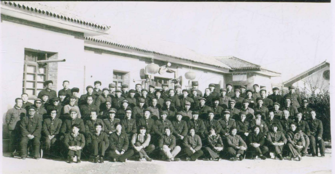
1986年12月，政协镇原县二届一次会议召开。图为全体委员合影