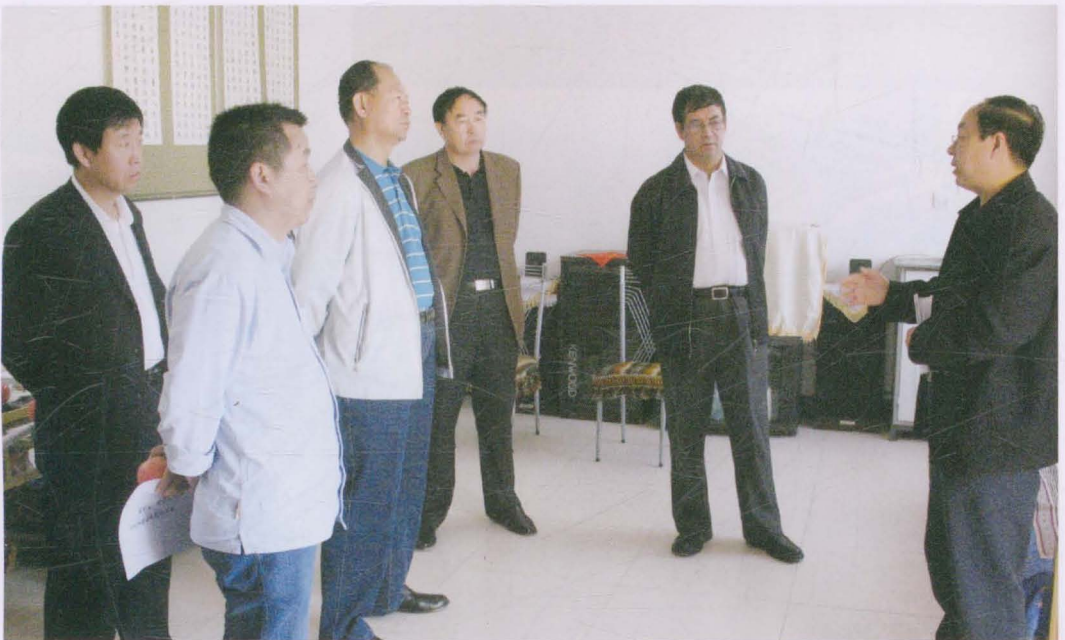
2008年，省政协城市发展带动战略调研组来镇原调研