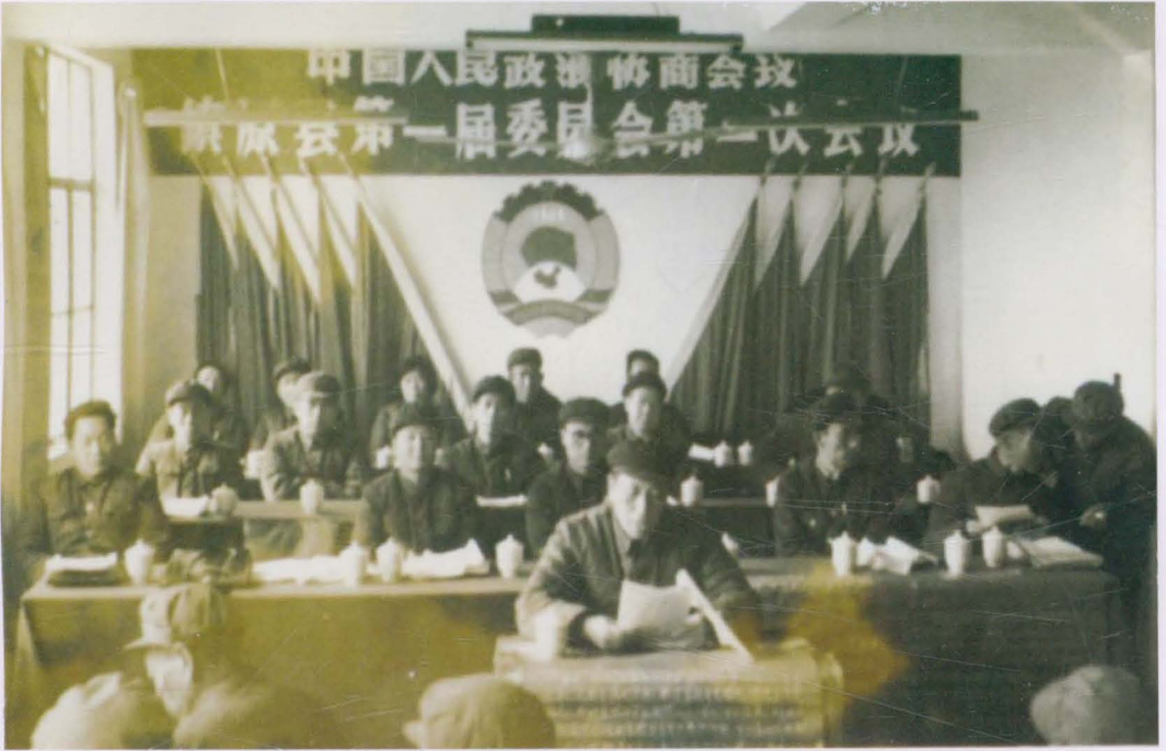
1984年1月，中国人民政治协会议镇原县第一届委员会第一次会议召开，标志着镇原县政协正式成立