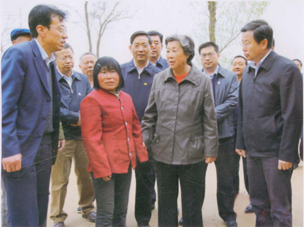
2012年4月，全国政协副主席、民建中央第一副主席张榕明（右四）在省委常委、副省长李建华（右一）、省政协副主席张景辉（右五）、市长周强（右六）、市政协副主席朱治晖（右二）、县委书记周伟（左二）、县长李崇暄（右三）陪同下，深入方山乡调研六盘山东部片区扶贫开发工作