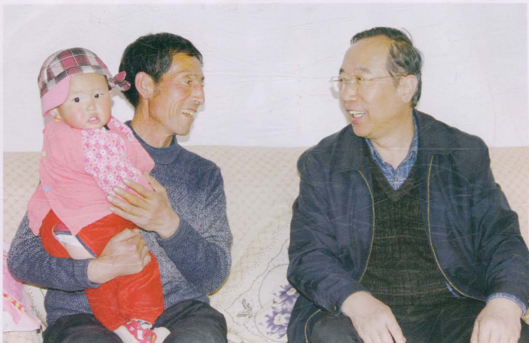
2012年4月，省政协副主席栗震亚（右）在双联点开边镇陈坪村深入农家了解情况