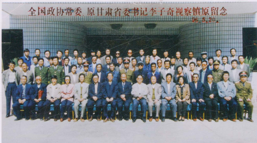
1996年5月，全国政协常委、原省委书记李子奇（前排右八）来镇原视察工作，与全县党政领导干部合影