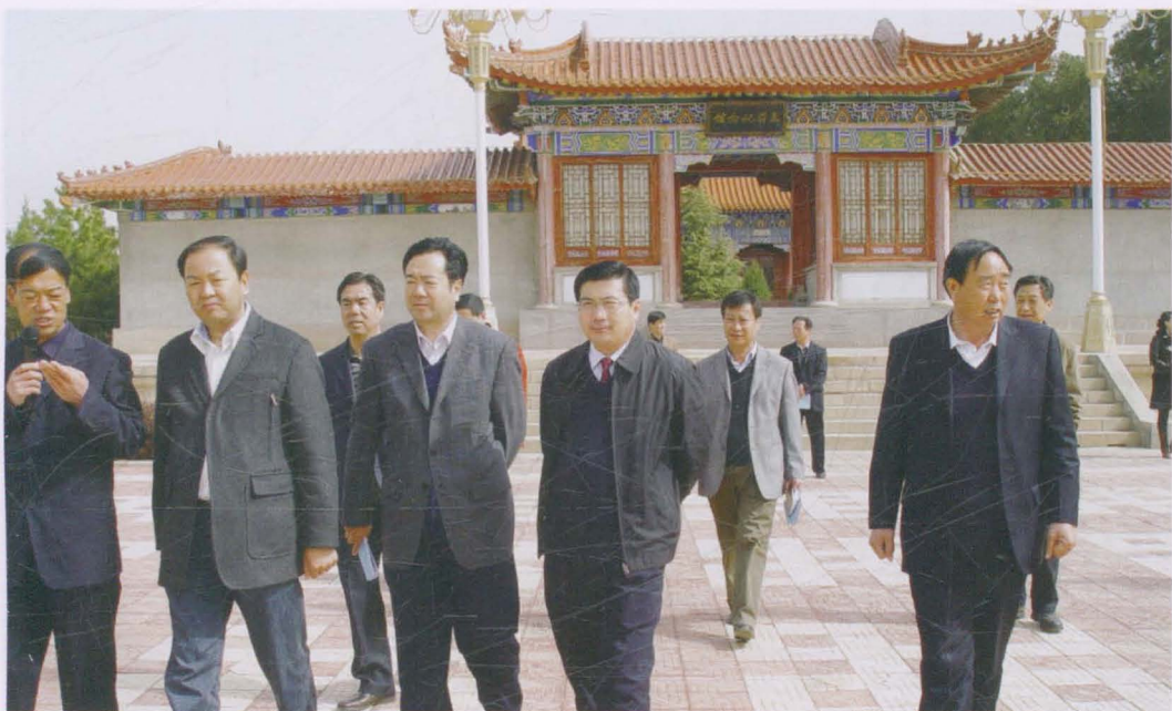
2010年4月，省政协副主席张世珍（前排左二）在市政协主席张文先（前排左三）、县长李崇暄（前排右二）、县政协主席黄清文（前排右一）陪同下，调研镇原县文化旅游产业