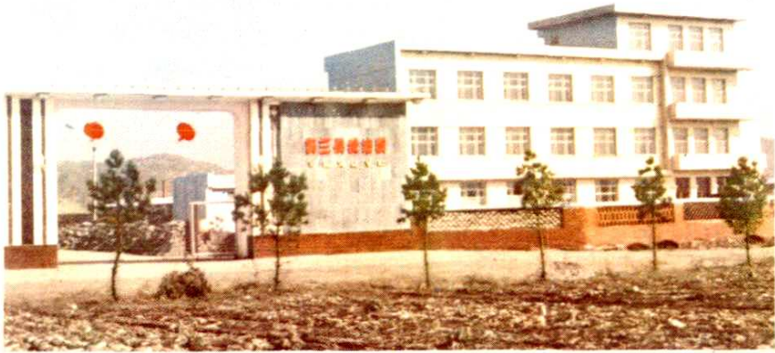
一九八八年建成并投产的依兰县浸油厂（此照系该厂的西大门和办公楼）