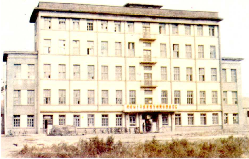
依兰县制粉厂制粉车间