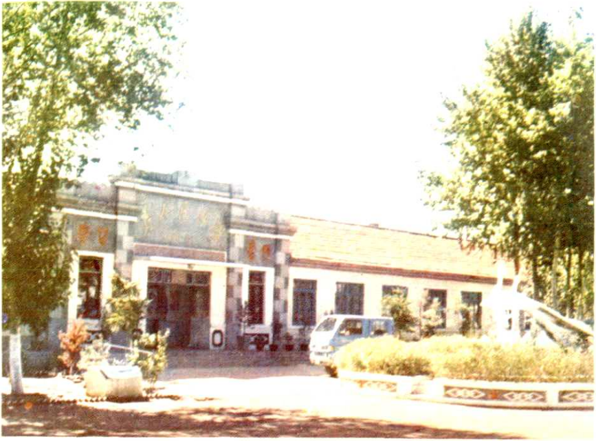
依兰县三道岗粮库办公室（省级文明单位）