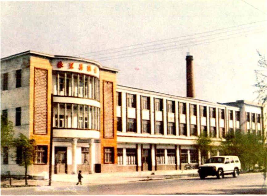
依兰县粮食局办公楼