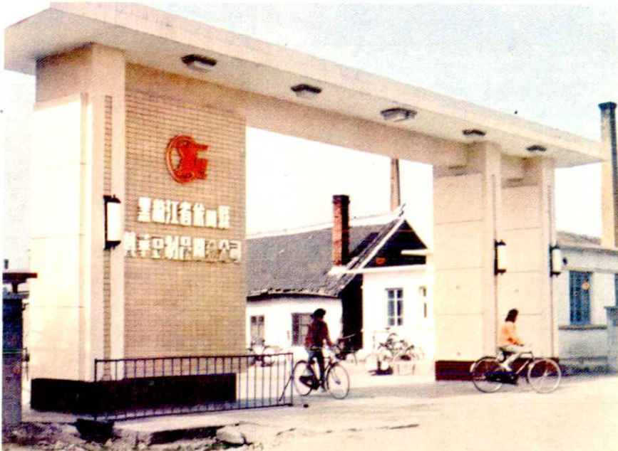
黑龙江省依兰县兴华豆制品开发公司（设在制米厂院内）