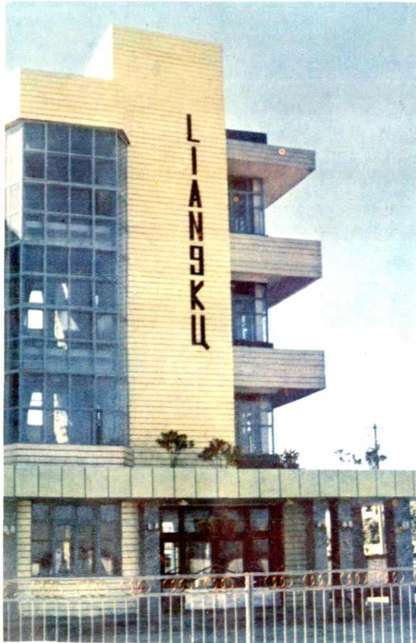
依兰县太平粮库办公楼（市级文明单位）