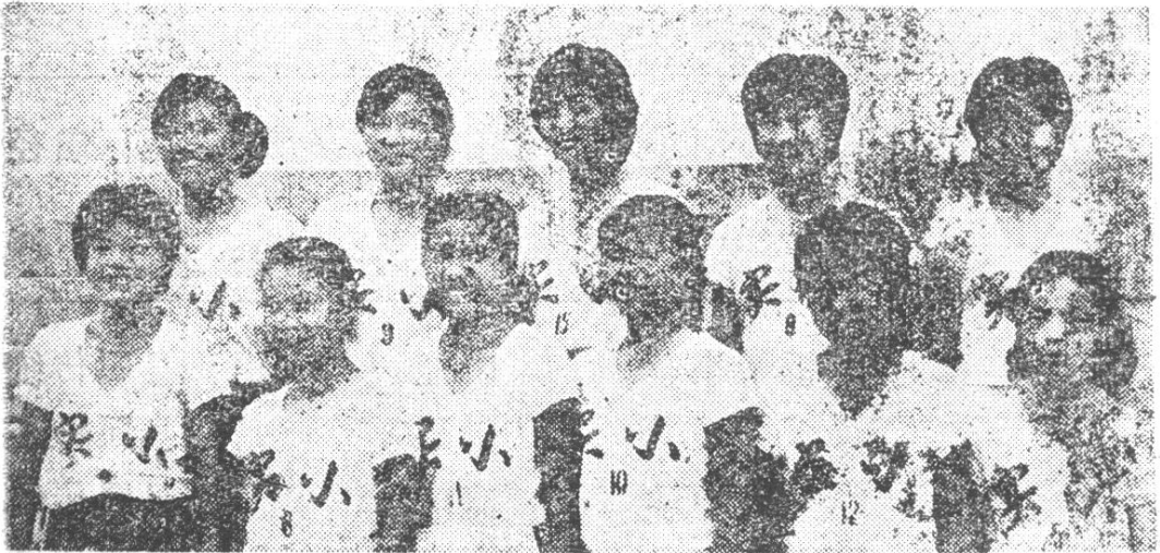
参加安徽省“萌芽杯”篮球赛的凤阳女队合影

党的十一届三中全会之后，全县学校体育开创了新的局面。各校纷纷建立体育代表队，与县体校衔接，形成一条龙的训练网，常年坚持训练，运动技术水平有显著提高，在滁县地区举办的中学生篮球赛中连续获得男、女冠军，1986年已成为全地区“三好杯”篮球赛的“三连冠”。中、小学生篮球代表队多次代表滁县地区参加省级比赛，分别获得过全省第二名和第三名的好成绩。县小学生男、女篮球队代表地区参加省“萌芽杯”比赛，1984年女队获得阜阳赛区第一名，男队获凤阳赛区第二名。