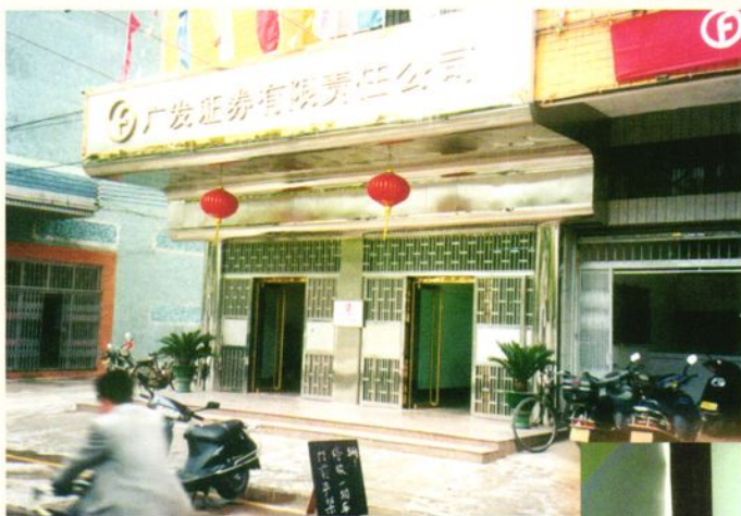
台山營業部辦公樓