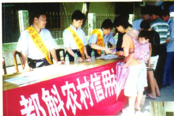
农信社员工开展人民币反假宣传活动