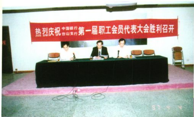
中行召开第一届职代会