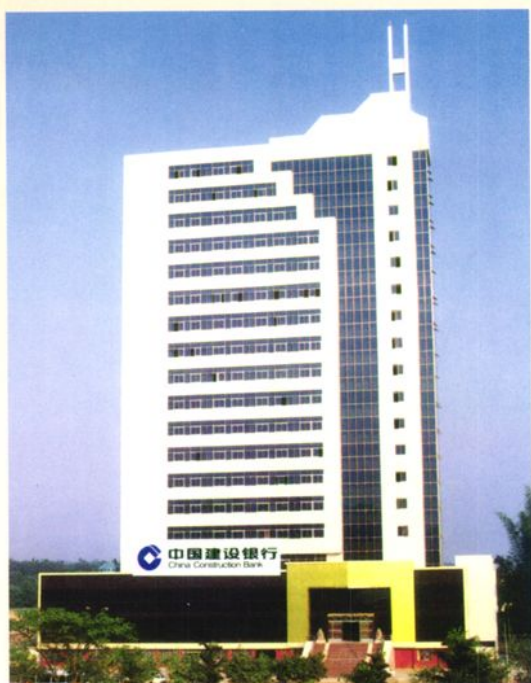
台山市支行办公楼