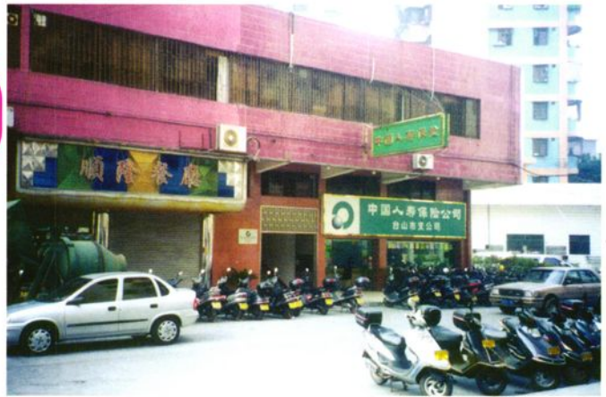
寿保台山市支公司办公楼