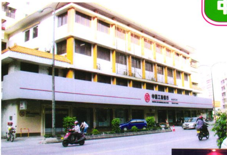
台山市支行办公楼（环北大道48号）