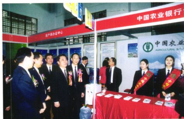
开展业务宣传活动