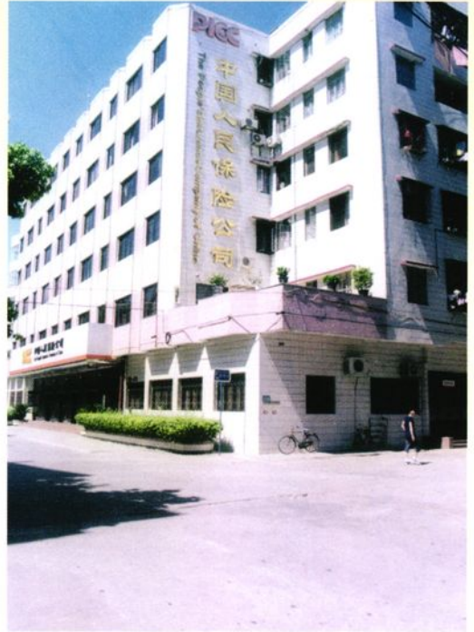
人保公司台山市支公司办公楼