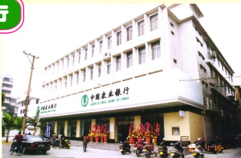
中国农业银行台山市支行办公楼