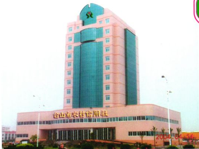
新落成的市联社大楼外貌