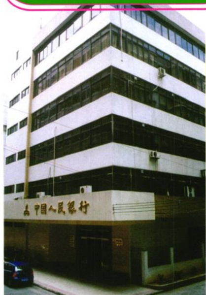
人行台山市支行办公楼 行址：桥湖路94号