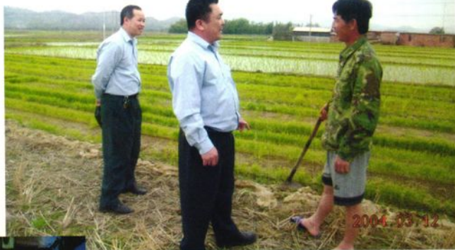
农信社员工深入田间了解生产情况