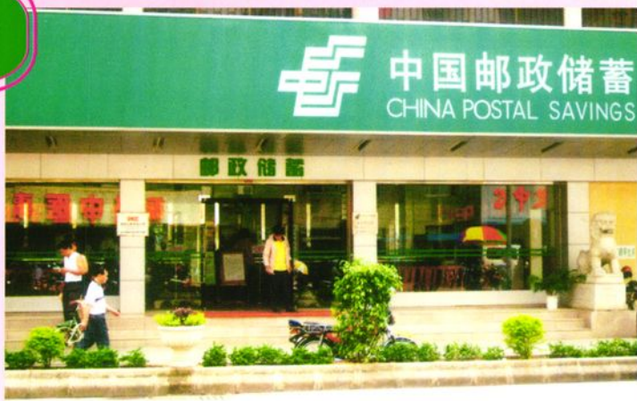
台山邮储办公楼（环北大道44号）