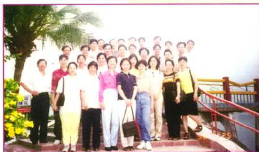
九八年四月十一日，人行职工到东方红水庆度假。