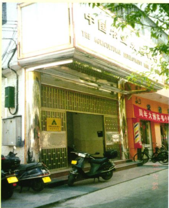
▶ 农发行台山市支行办公楼（富城大道81号二楼）