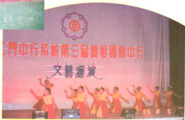
中行员工参加文艺汇演