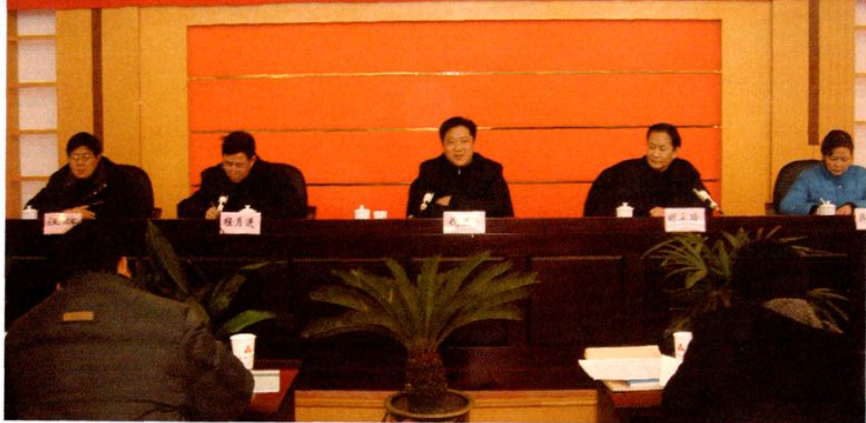
▲ 市委常委、常务副市长倪玉平在全市价格义务监督员培训会上讲话