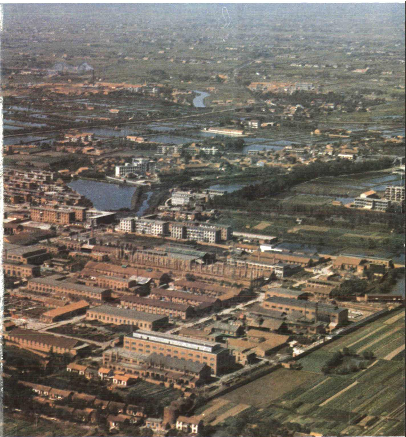
第四石油机械厂全貌