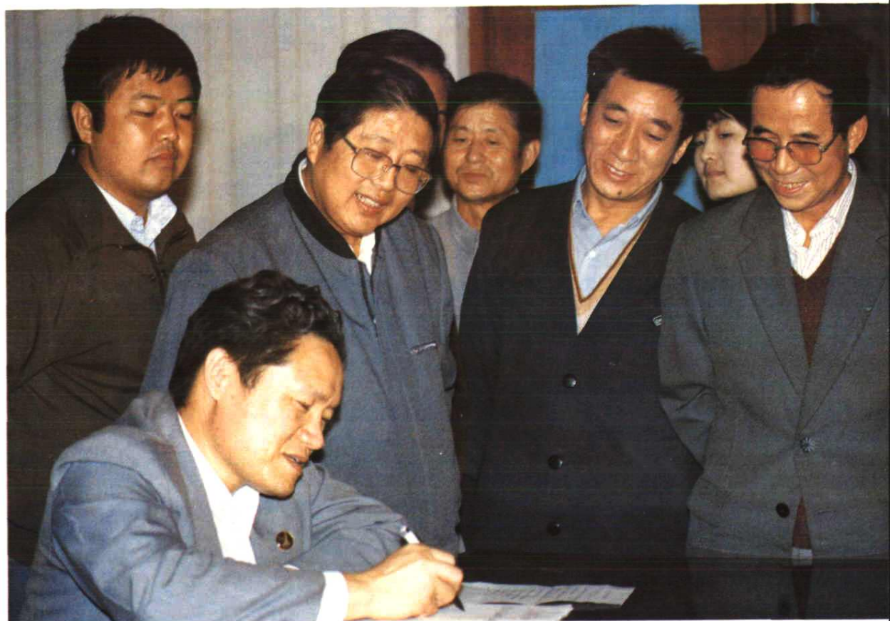
中国石油天然气总公司副总经理周永康（前左1）为厂庆50周年题词