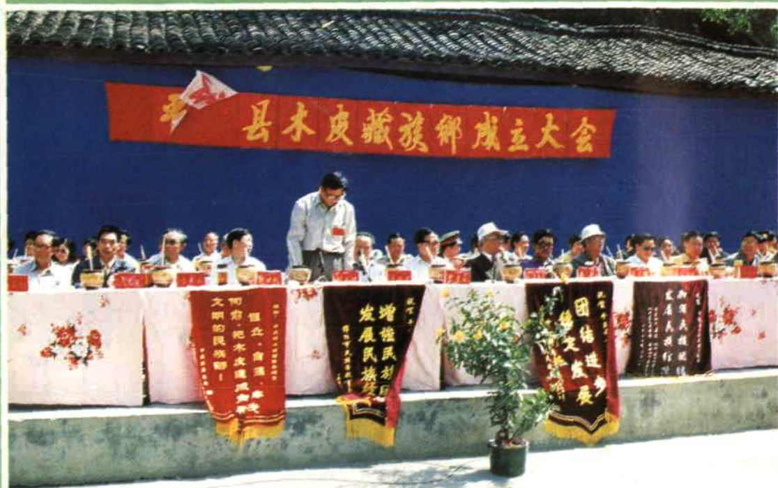
▲ 1994年平武县木皮藏族乡隆重召开成立大会