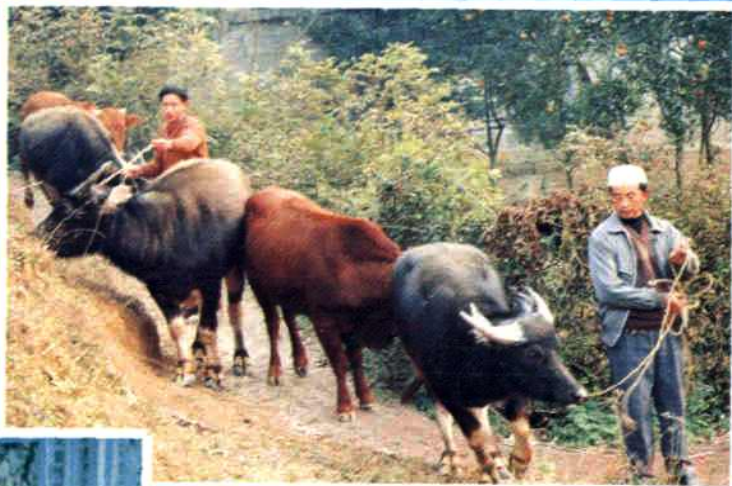
▼ 安县回族同胞发展瘦牛育肥