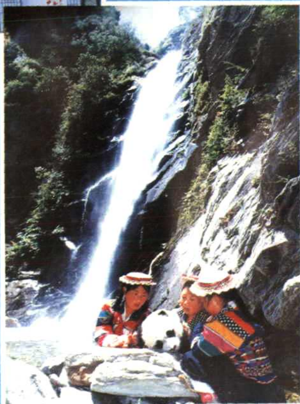
► 平武县白马藏族学生抢救大熊猫