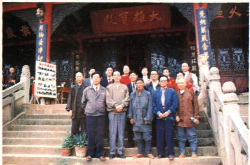
◀ 1995年10月8日向正副市长陪同国务院宗教局副局长赤耐〔左2〕检查圣水寺贯彻执行宗教法规情况