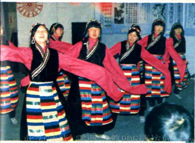
◀ 平武县虎牙藏族乡歌舞