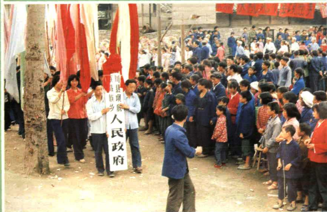
▲ 1985年群众游行庆祝北川县岷羌民族乡成立