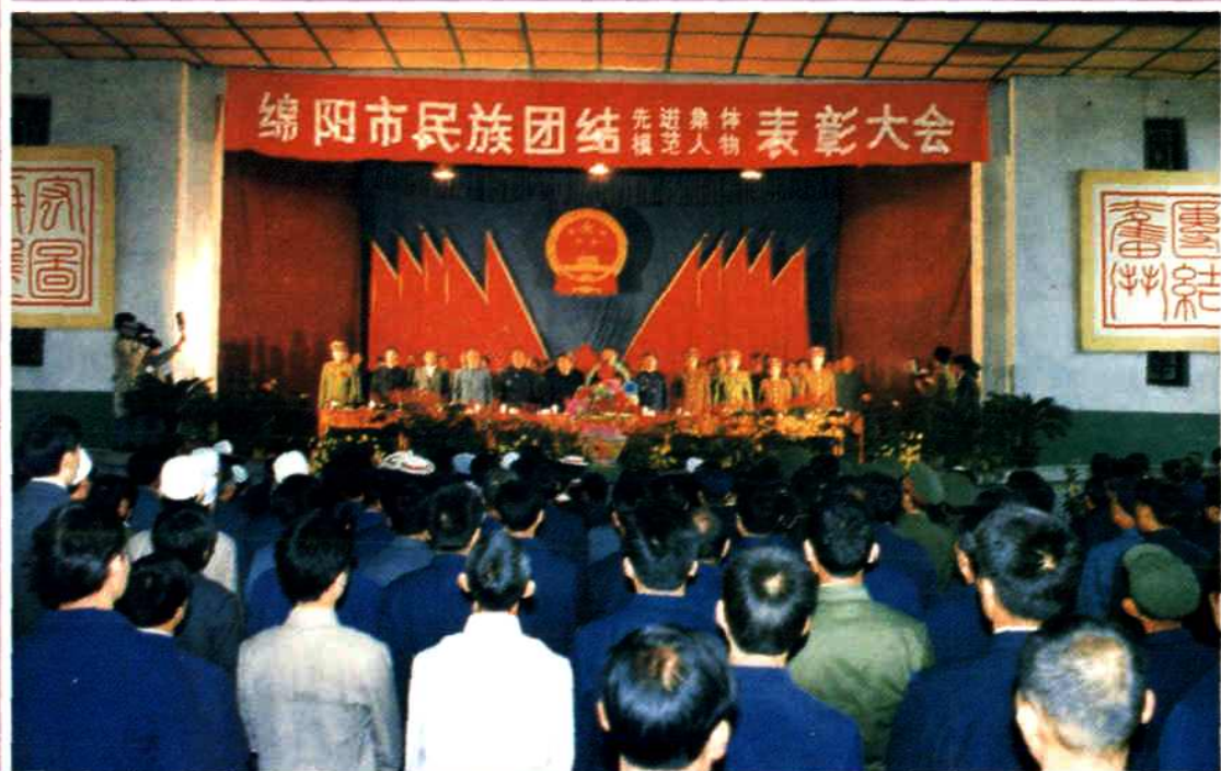
▲ 1986年绵阳市首次民族团结进步先进集体、模范人物表彰大会盛况