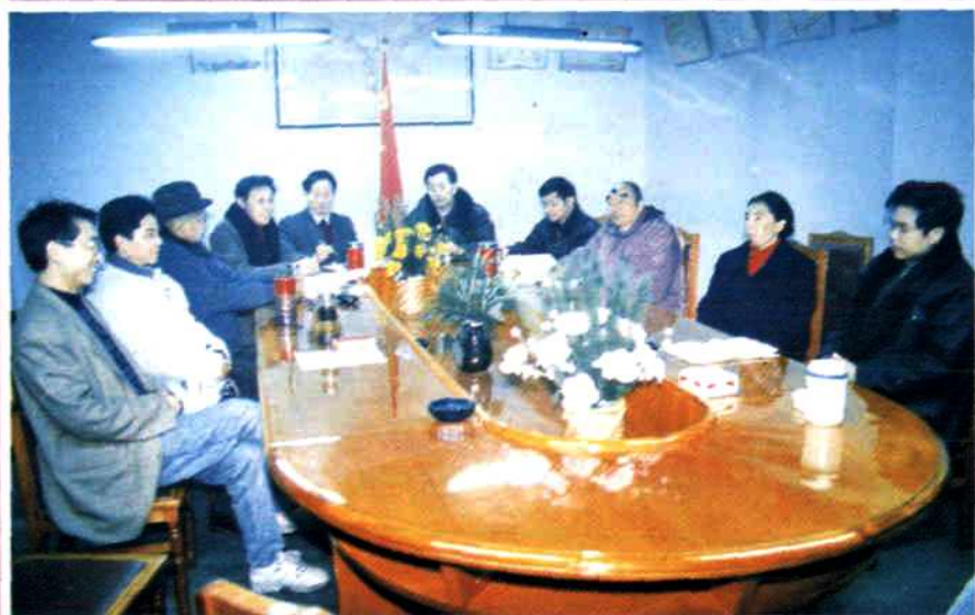
▲ 《绵阳市民族宗教志》编纂委员会全体成员研究志书出版工作