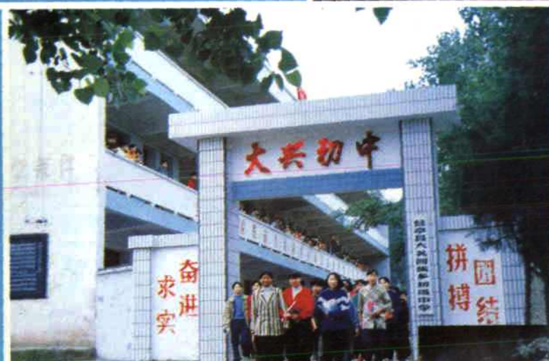
▲ 盐亭县大兴回族乡初级中学