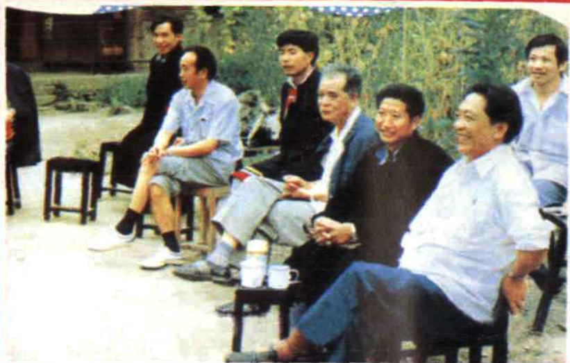
► 1994年省委副书记冯元蔚在北川视察民族工作