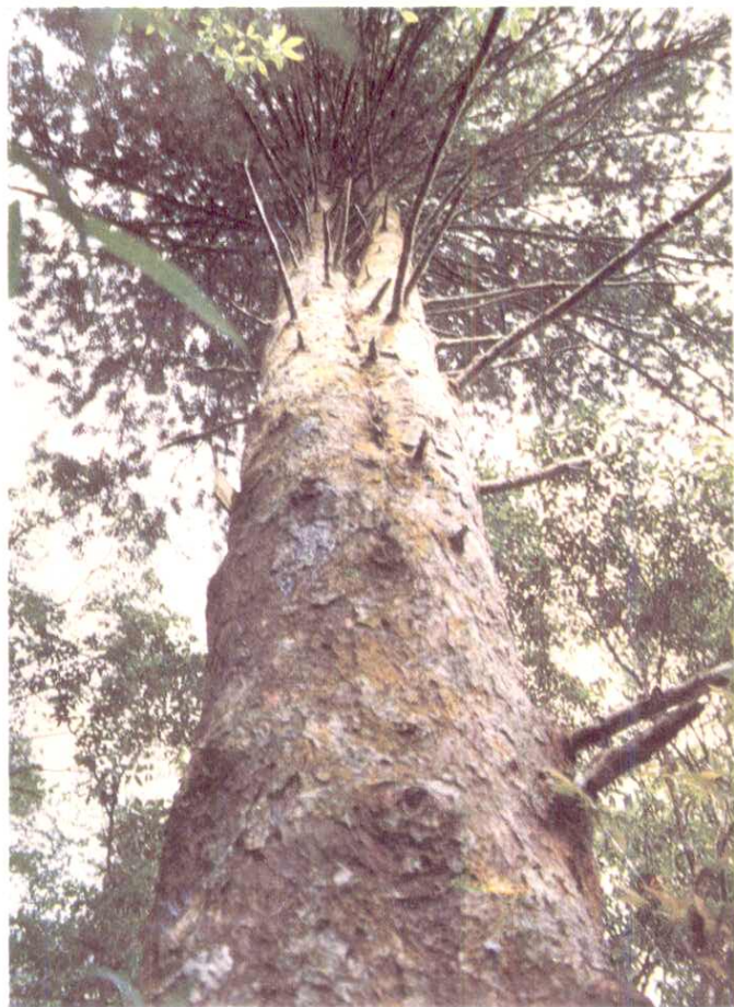
银杉——植物中的活化石