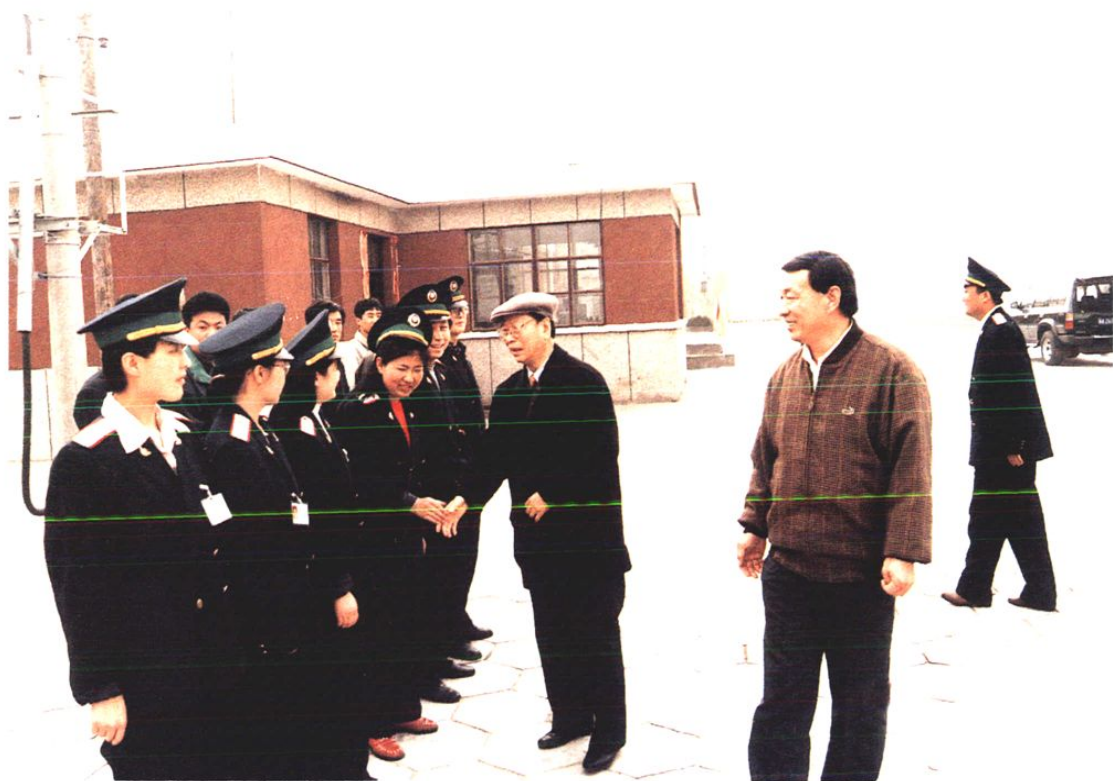
1998年4月20日神华集团公司党组书记、董事长肖寒（右三）视察神朔铁路