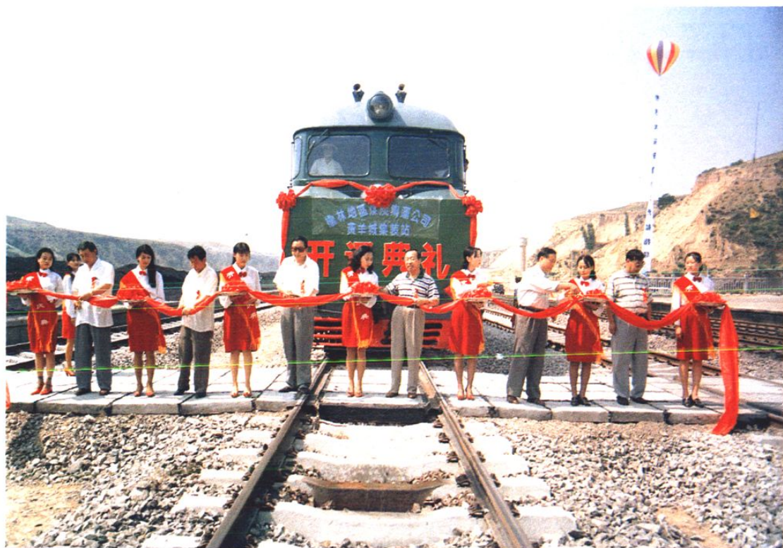
1997年7月10日黄羊城集装站开通典礼