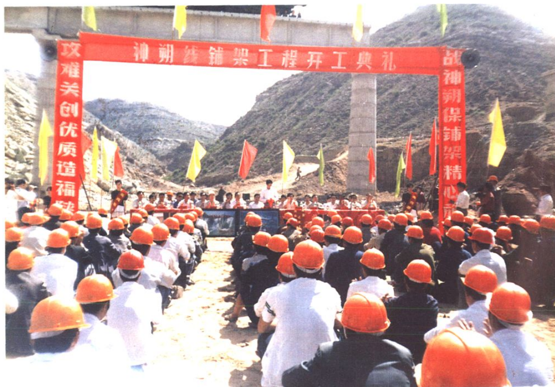
1994年7月1日神朔铁路陕西段铺架工程开工典礼