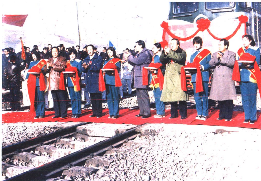
1999年12月1日神朔铁路燕家塔站开通运营