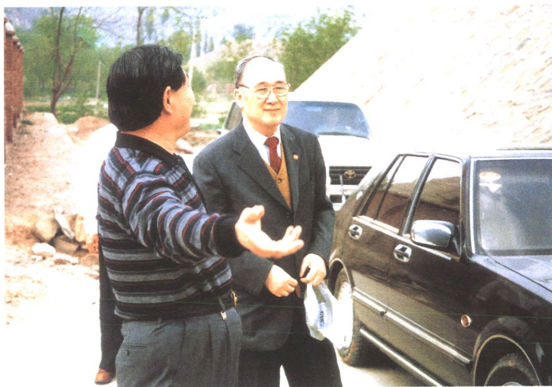
1998年5月20日国家能源部部长黄毅诚（右）视察神朔铁路