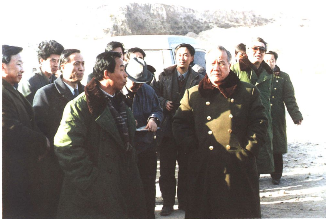
1994年1月23日国家计委主任陈锦华（右四）、陕西省省长白清才（右二）视察神朔铁路