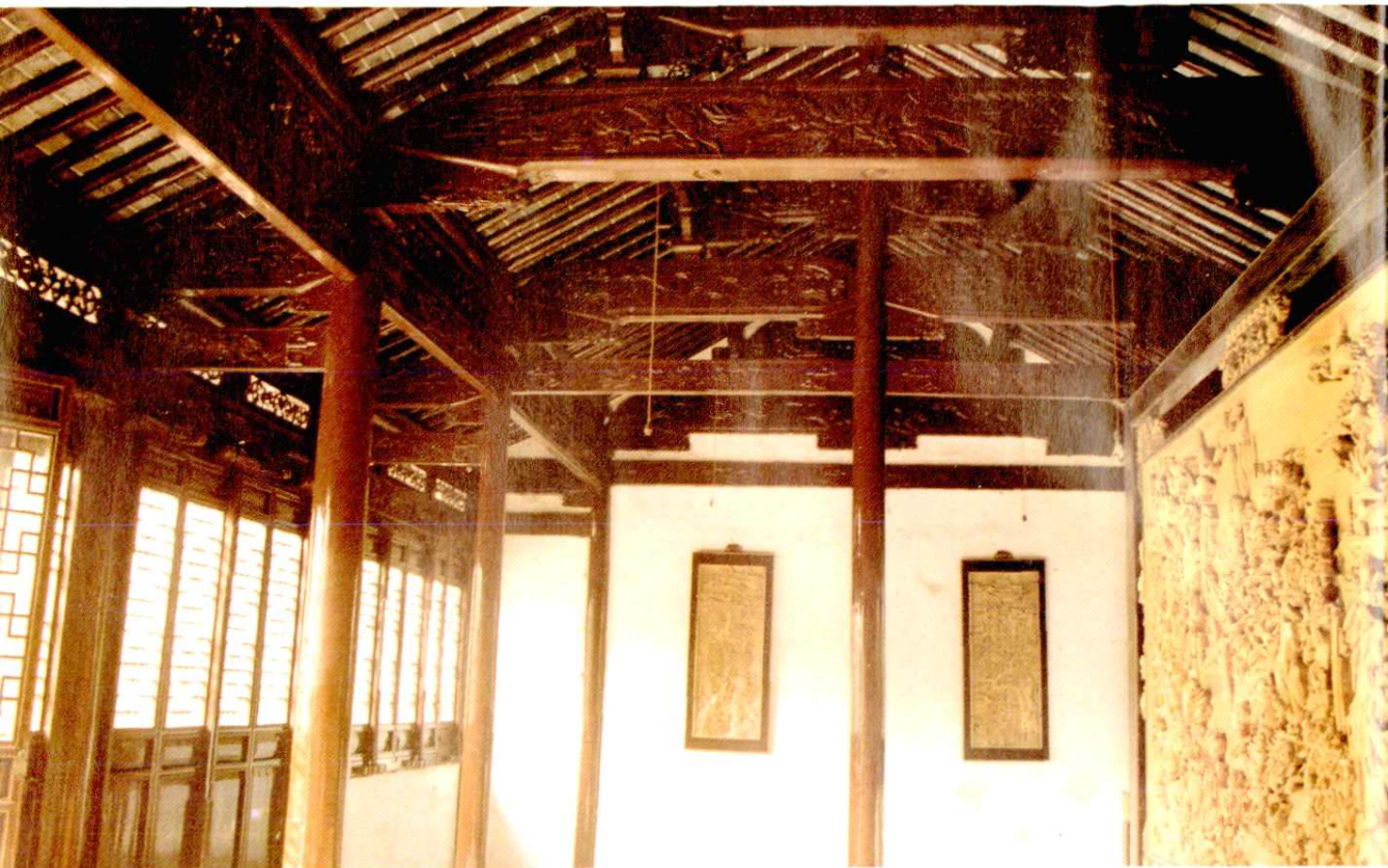
雕花厅。清代建筑，厅及两厢的梁枋、门窗上有精美的浮雕