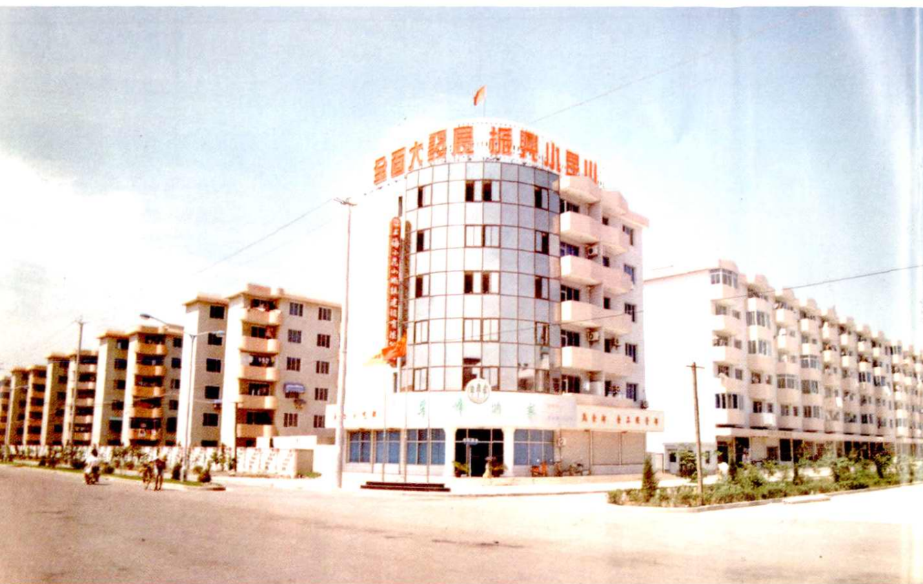
90年代新兴的小昆山镇