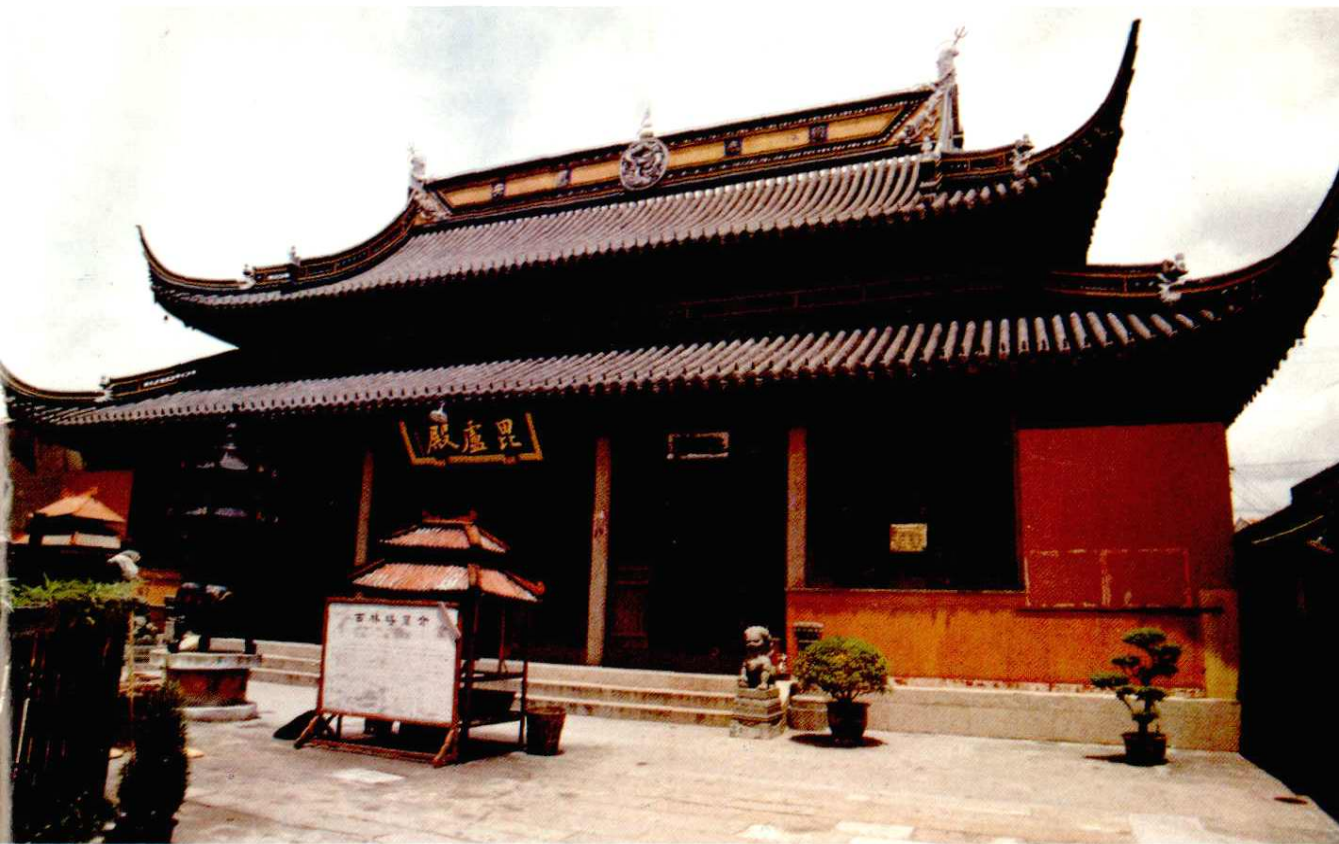
西林寺毘庐殿。宋代咸淳年间建