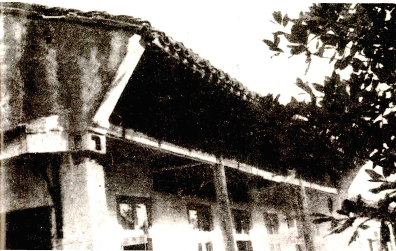
陈化成祠。1842年为纪念鸦片战争中牺牲的抗英名将陈化成而建