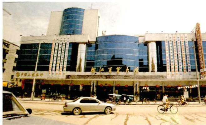
上海松江良友大厦