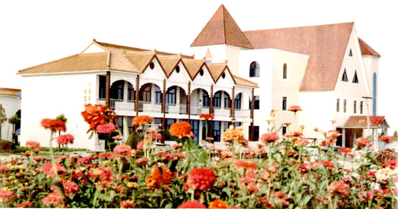
塔汇镇威荣(集团)电器成套厂