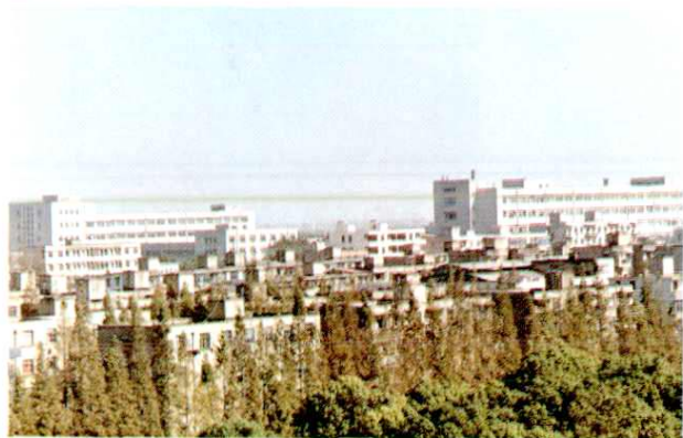
海欣毛纺股份有限公司