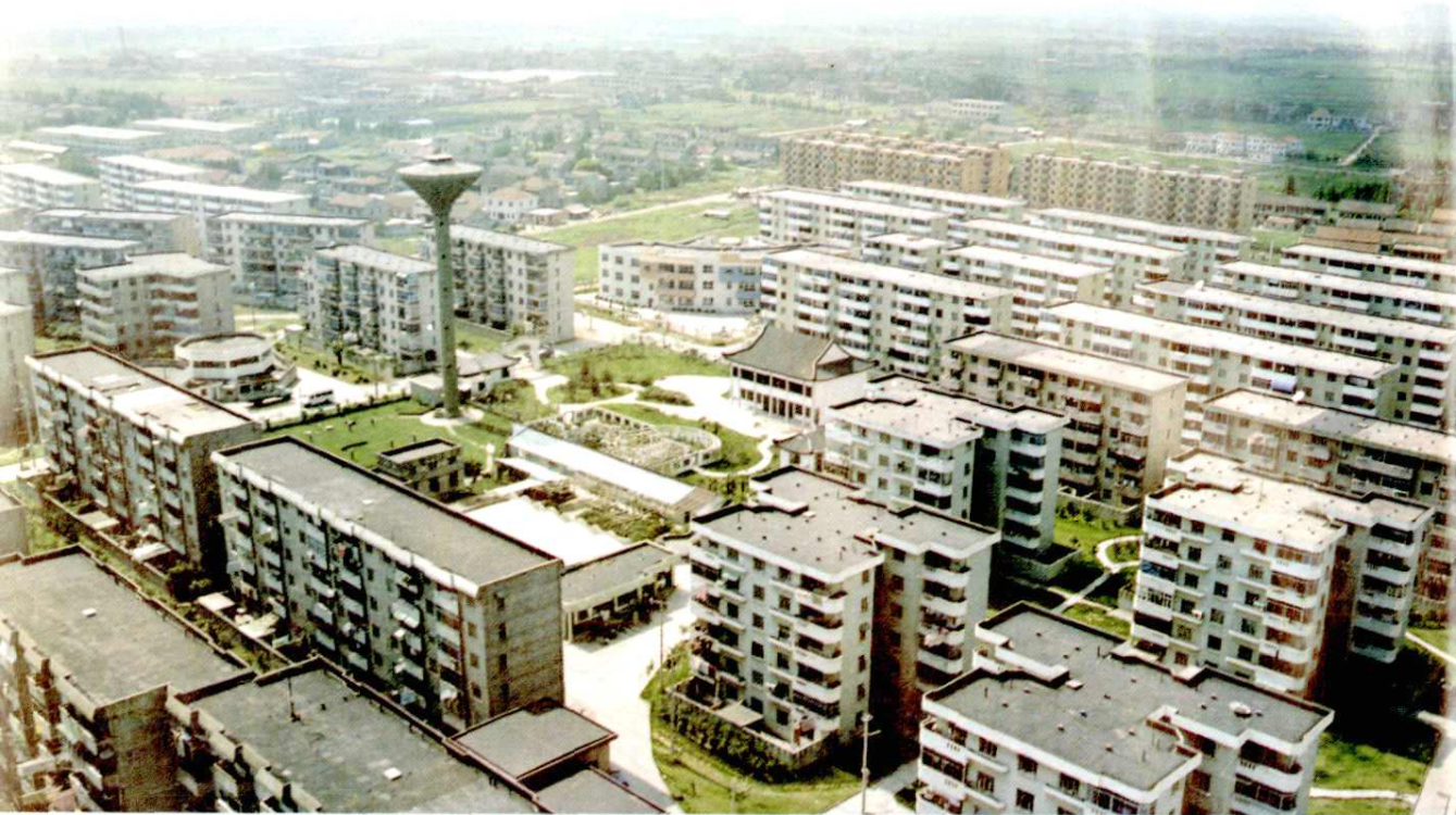
荣乐新村。1991年建成，有6层住宅55幢，建筑总面积13.32万平方米