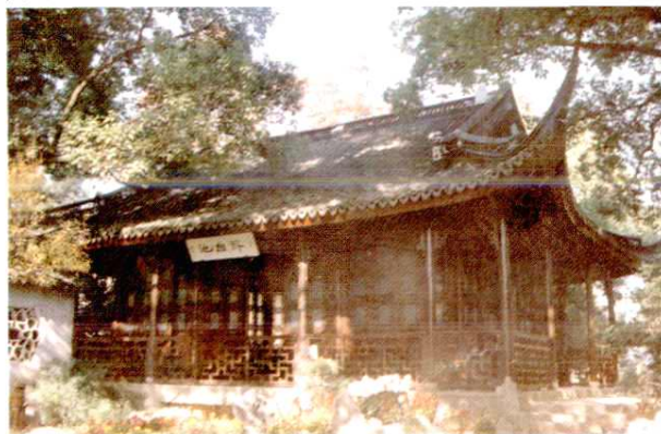
兰瑞堂(又称楠木厅)。明代建筑，部分梁枋为楠木