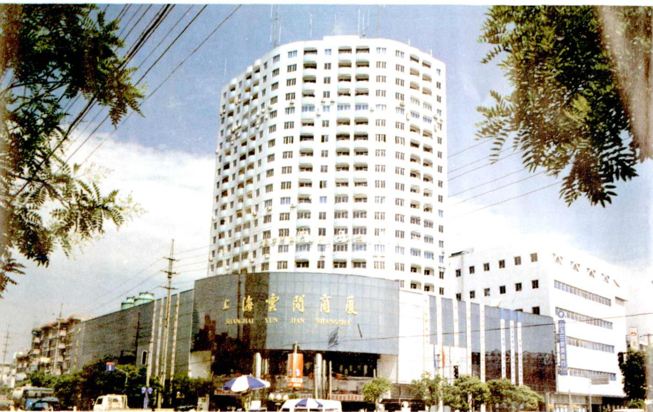
云间大厦。高21层，建筑面积25000平方米