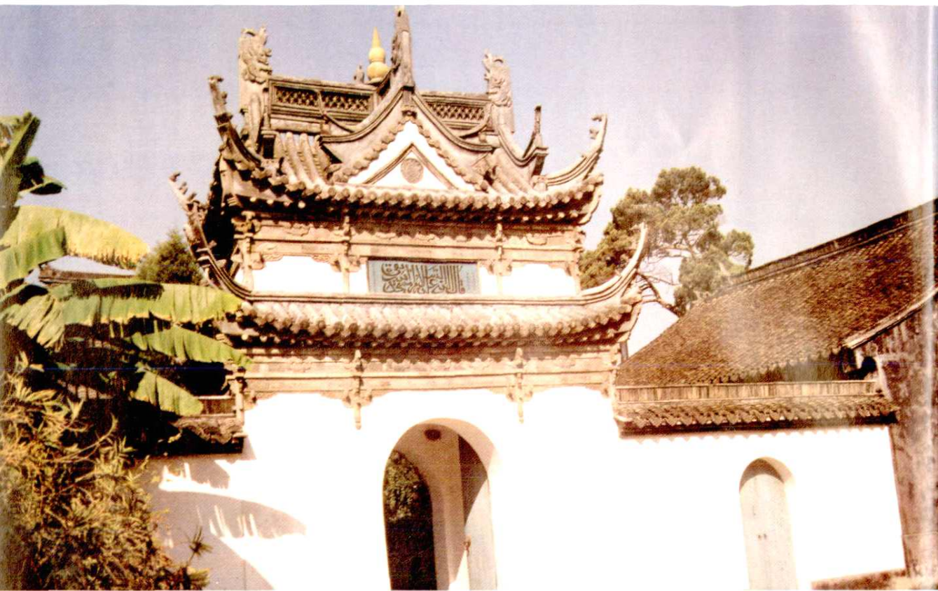
清真寺。元代至正年间建，系上海地区最古老的伊斯兰教建筑