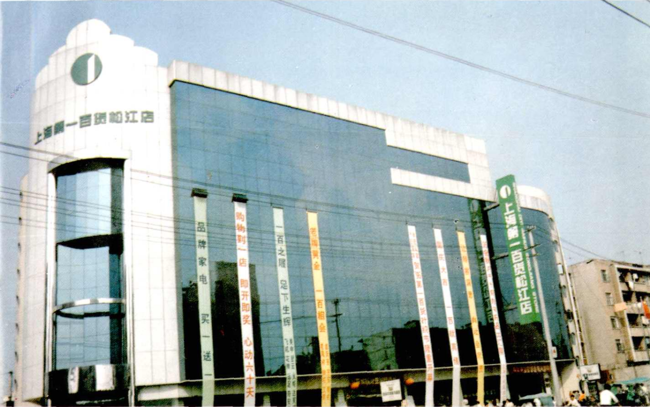
上海中百一店松江店