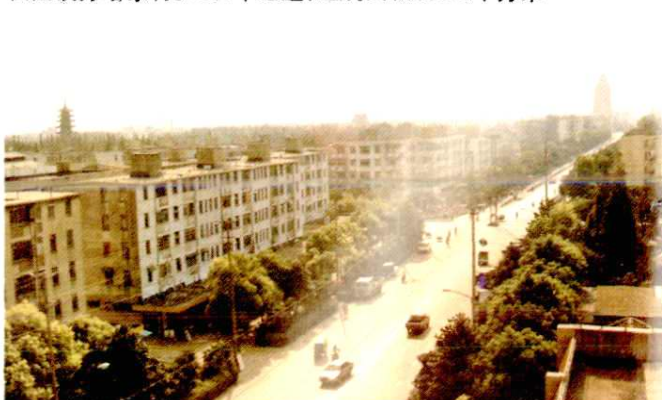
九峰住宅小区。1994年已建成6层住宅15幢