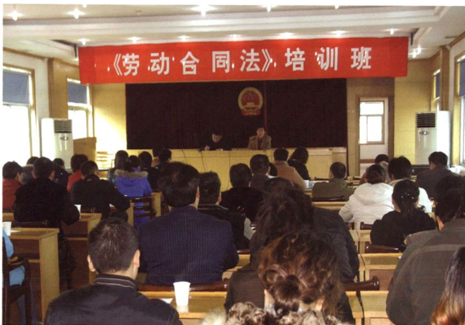
2007年12月，在全市广泛开展《劳动合同法》宣传月活动，为《劳动合同法》在我市顺利实施营造良好的氛围。