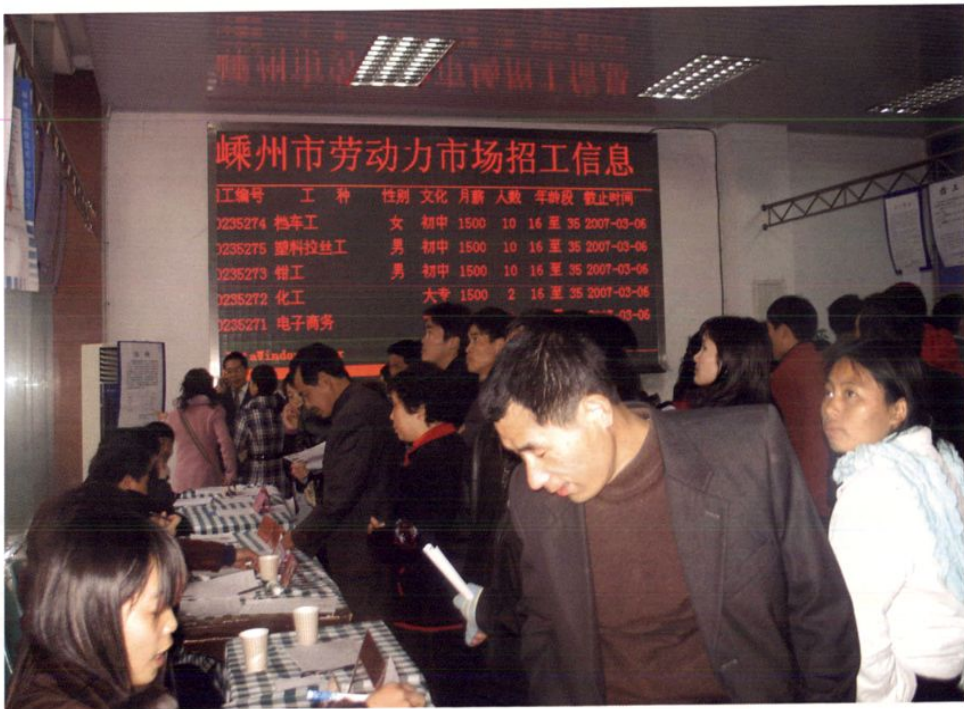
劳动力市场交流会上热闹的场景