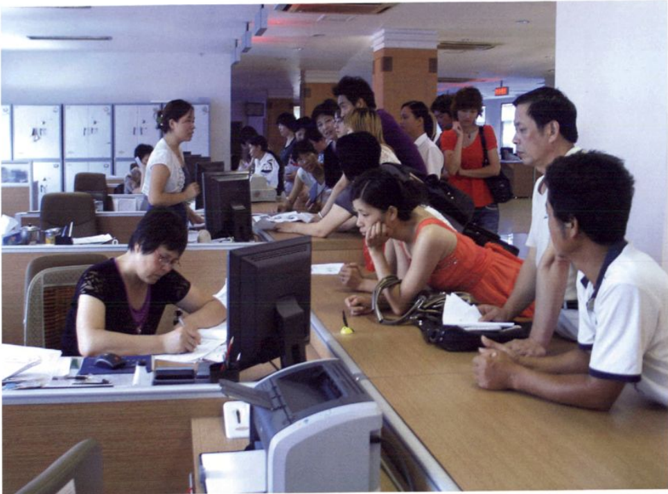
一体化、一条龙、一站式服务的市劳动保障服务厅。