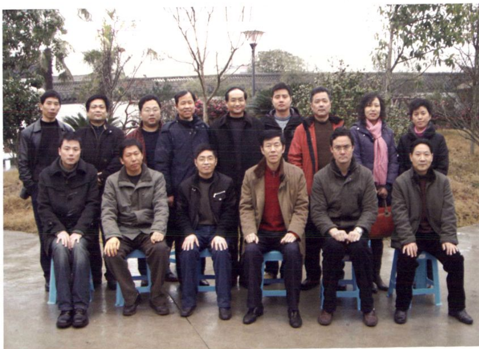
2008年元月，市劳动保障系统领导班子、科长、单位负责人合影。