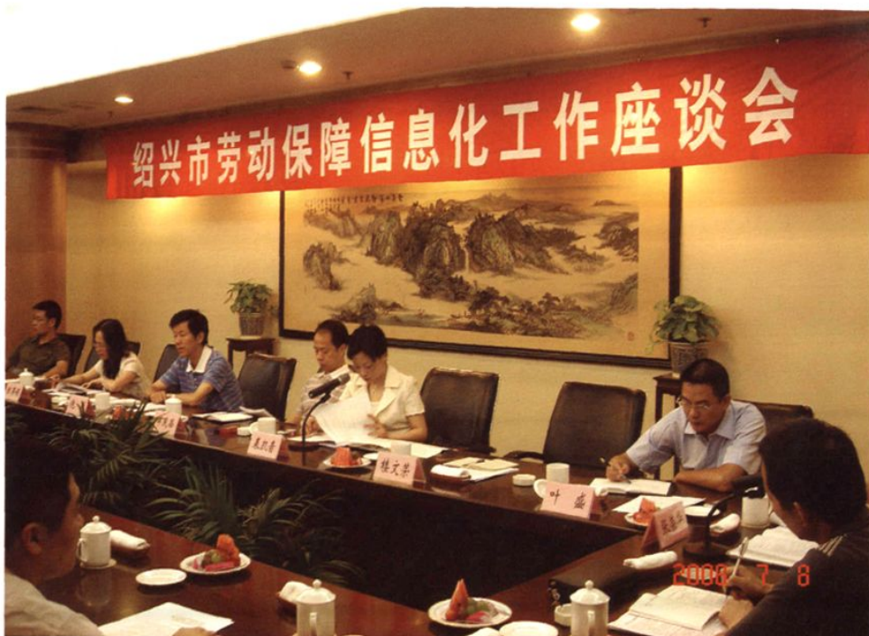
2008年7月8日，绍兴市劳动保障信息化工作现场会在嵊州召开。我市劳动保障一体化信息系统在全省劳动保障系统中处于领先水平。