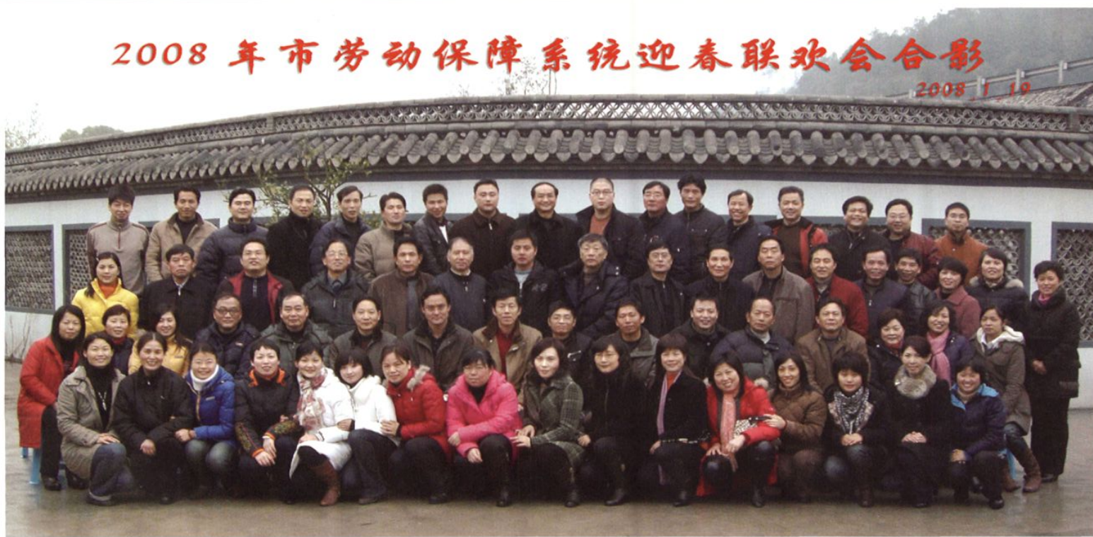
2008年元月，市劳动保障系统全体干部职工迎春联欢会合影。