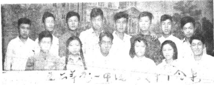
1956年秀一中团总支干部合影