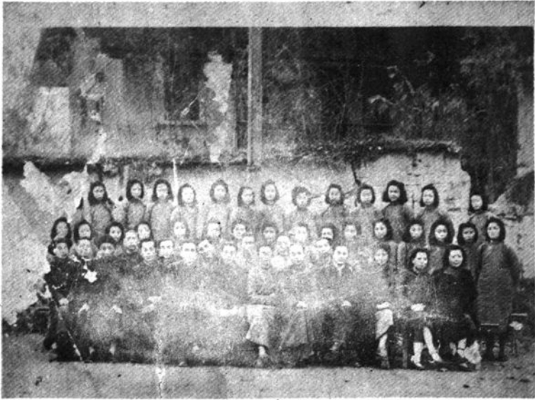
1946年秀山中学初中23班女生组,全体 学生与全体教师(含地下党员教师)合影