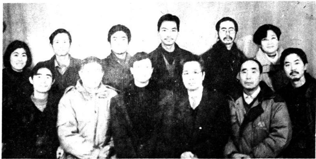
现任校长、副校长、教务处主任、政教处主任、总务处主任、办公室主任、校团委书记、工会主席照片