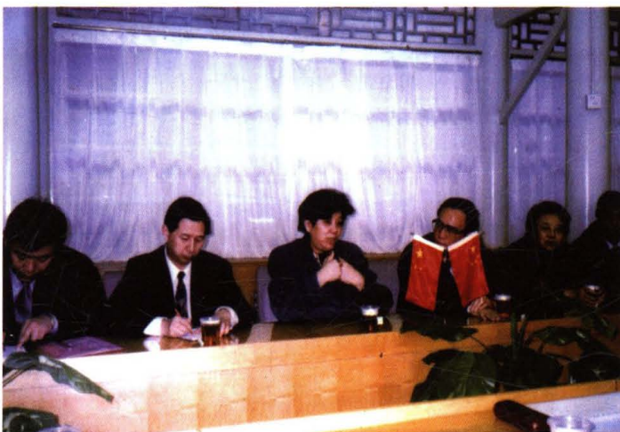
◀ 1998年1月8日，教育部长陈至立、北京市委副书记李志坚、教育部基础教育司司长李连宁、市教委主任徐锡安、市教委工委主任陈大白来校慰问师生。