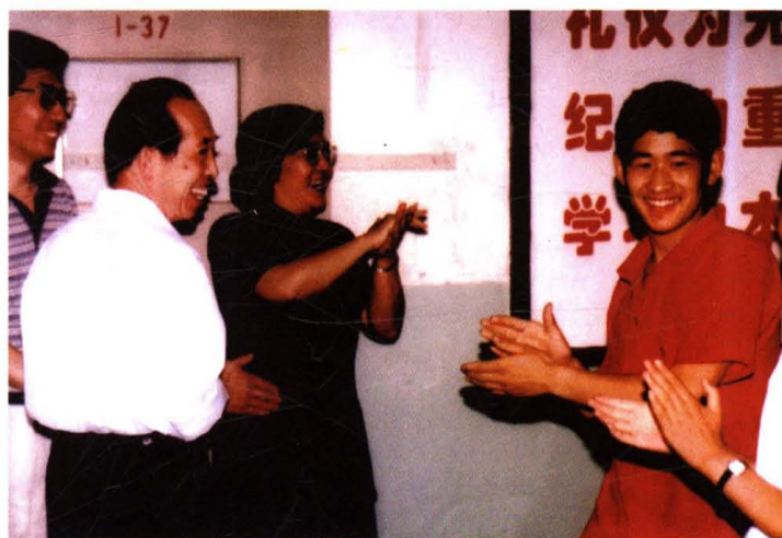
▶ 1999年9月，副市长林文漪来校看望师生。