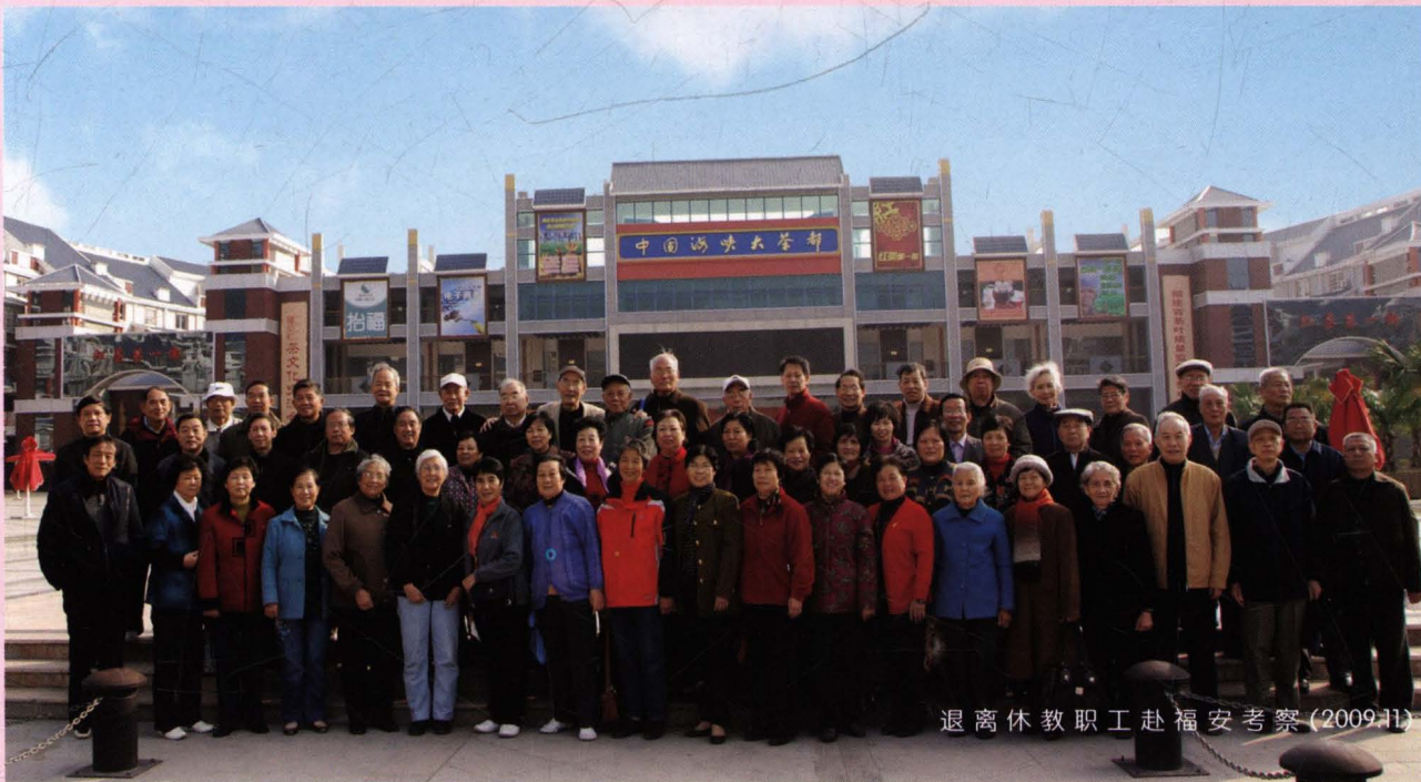
离退休教职工赴福安考察(2009.11)