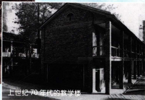
上世纪 70 年代的教学楼