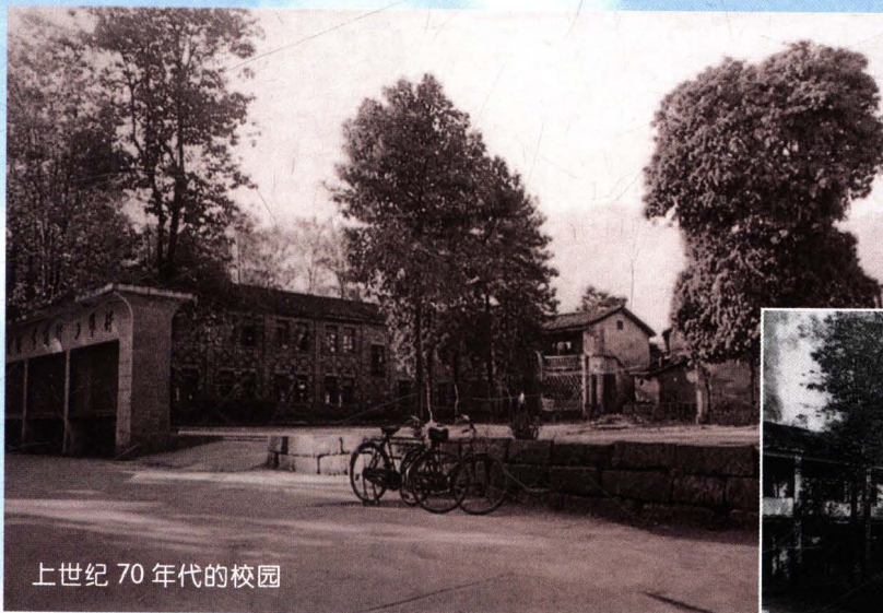
上世纪 70 年代的校园