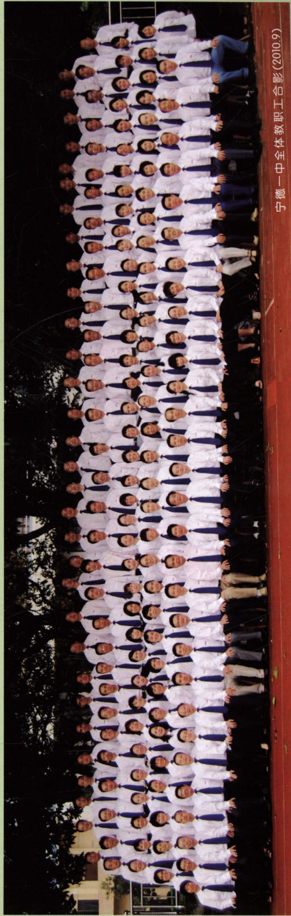
宁德一中全体教职工合影(2010.9)