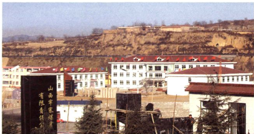
宇寨煤业有限公司