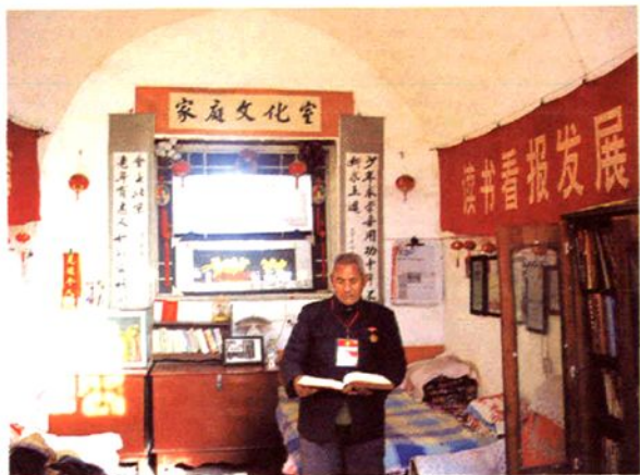
李青山家庭文化室