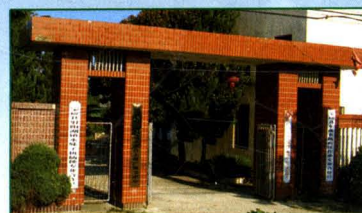
▲ 农业技术服务中心