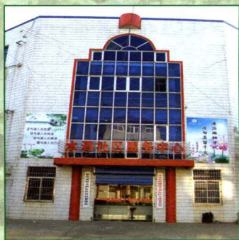
水泗社区服务中心