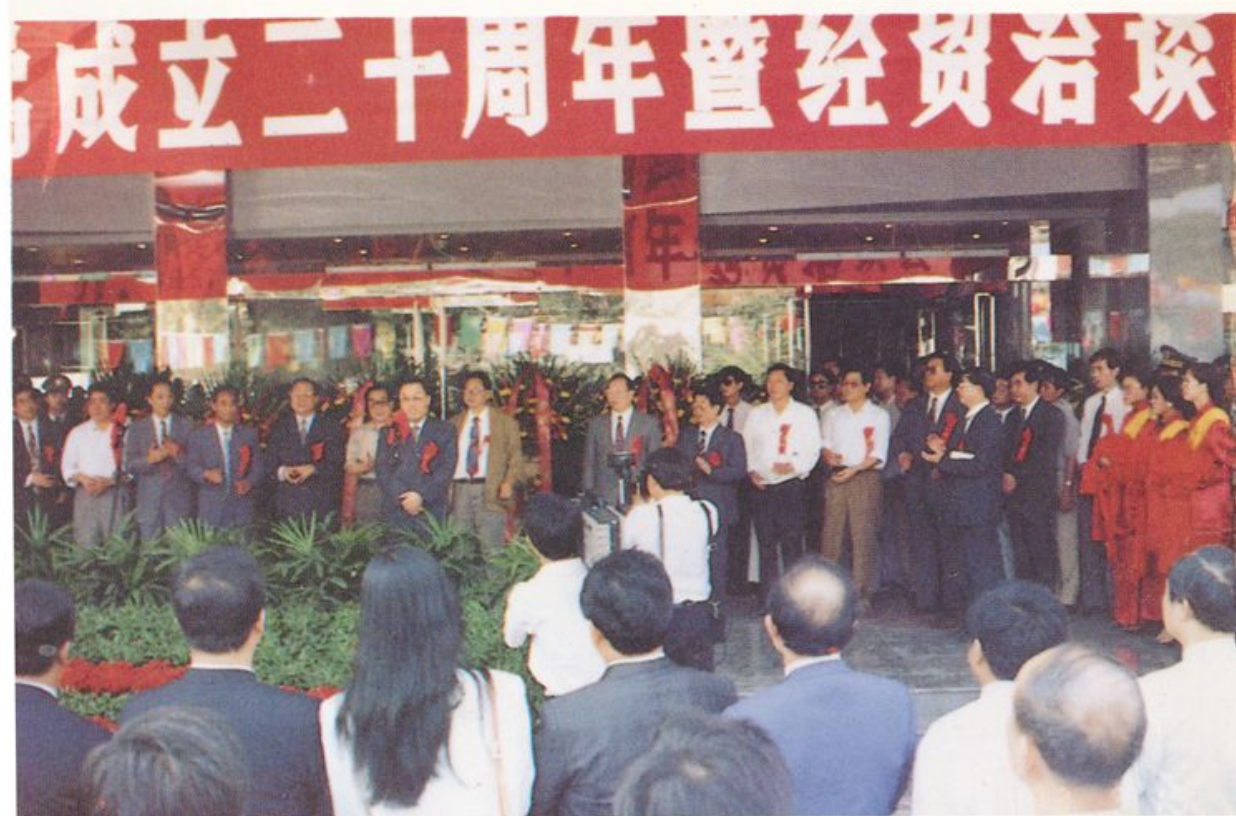
一九九三年公司成立二十周年经贸洽谈会