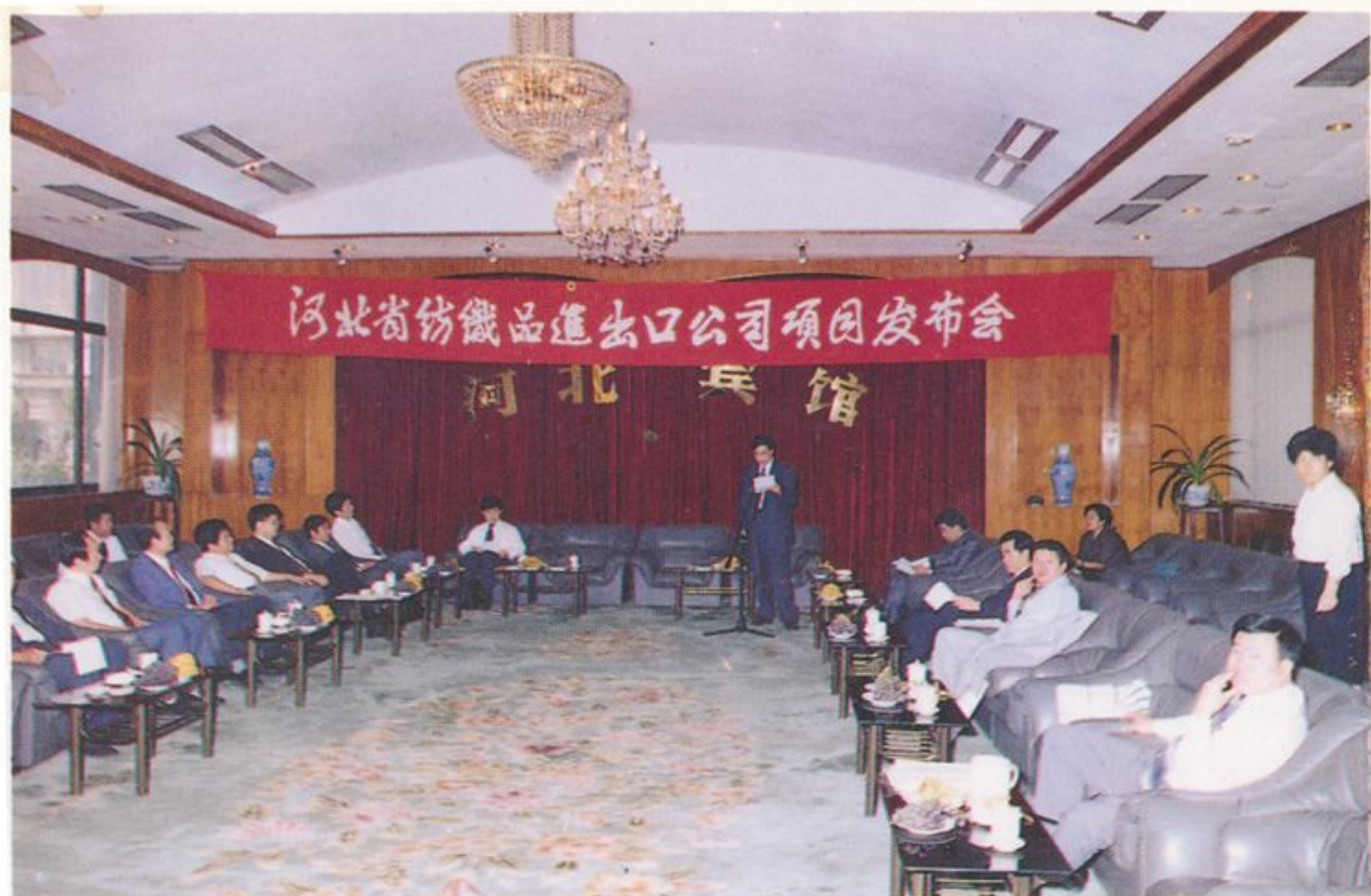
公司洽谈项目发布会