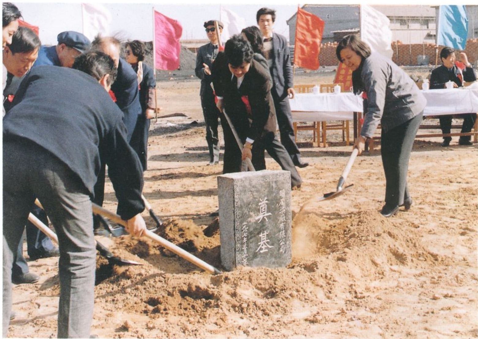
一九八七年中外合资企业明石染厂奠基