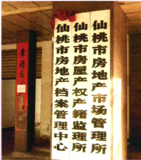
局属部分二级单位门牌