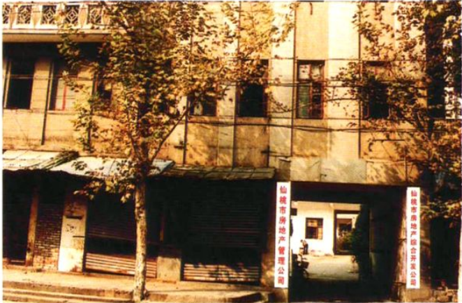
1994年，仙桃市房地产管理公司、仙桃市房地产综合开发公司外貌