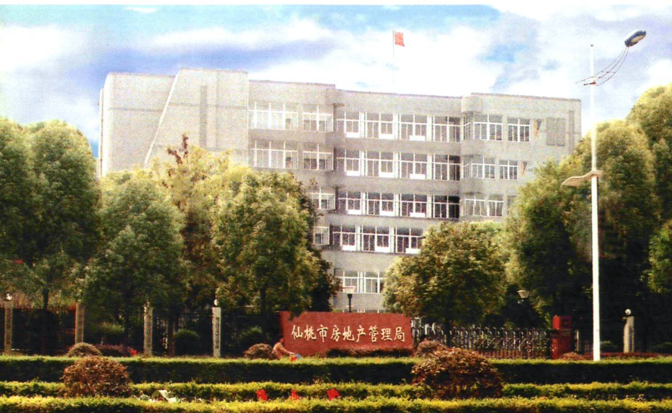
2004年，仙桃市房地产管理局办公楼外景