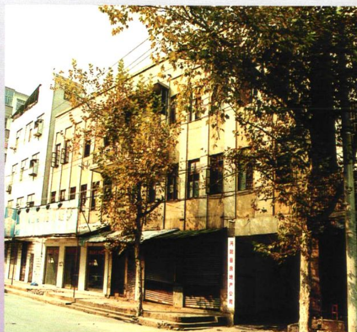
1986年，沔阳县房地产公司办公楼外貌