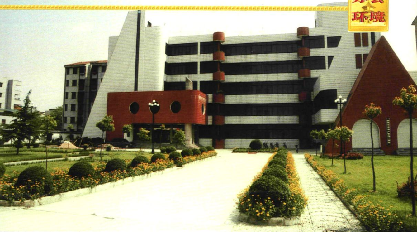
1999年，房管局办公楼外景