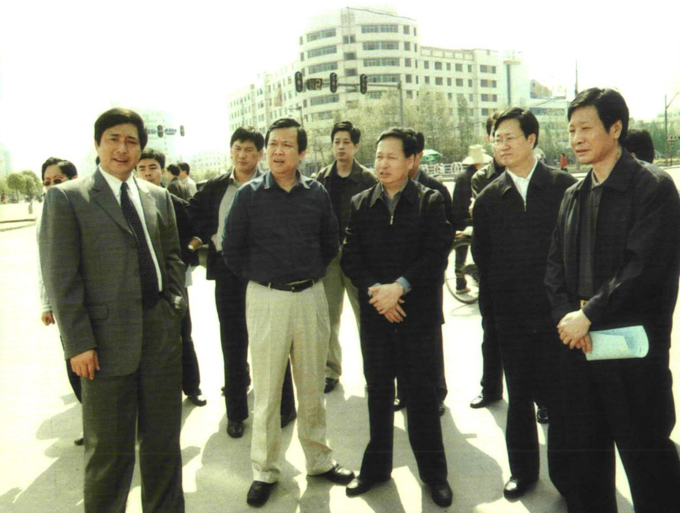
2005年，湖北省省长罗清泉（中）、省政府秘书长李春明（右二）、仙桃市市委书记马清明（左二）、市长陈吉学（右一）视察仙桃文化步行街，仙桃市房地产管理局局长左世红（左一）陪同