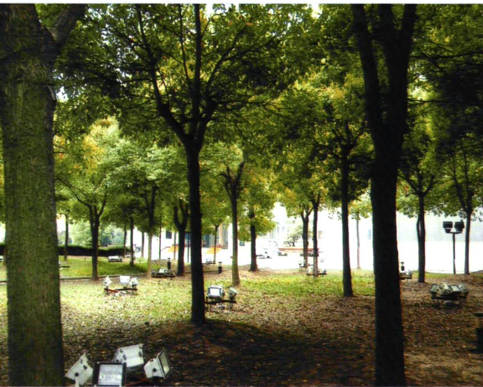
2005年，房管局机关 院内绿化亮化工程