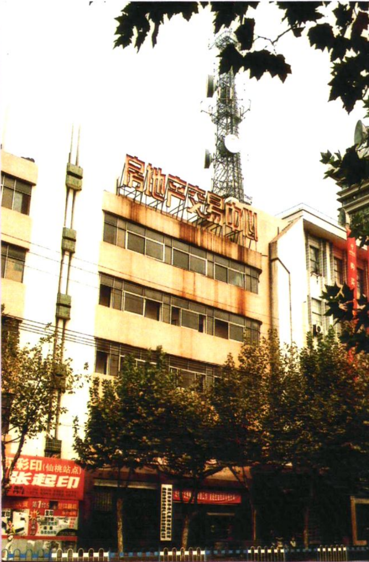
2005年，仙桃市房地产交易中心外貌