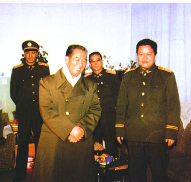
总部司令部原参谋长张永堂在总队政委张武陪同下来校视察(1992年11月)