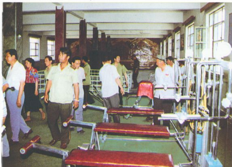
供三个区队同时训练的室内训练厅