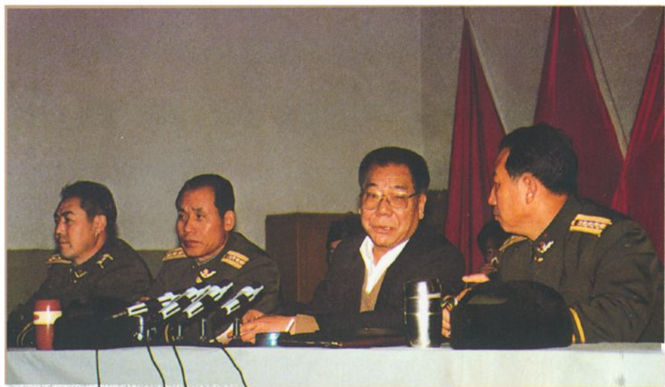
自治区党委常 委、宣传部长冯大真 来校作形势报告 (1991年)