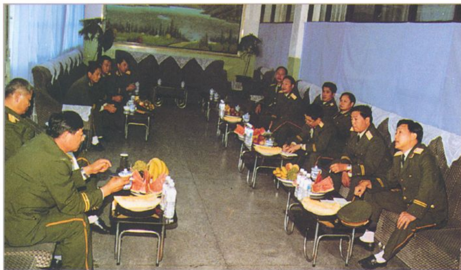
学校领导向来校视察的总部司令部副参谋长张岳荣汇报工作(1996年9月)