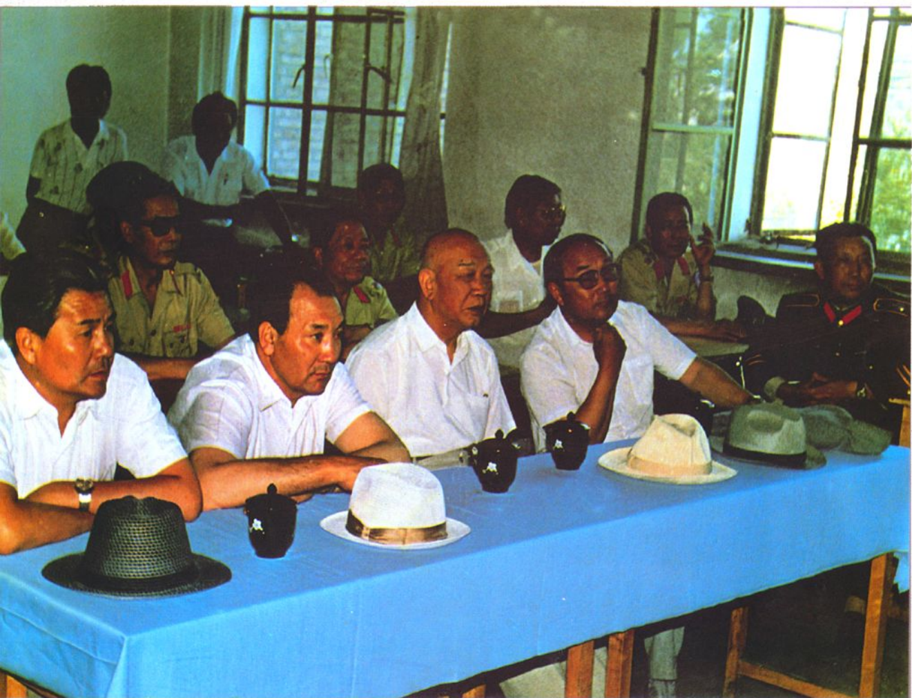
全国政协副主席王恩茂,自治区政协主席巴岱,党委副书记贾那布尔,副主席金云辉,在公安厅、总队首长陪同下来校视察(1988年7月)