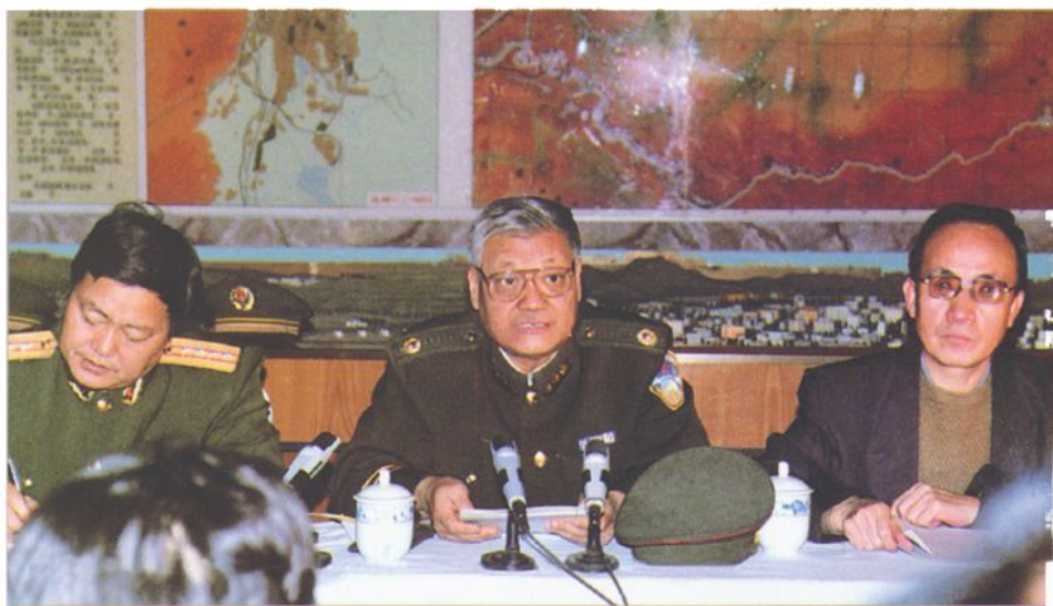
自治区党委常委、政法委书记李逢滋，公安厅长陈金池，总队政委张武来校视察(1994年12月)