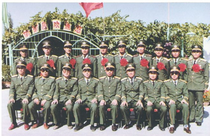
学校领导与学校优秀教员、优秀教育工作者合影(1995年9月)