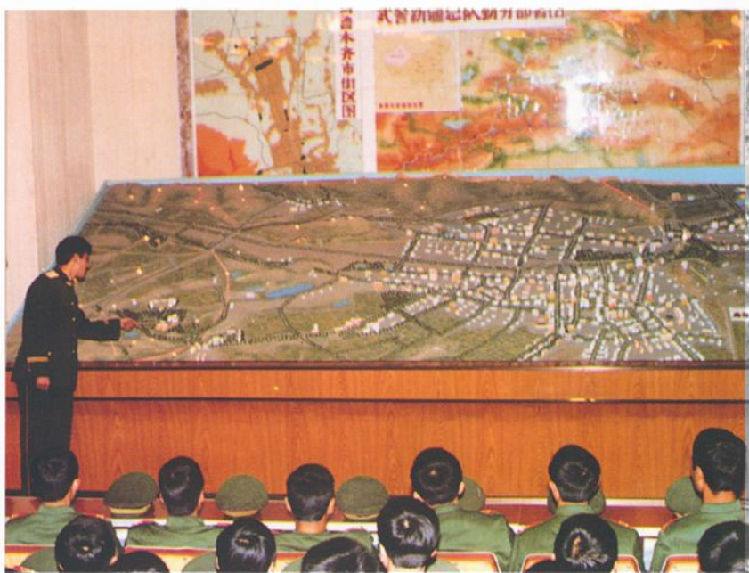
利用内卫专修室的电动沙盘进行教学