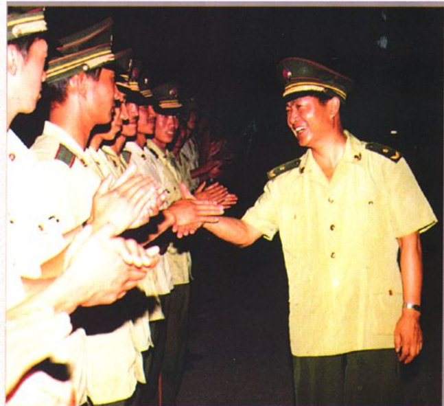
总部司令部参谋长吴双战来校视察(1993年7月)