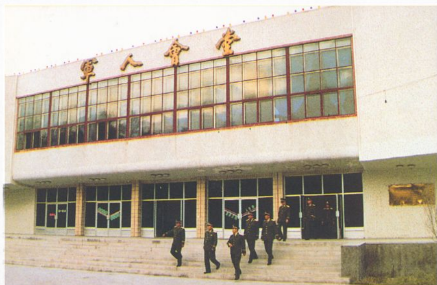
能容千人、具有综合功能的军人会堂