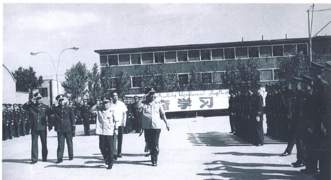
公安厅长薛光，总队长卫尚德检阅毕业学员（1987年7月）