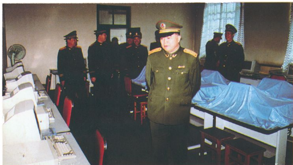
安副司令员参观 微机教室(1996年4 月)