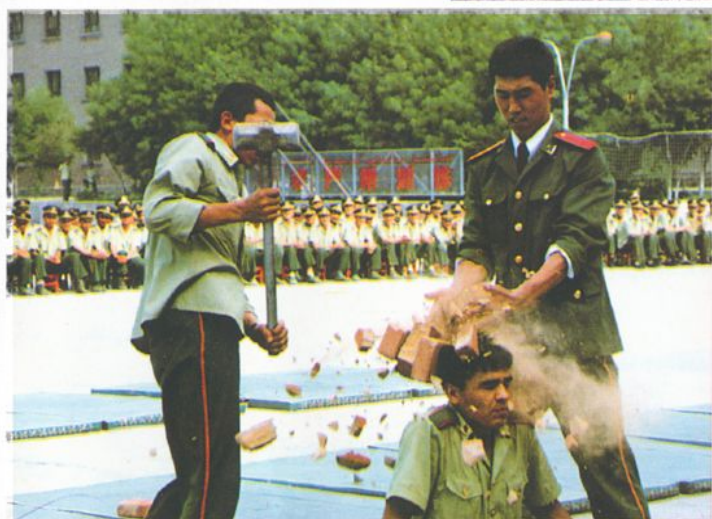
学校气功队汇报表演