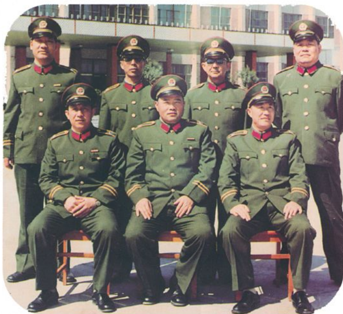
学校党委部分成员(1985年)