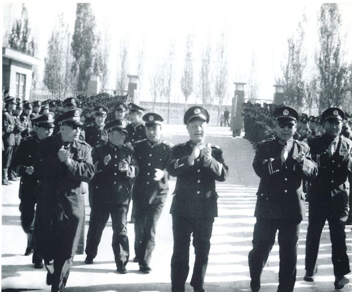
武警部队司令员李连秀，公安部副部长俞雷在公安厅、总队首长陪同下来校视察(1986年10月)