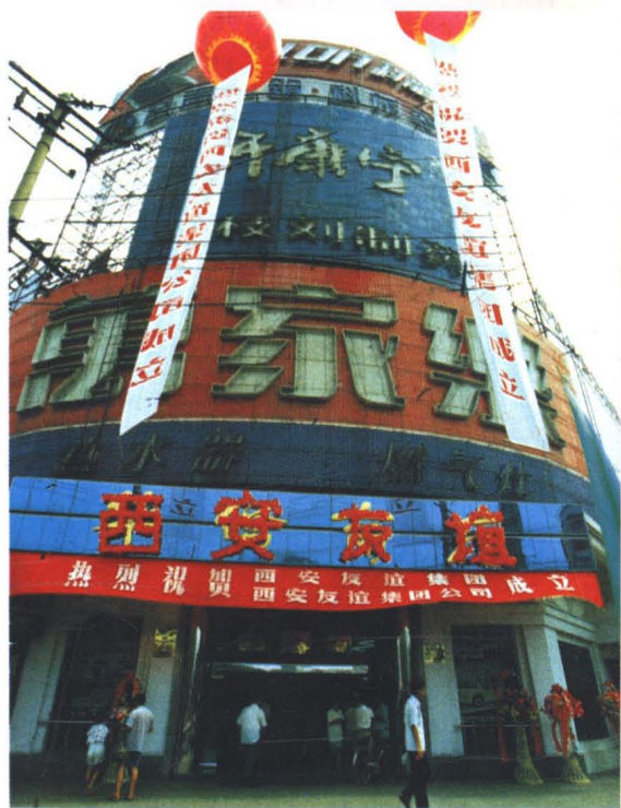
西安友谊集团公司(原西安华侨商店)门头外景