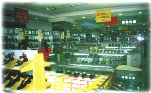
西安解放百貨大樓二樓營業場