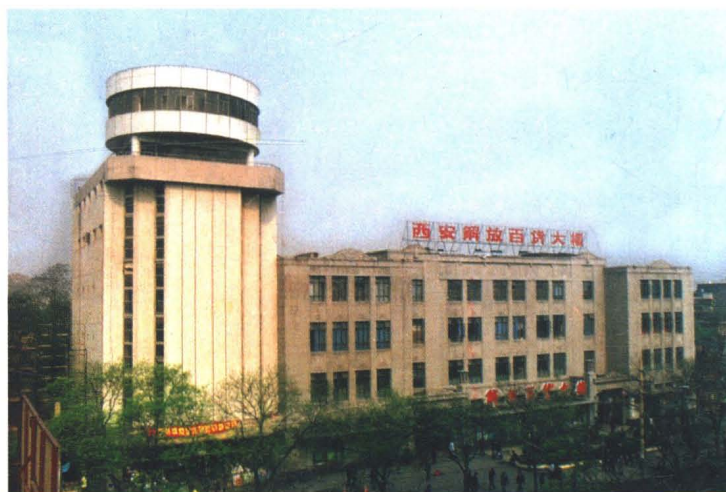
西安解放百貨大樓外景