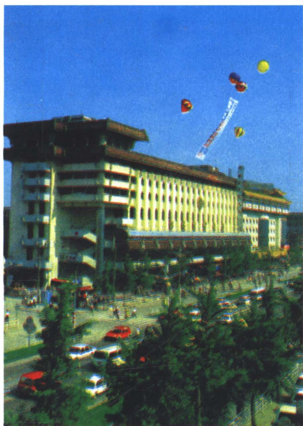
西安百货大厦外景