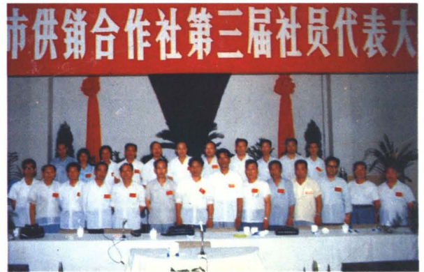
1985年8月，市供销社第三届社员代表大会理事会成员。