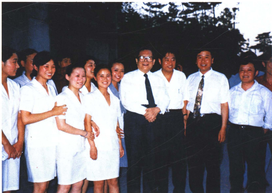
江泽民总书记和西安饮食集团职工在一起