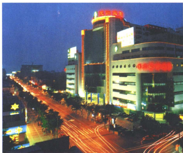
西安民生百货大楼夜景