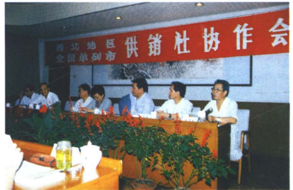
1992年10月，全国单列市供销社协作会议在西安市召开。