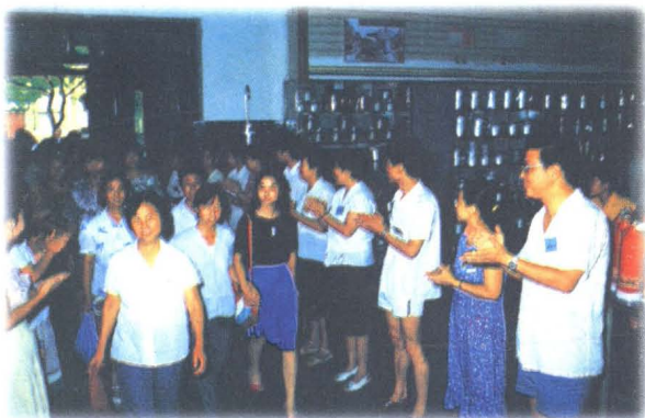
经理们迎接第一批客户