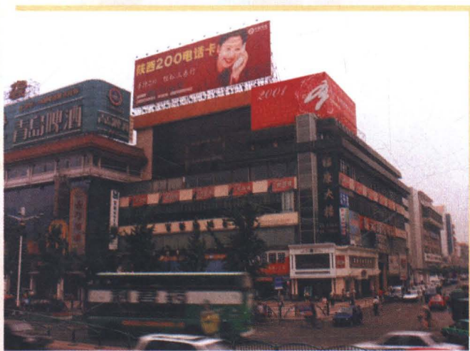
西安福康服装百货大楼外景