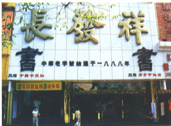
长发祥大楼部分外景