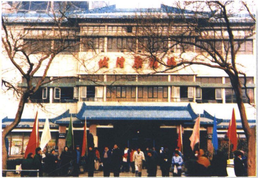
西安城隍庙商场前外景