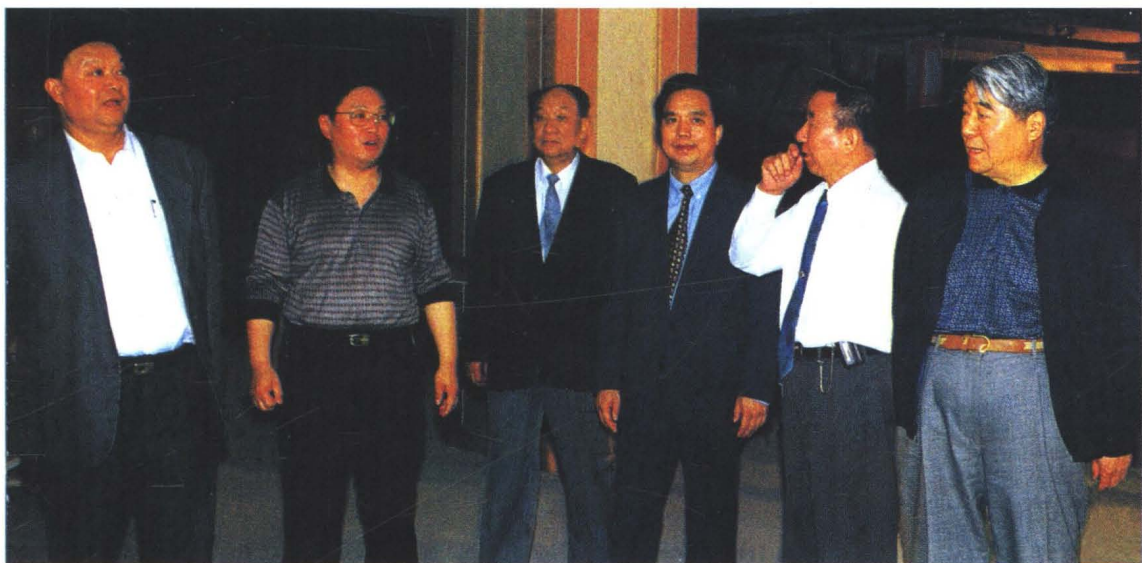
省市领导到西饮集团视察（右三为陕西省委书记李建国、右一为陕西省省长程安东、左三为陕西省政协主席安启元、左一为西安市委书记崔林涛）。