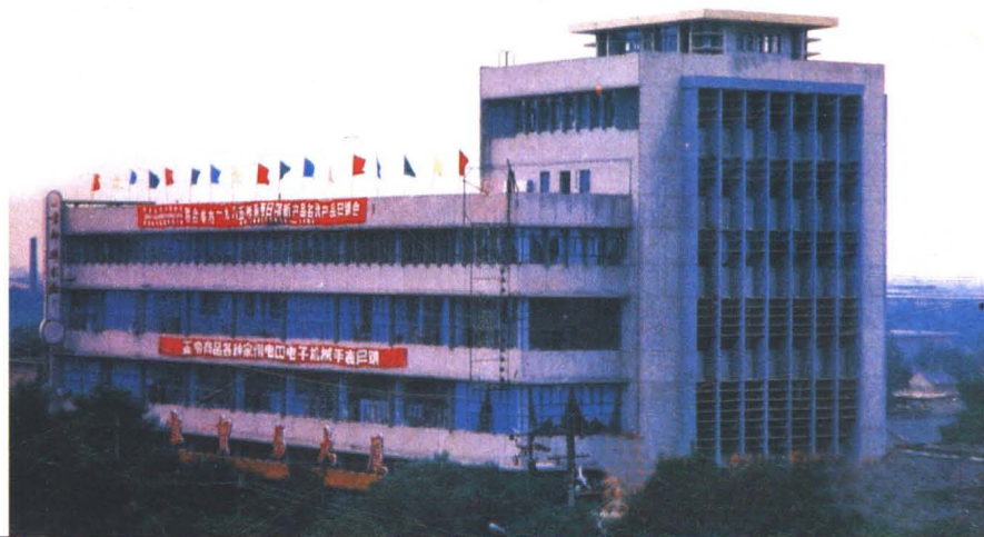
朱雀贸易大厦外景