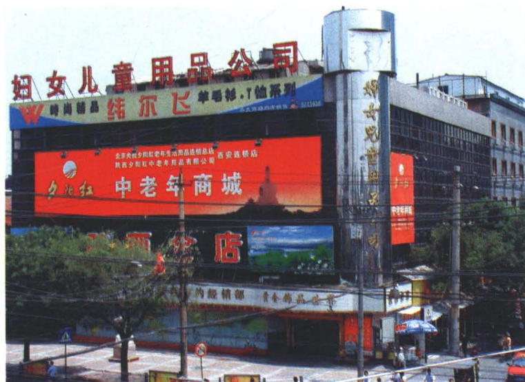
西安妇女儿童用品公司大楼外景