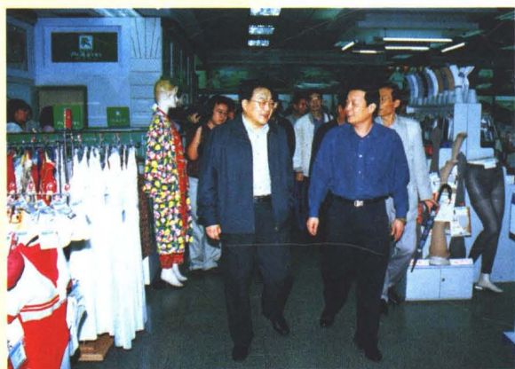
1997年秋副省长巩德顺视察唐城百货大厦。