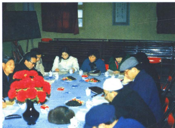
1989年1月16日全国人大代表视察民生百货商店