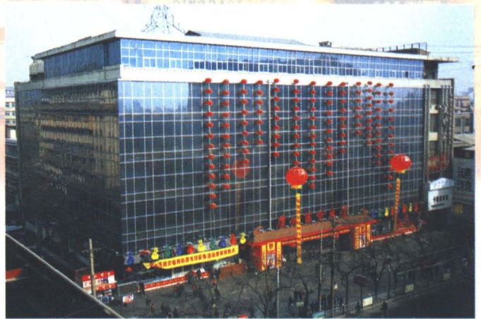
唐城百貨大廈外景