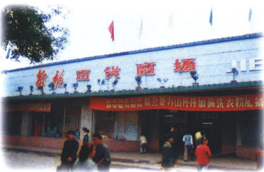
1952年建成的解放百貨商場部分外景