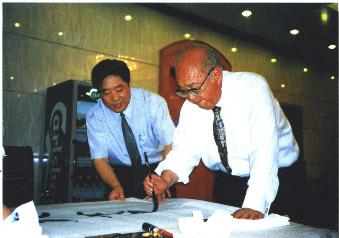
全国人大副委员长王光英为德发长饺子馆题词