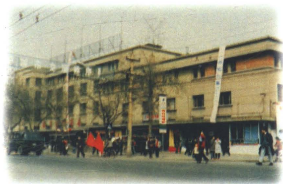
1959年9月建成的民生百货大楼外景