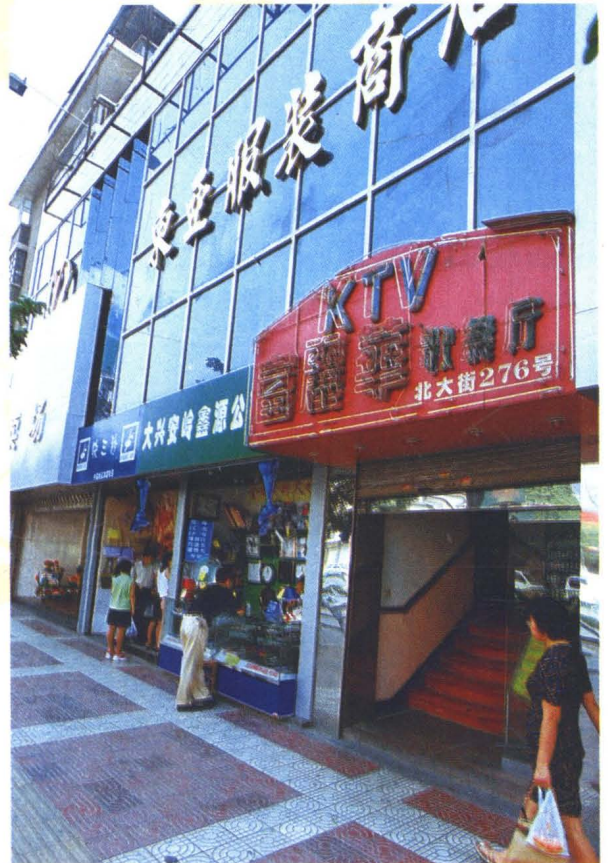
东亚服装商店外景