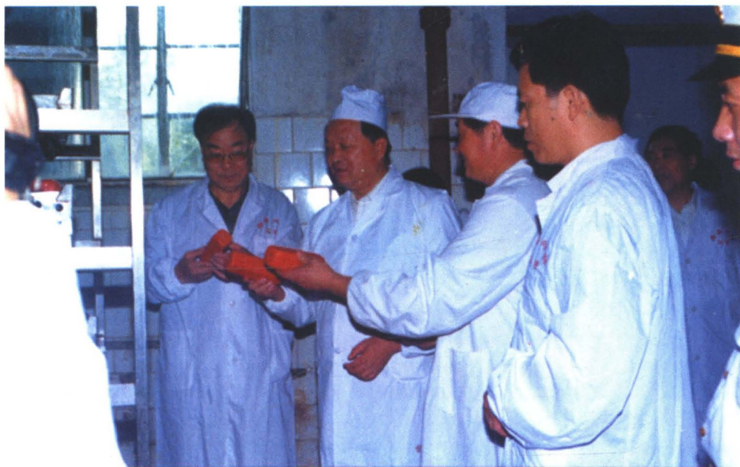
西安市委书记崔林涛(右二)、市商贸主任王世龙(左一)视察西安市肉联厂。