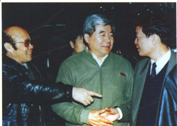
1996年1月29日省长程安东视察唐城百货大厦。