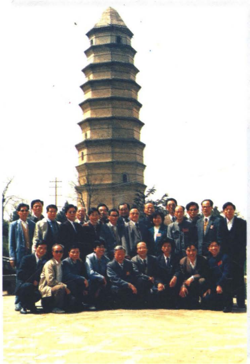
全国十大百货商店第十七次经理座谈会于1987年4月22日在延安闭幕，首席代表在宝塔山下。