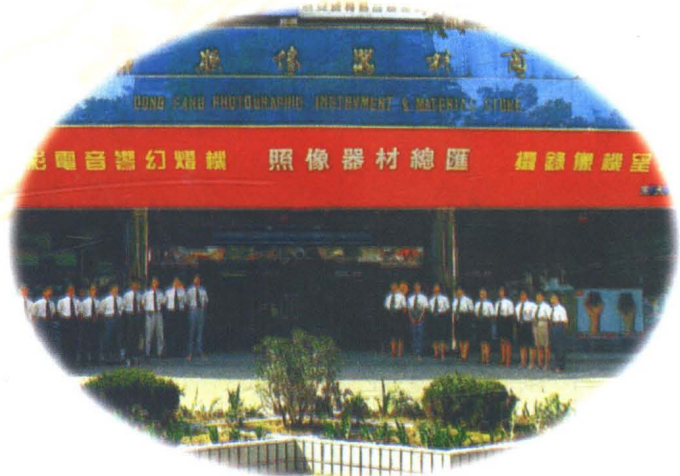
西安東方照相器材商店外景