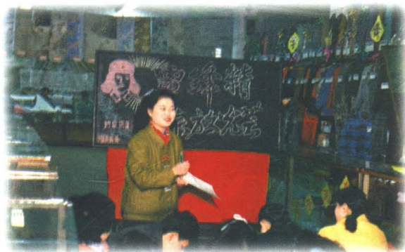
全国劳动模范郭凤莲，1987年3月5日向全体职工汇报岗位学雷锋经验。