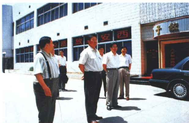
中共西安市委书记崔林涛到解放路饺子馆检查工作