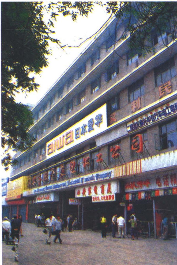
西安市五金交电总公司