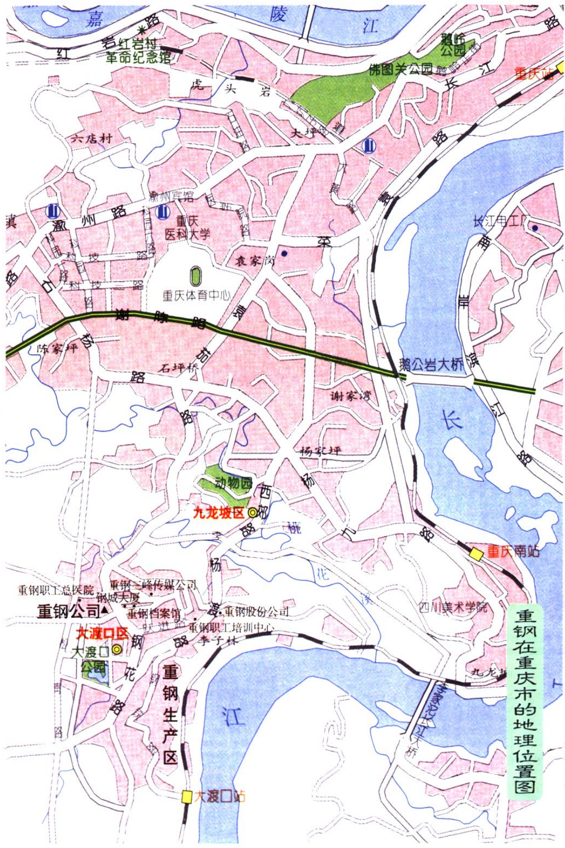
重钢在重庆市的地理位置图