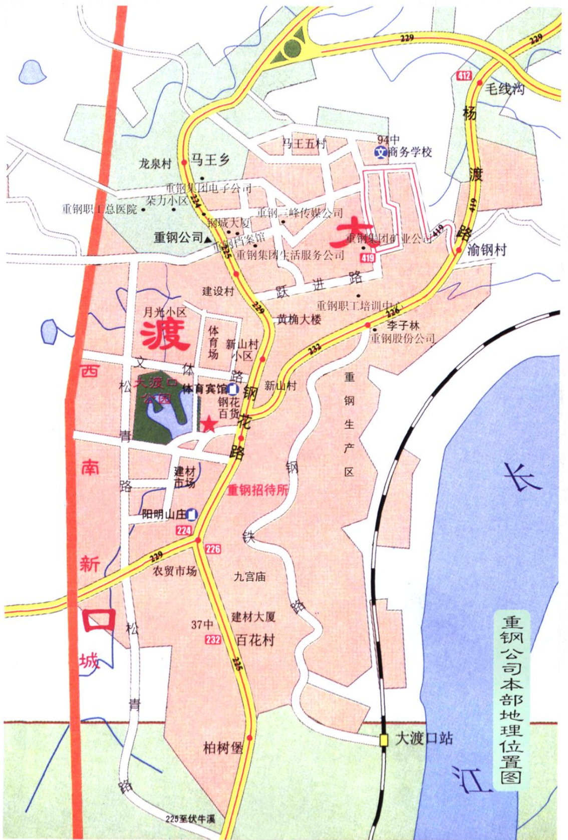
重钢公司本部地理位置图