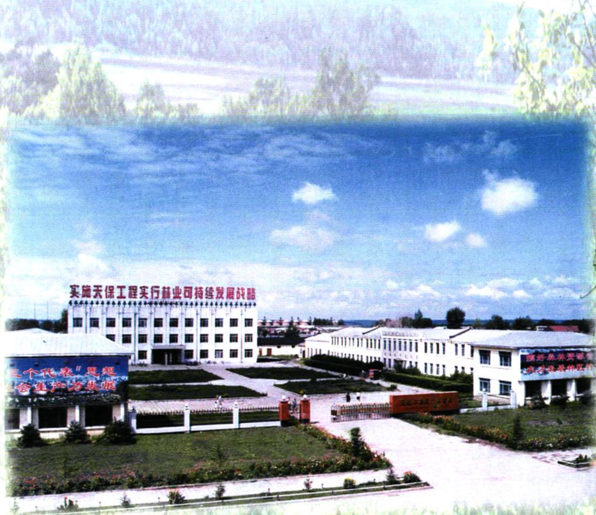
通北林业局机关办公楼