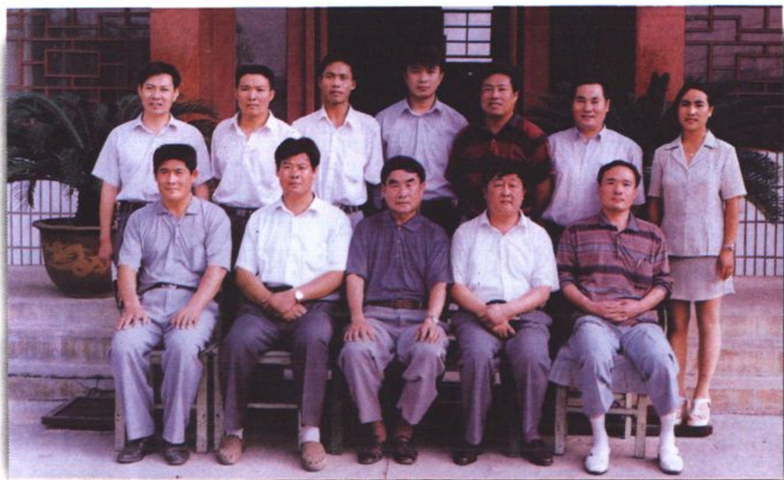
桥塘村领导班子及部分编委成员合影