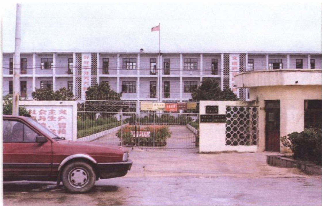
桥塘小学校全貌缩影