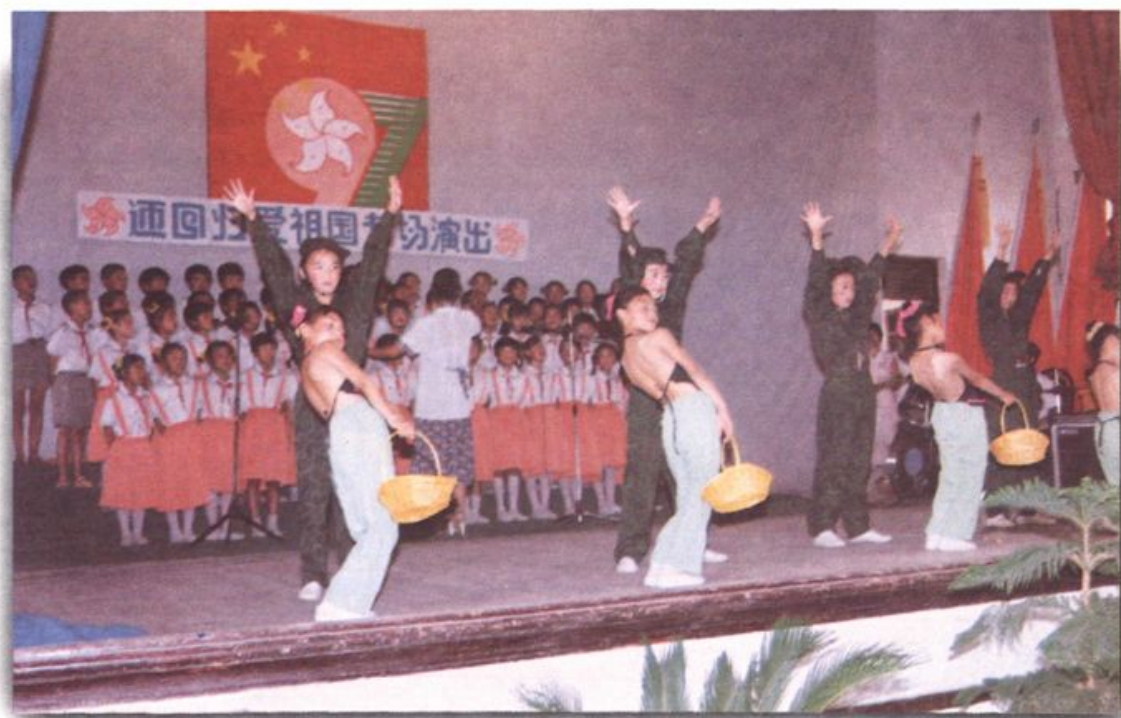
桥塘小学迎香港回归爱祖国专场演出