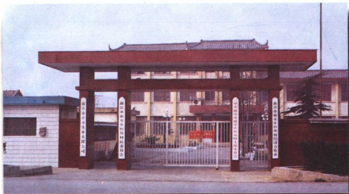
桥塘村部办公楼全貌缩影