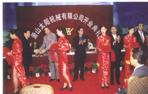
“太阳”机械公司举行开业典礼