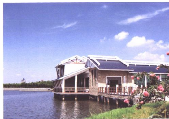
江东工业区现场指挥部