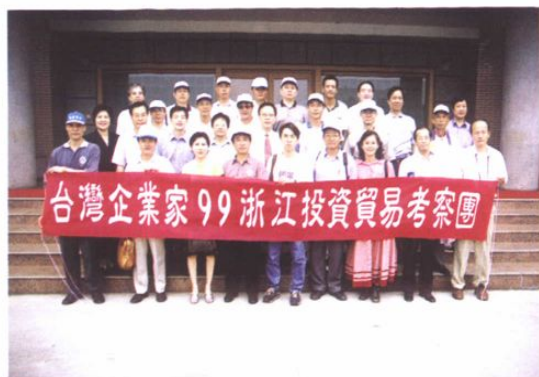
台湾客商到开发区考察