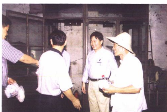
高温季节慰问一线工人