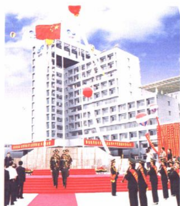
开发区管委会新大楼落成