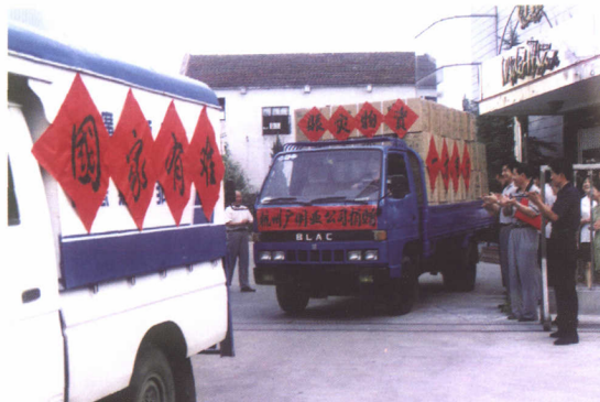
满载救援物资的车队驶向灾区