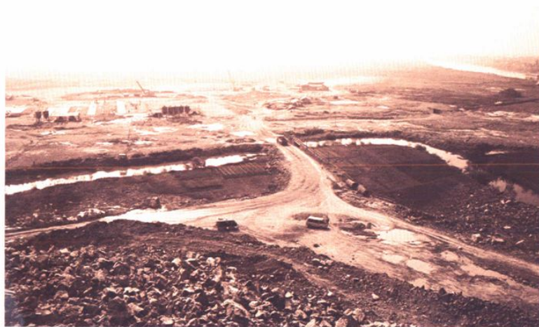
开发区启动区块建设场景