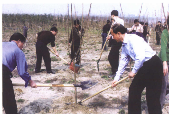
机关干部在江东工业园区植树播绿