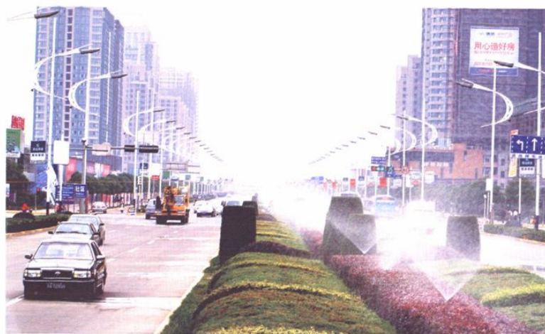
开发区市心北路一瞥