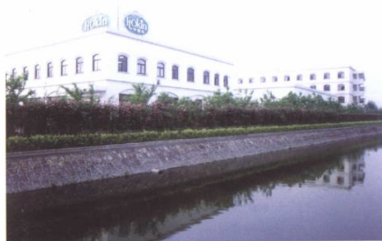
“伊都锦”公司的临河绿化