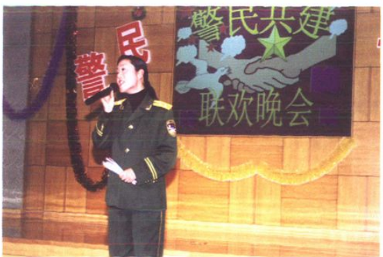
和驻地武警官兵举办联欢晚会