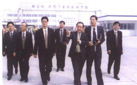
日商在开发区企业考察