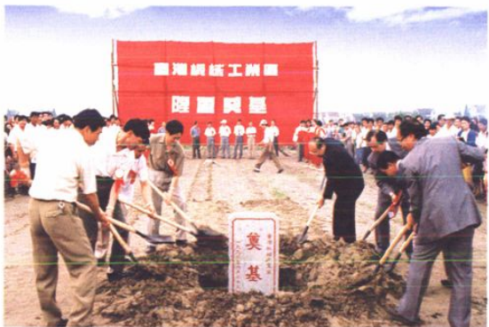
“台湾机械工业城”奠基