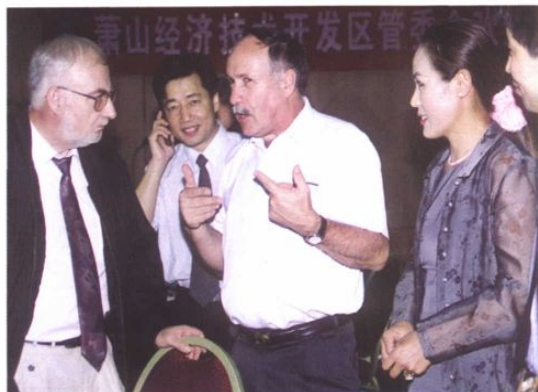
欧美客商在开发区考察