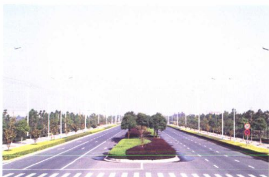
江东工业区主干道