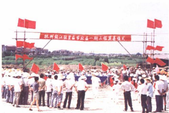
市北区块一期工程奠基