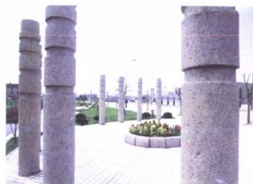
开发区内的河畔公园