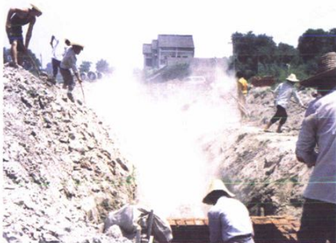
建区初期的基础设施建设