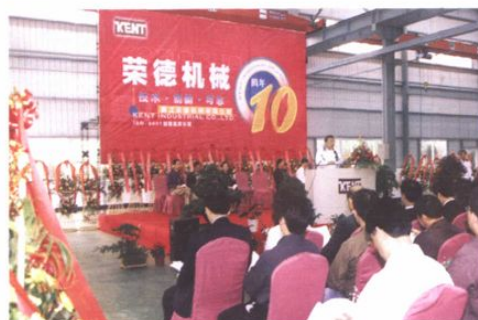
“荣德”机械公司迎来10周年生日