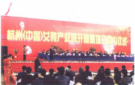
杭州(中国)女装产业园开园