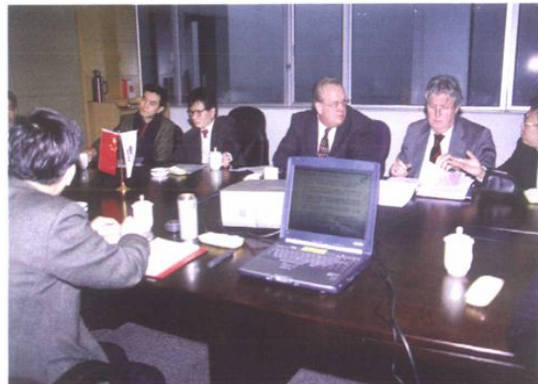
欧美客商和管委会工作人员洽谈项目