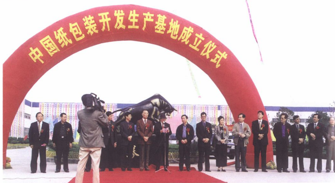
“胜达”包装生产基地成立