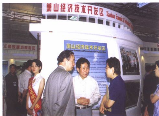
客商参观开发区展区