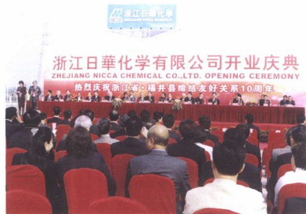
日华化学公司开业庆典