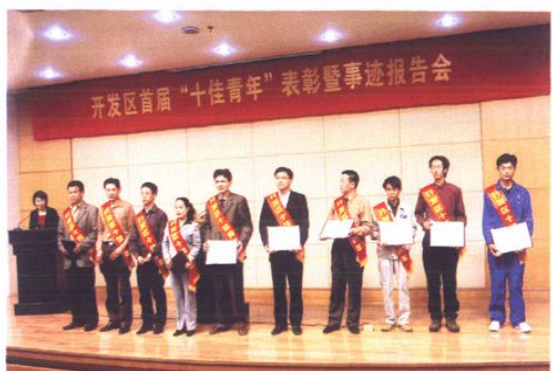
开发区“十佳青年”的事迹传遍每个企业