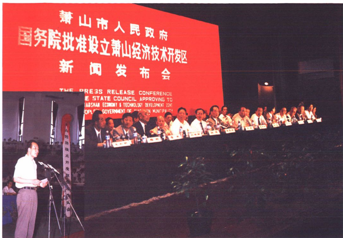
1993年6月23日，萧山市政府召开国务院批准设立萧山经济技术开发区新闻发布会