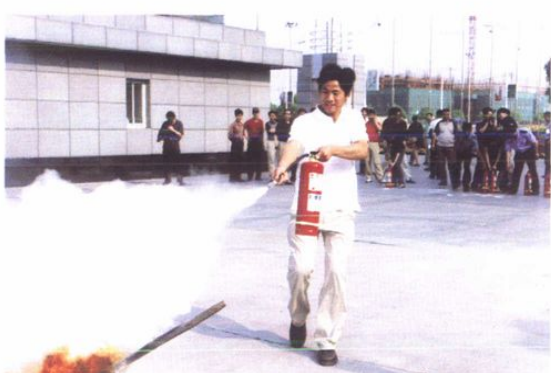
管委会开展消防演练