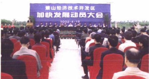
管委会召开“加快发展动员大会”