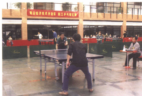
开发区系统职工乒乓球比赛