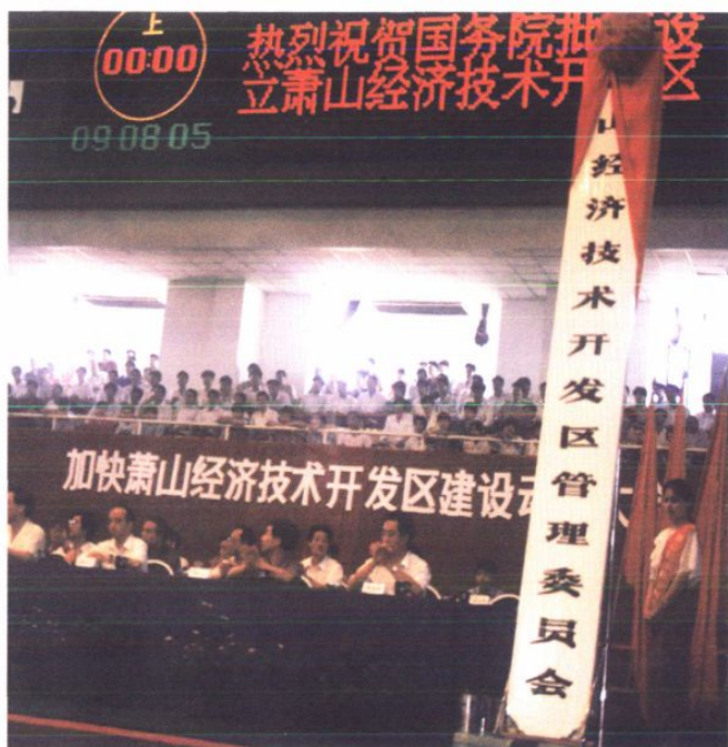
1993年6月16日，在“加快萧山经济技术开发区建设动员大会”上，省领导授牌