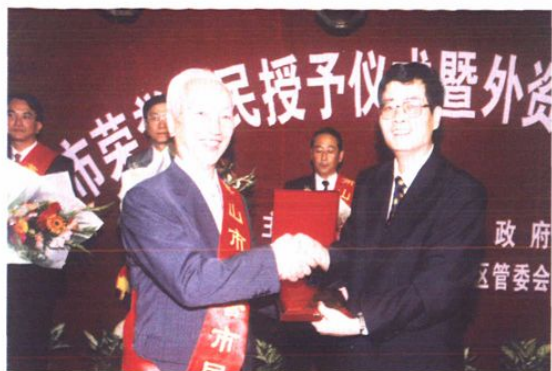
一批外商被授予“萧山荣誉市民”