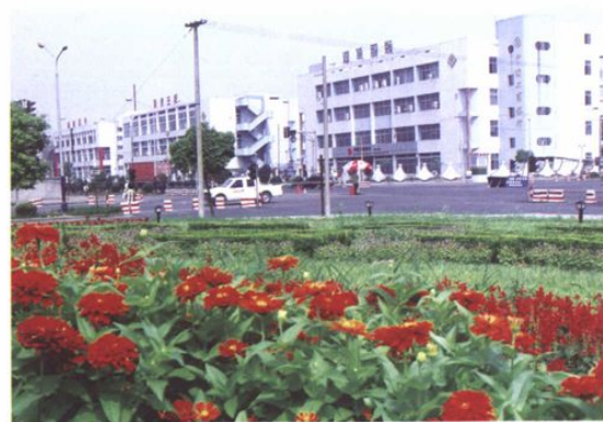
建设一路块状绿化