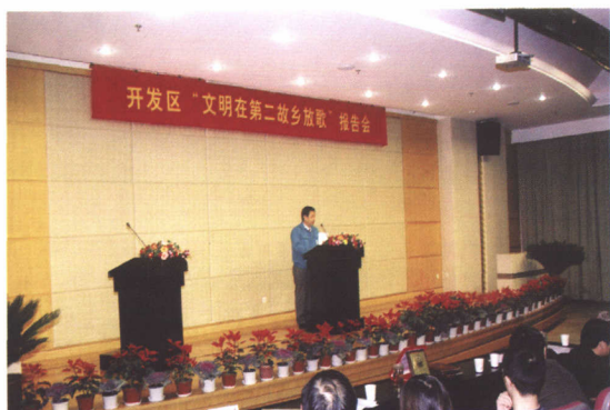
外地务工者在第二故乡报告创业经历