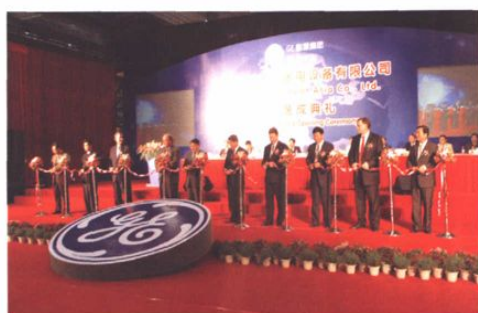
亚洲通用水电设备公司新厂落成