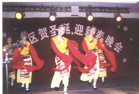
载歌载舞贺圣诞、迎新年