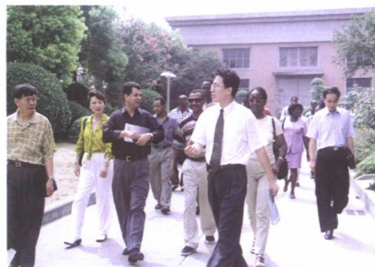
外国驻市团组陆续在开发区参访