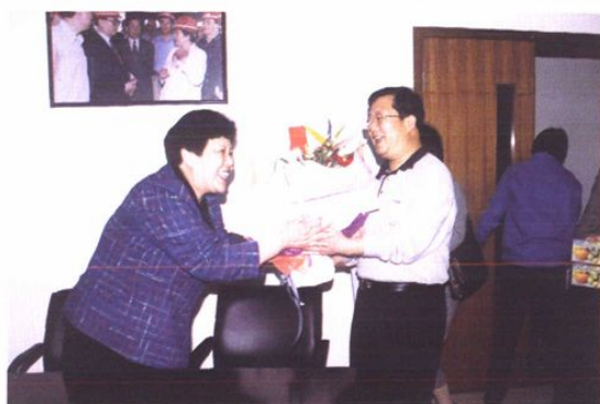
管委会领导看望劳动模范