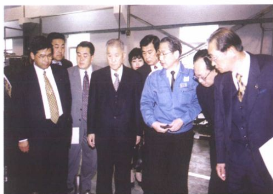
日商在日资企业考察