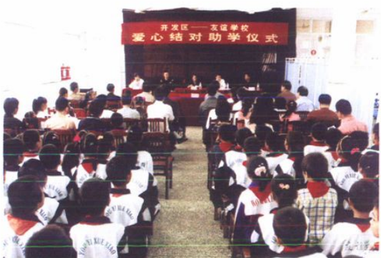
开发区与民工子女开展结对助学活动