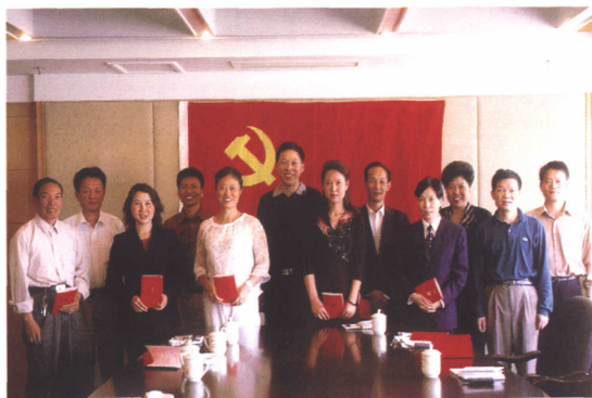
在党员生日重温入党誓词