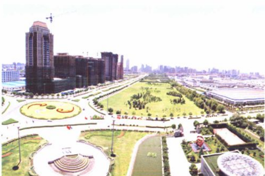
市心北路和建设二路交叉处一景