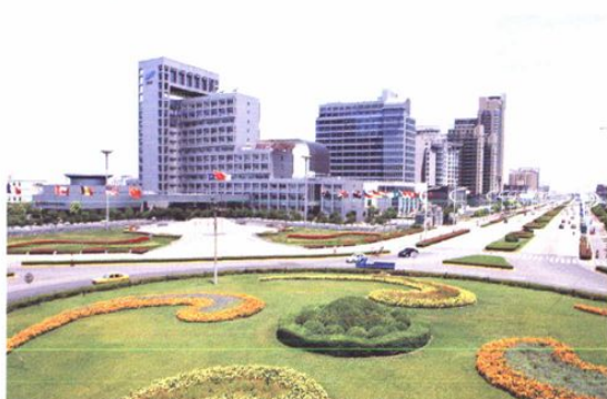
一幢幢大楼矗立在开发区