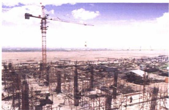
建设中的开发区企业