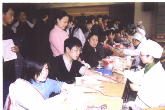
企业员工踊跃义务献血