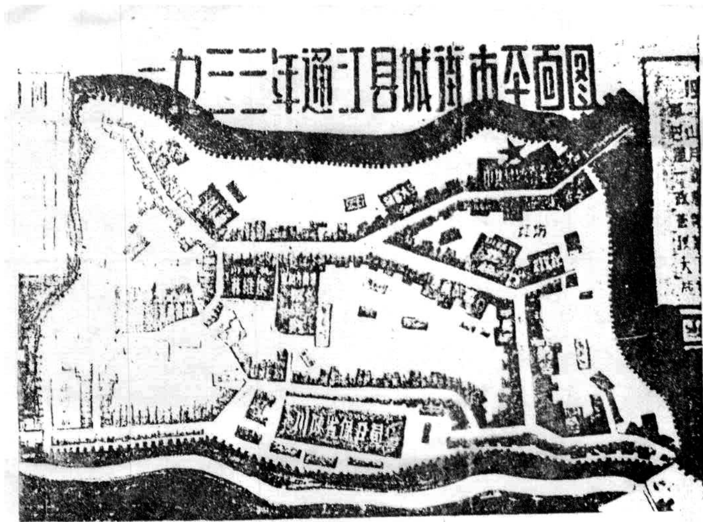
一九三三年县城街市平面图