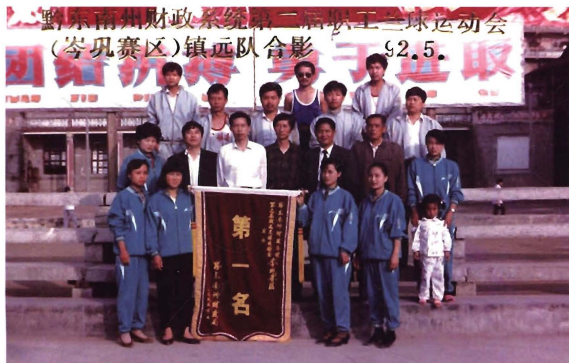
1992年5月，镇远队出席州财政系统第二届职工篮球运动会(岑巩赛区)荣获第一名，州局领导与队员合影。