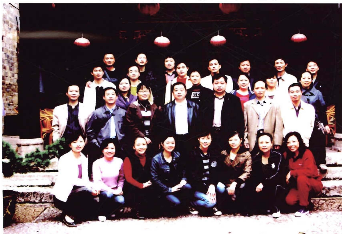
2008年11月全局多数干部职工在石阡县参观学习