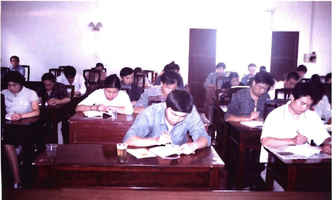
1998年4月，全县财政干部培训授课时留影