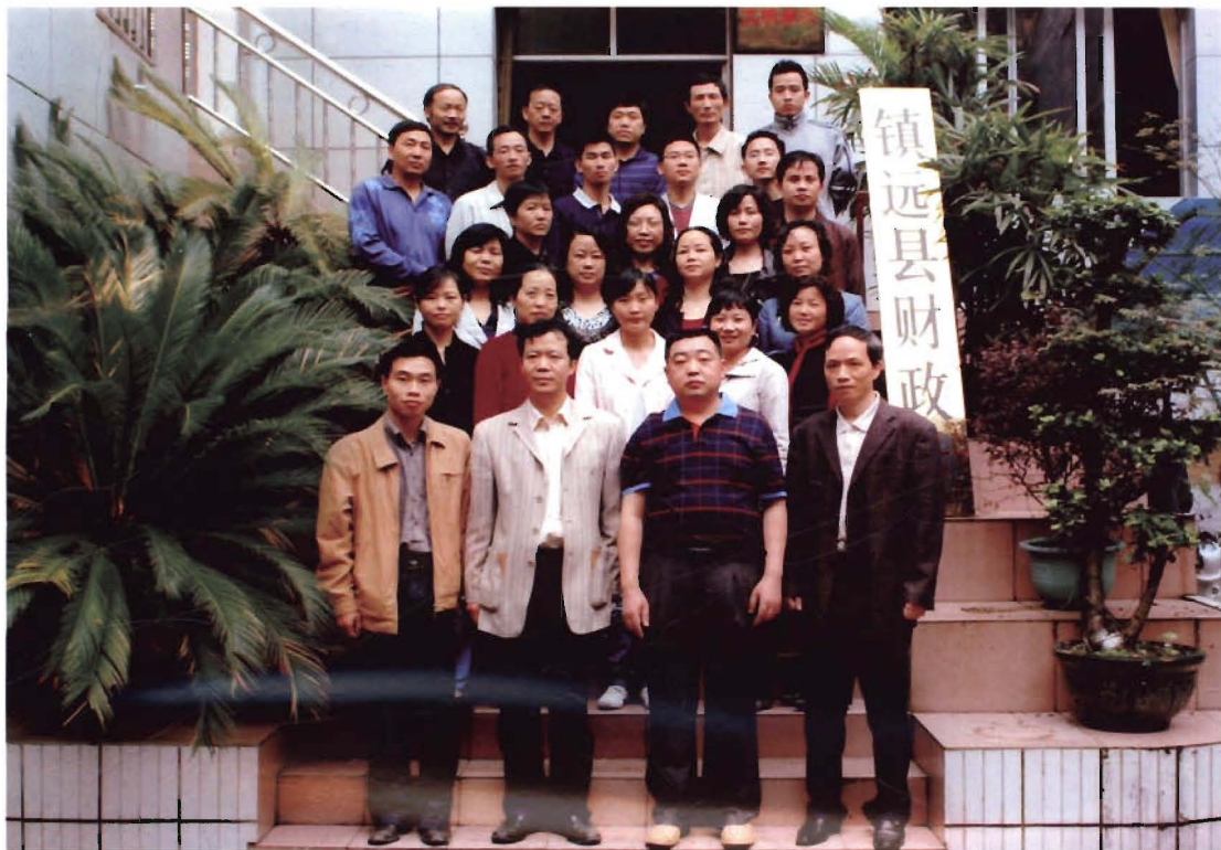
2008年镇远县财政局多数干部职工留影