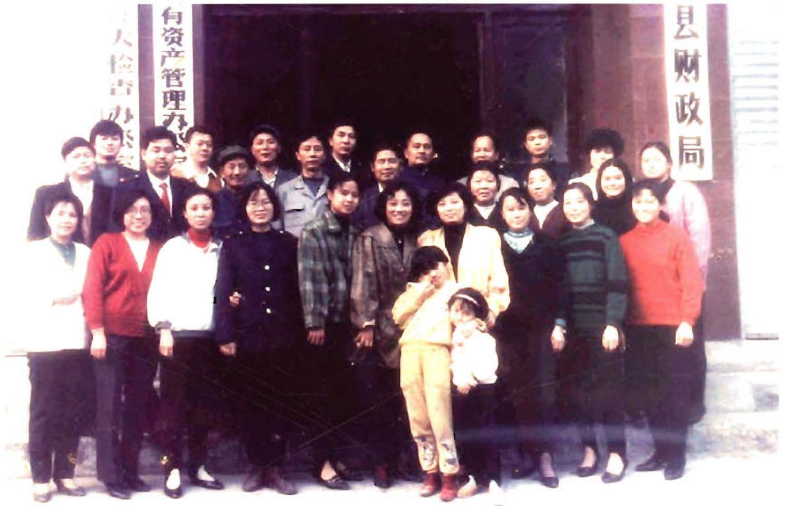
1993年11月县国有资产管理办公室挂牌，全局干部职工留影。