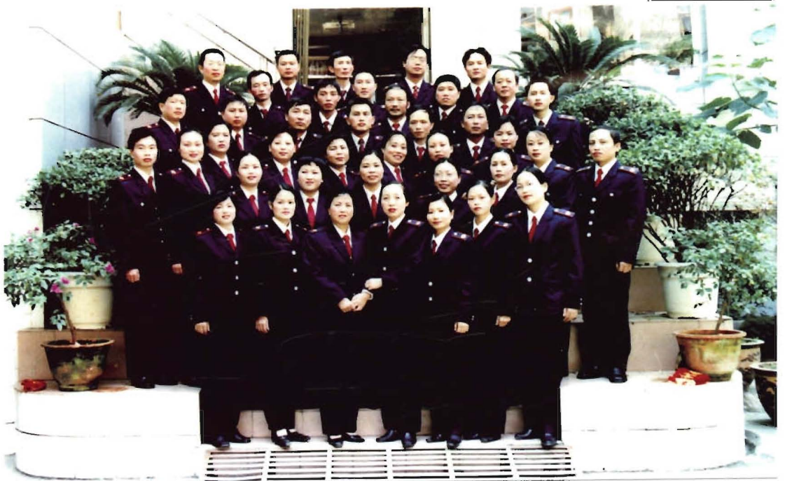
2003年10月16日，纪念镇远置县2280年歌咏比赛，县财政局全体职工合影。