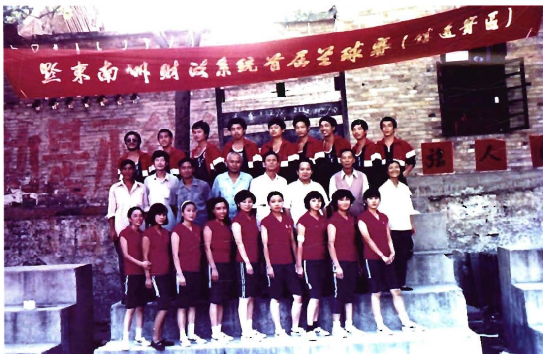
1989年5月，黔东南州财政系统首届篮球赛(镇远赛区)，镇远代表队合影。