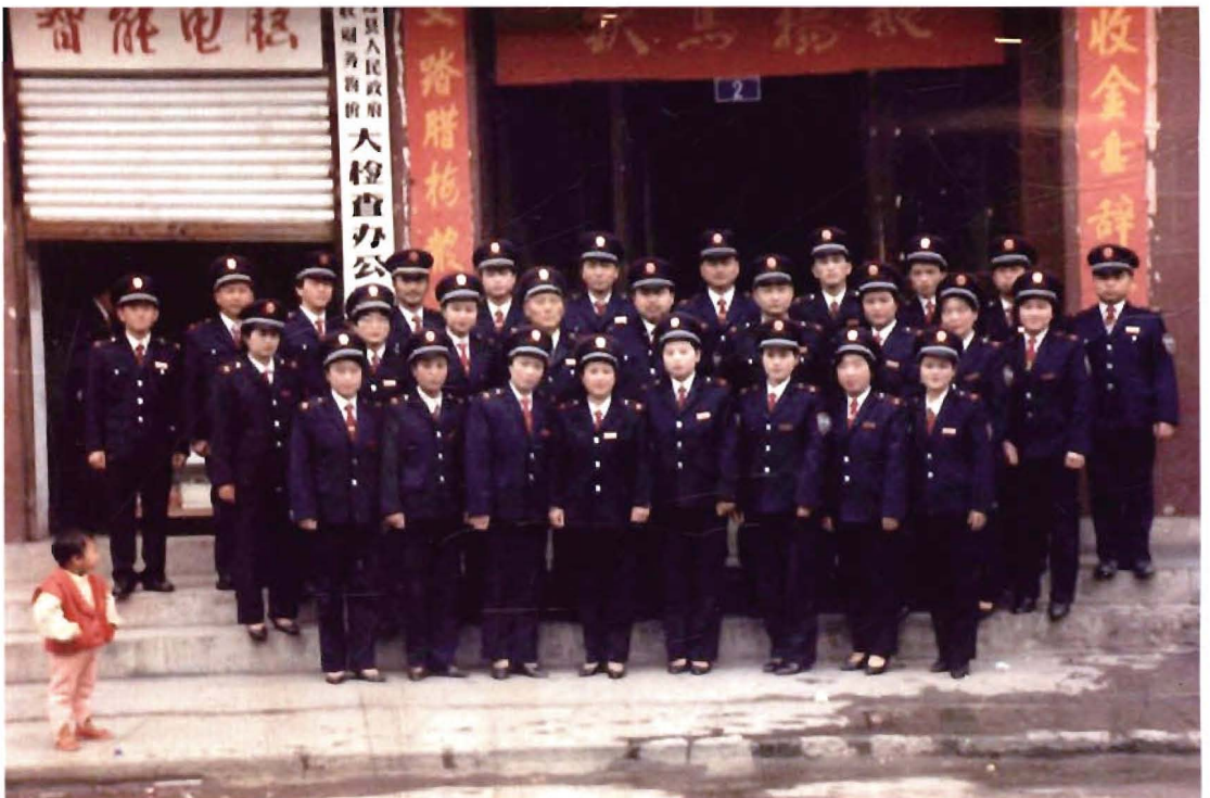
1995年5月，为依法征收农业特产税、耕地占用税、契税等而统一着装时，全体财政干部职工留影。