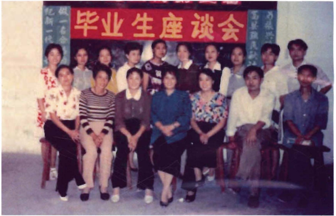
中华会计函授学校镇远第三届毕业生座谈会时留影。