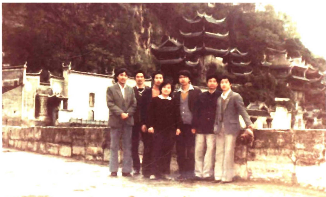
1986年7月，州财政局在镇远召开全州各县(市)财政工作会议，部分与会人员合影