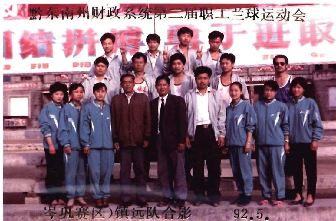
1992年5月，黔东南州财政系统第二届职工篮球运动会(岑巩赛区)，镇远代表队合影。