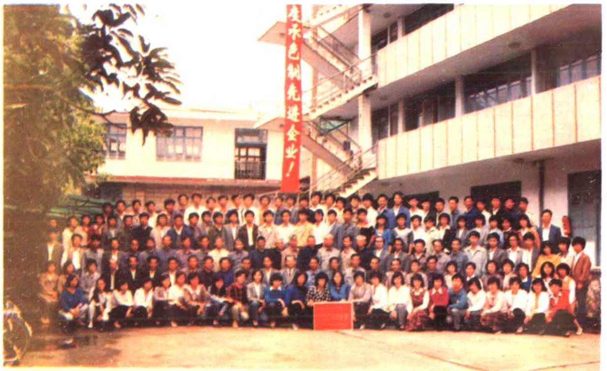
泉州医药站荣获省八七年度承包制先进企业纪念 88.4.29