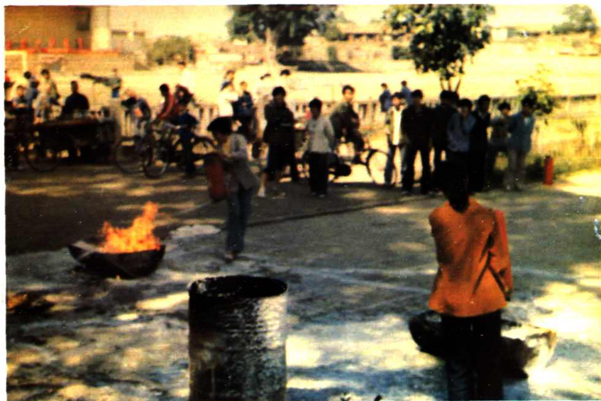
鲤城区医药公司组织职工消防演习