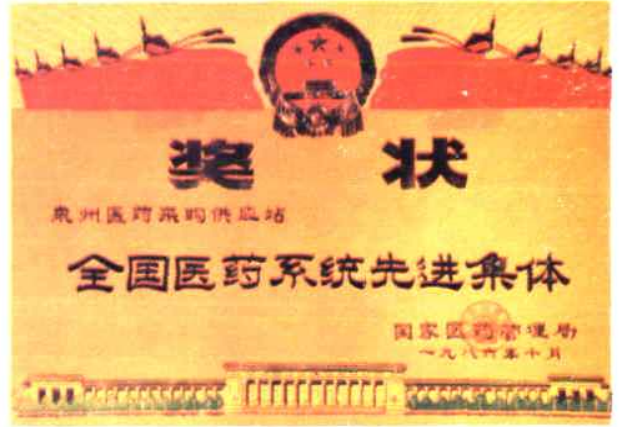
1986年国家医药管理局授予泉州医药站“全国医药系统先进集体”称号