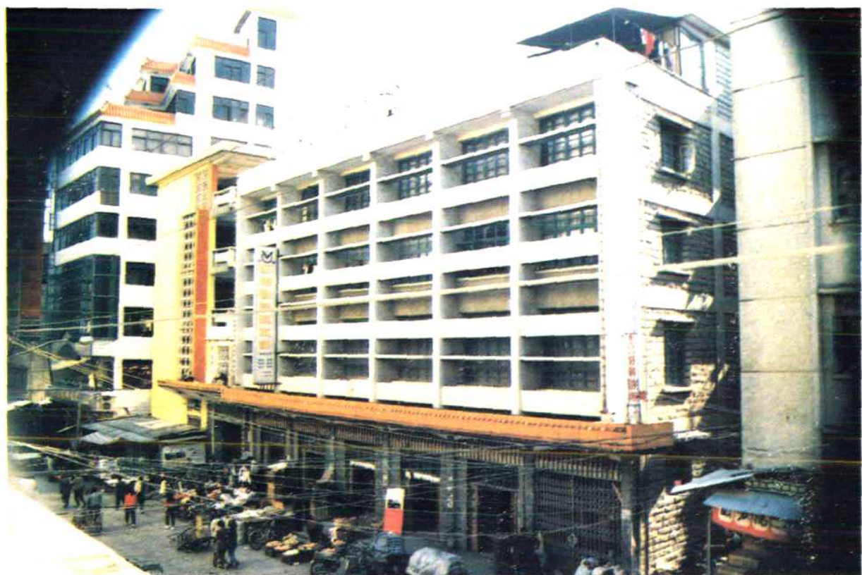
石狮市医药公司办公营业大楼