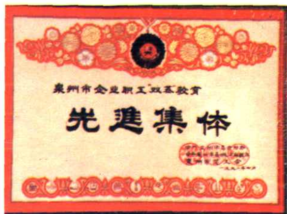
1992年中共泉州市委宣传部、社教办、泉州市总工会授予：泉州医药站泉州市企业职工“双基”教育先进集体称号。