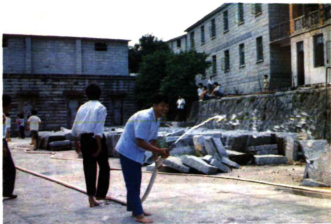
泉州医药站消防演习