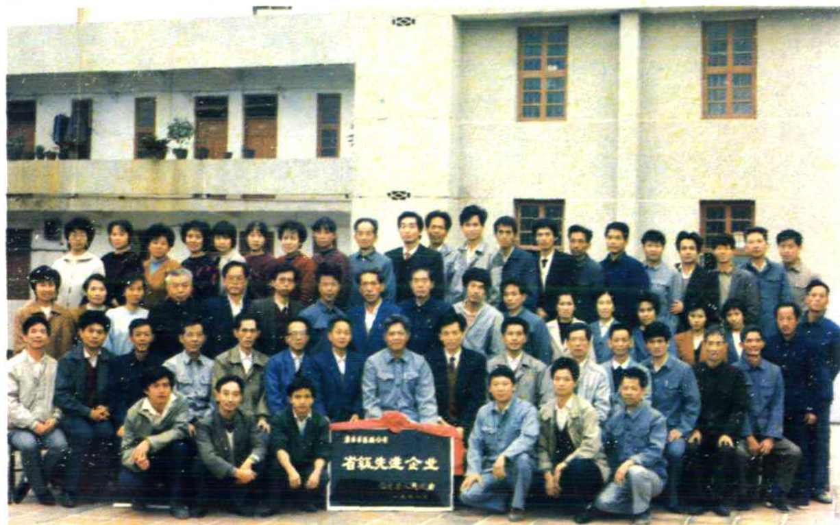
1991年省人民政府授予：惠安县医药公司“省级先进企业”称号合影留念。