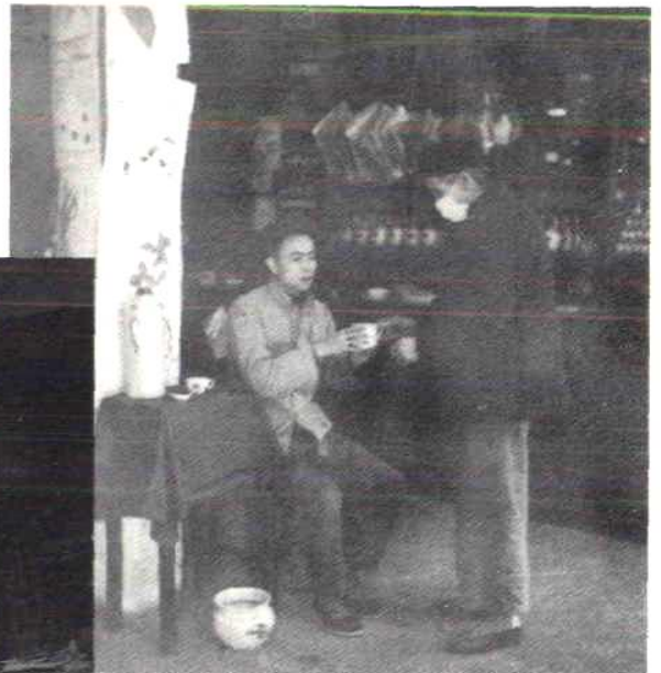
鲤城区医药公司代客煎药