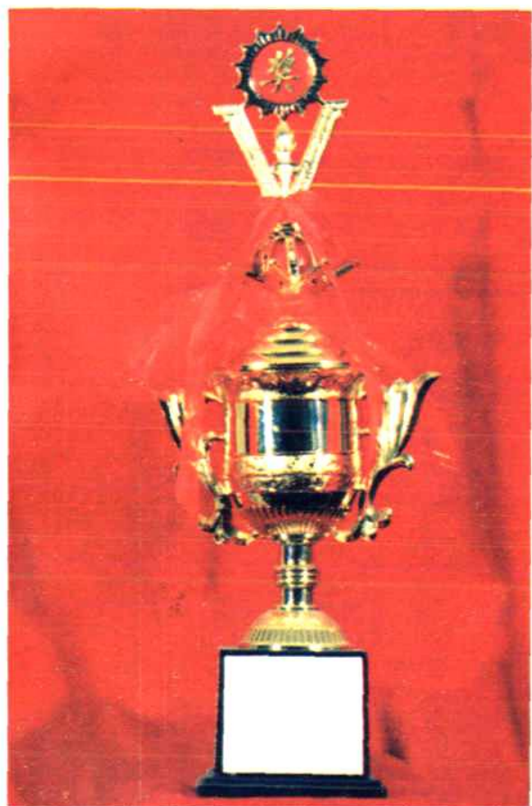
1992年省药材公司、省选拔赛领导小组授予：泉州市医药公司“全国第二届振兴中药技术竞赛福建省选拔赛团体第二名”称号。