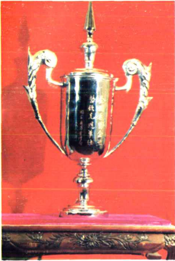
1984年全国医药商业企业整顿验收，1986年国家医药管理局授予泉州医药站“全国医药企业整顿先进单位”奖杯。