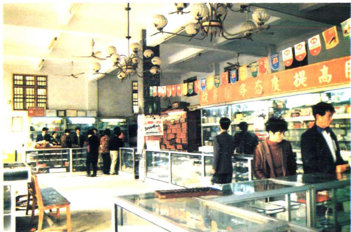
石狮市医药公司第四商店