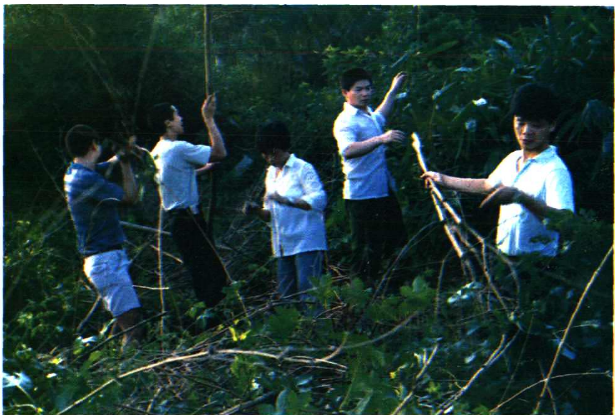
鲤城医药公司 1986 年药材资源普查