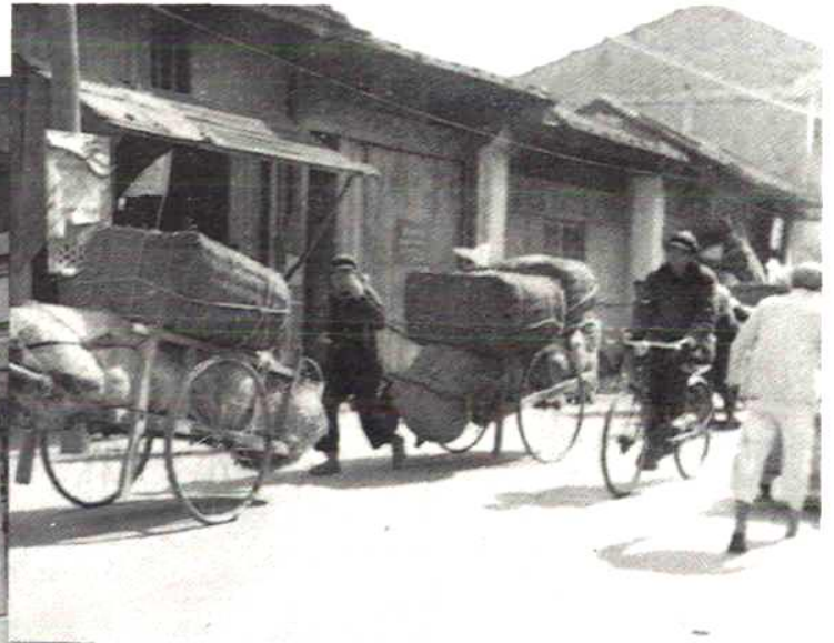
鲤城区医药公司送货上门