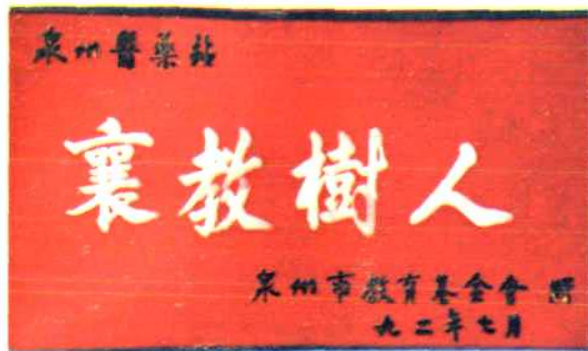
1992年泉州市教育基金会授予：泉州医药站“襄教树人”称号。