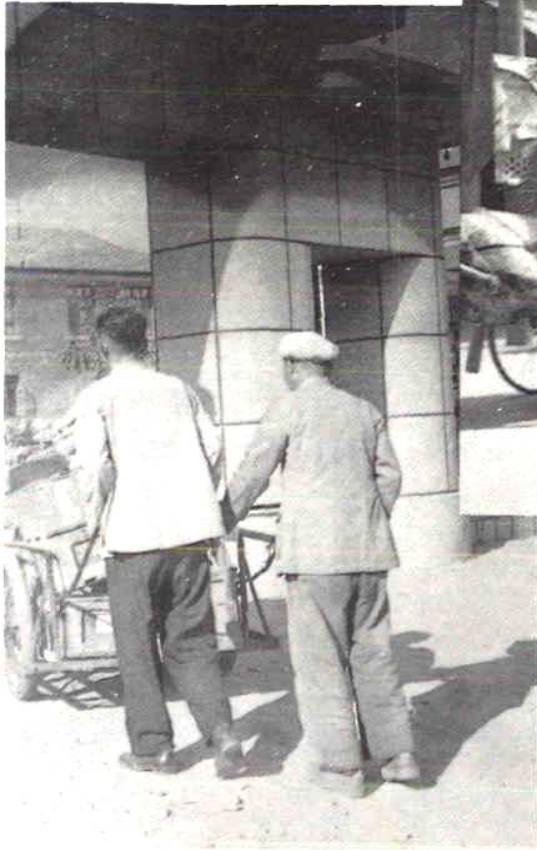
鲤城区医药公司送货上门