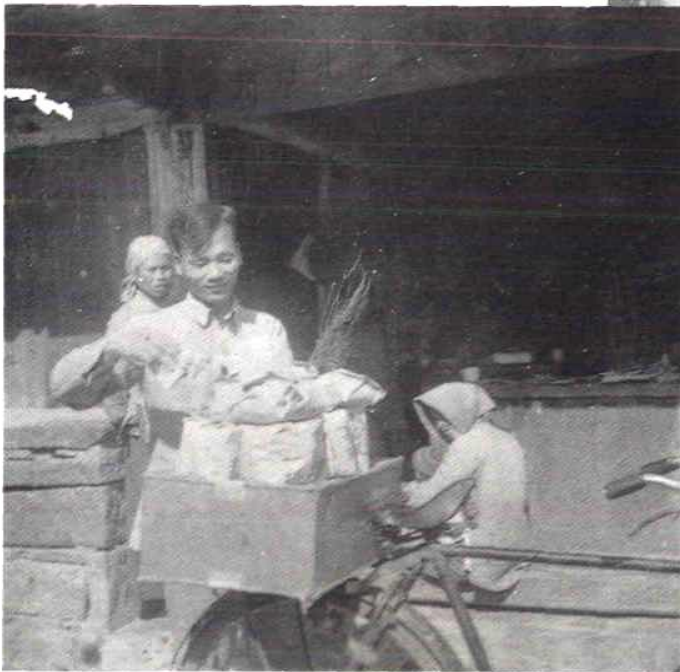
鲤城区医药公司组织货郎担下乡