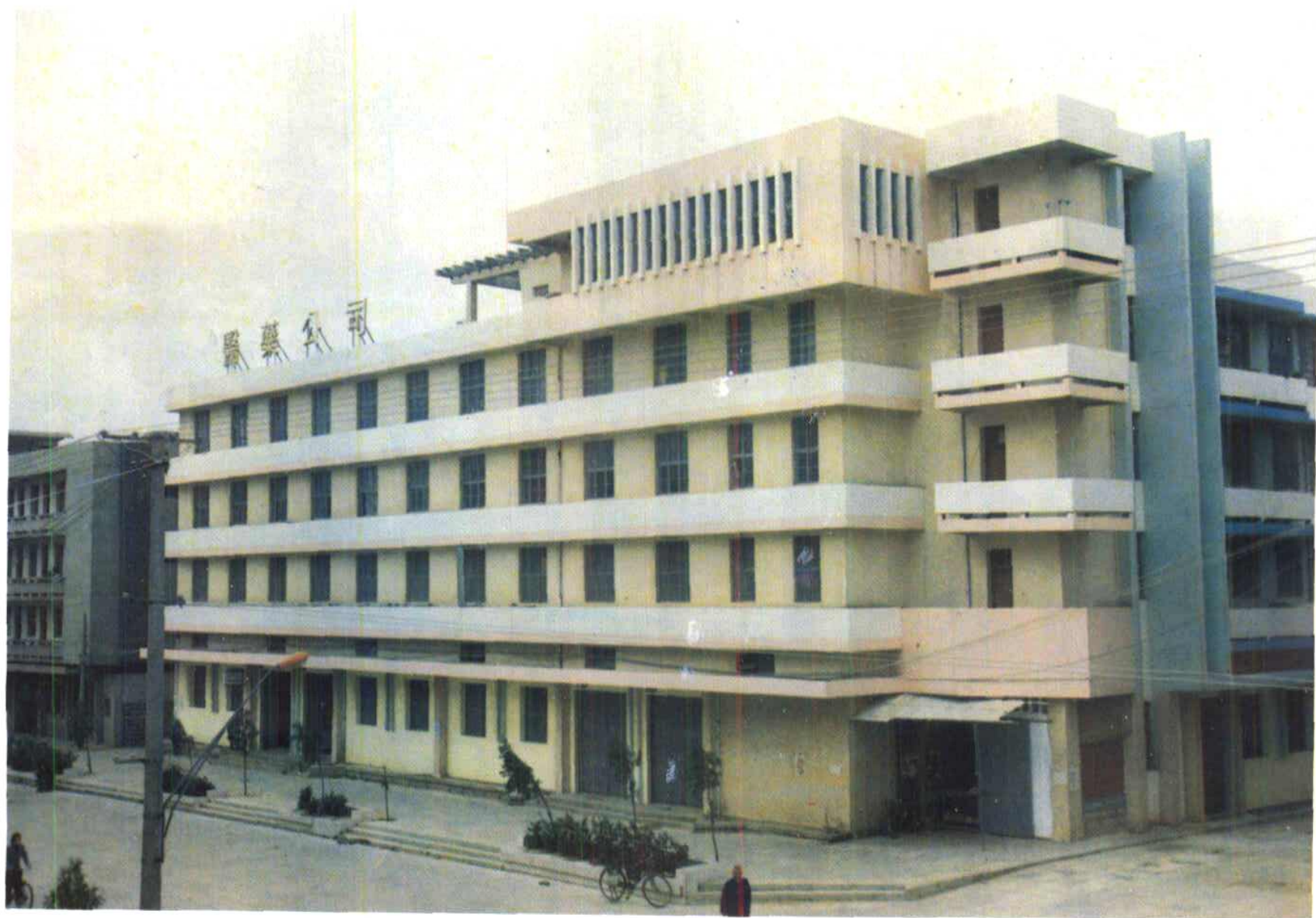
惠安縣藥業公司辦公營業大樓