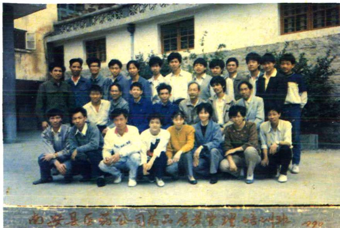
1990年南安县(市)医药公司举办药品质量管理培训班、公司领导与学员合影。