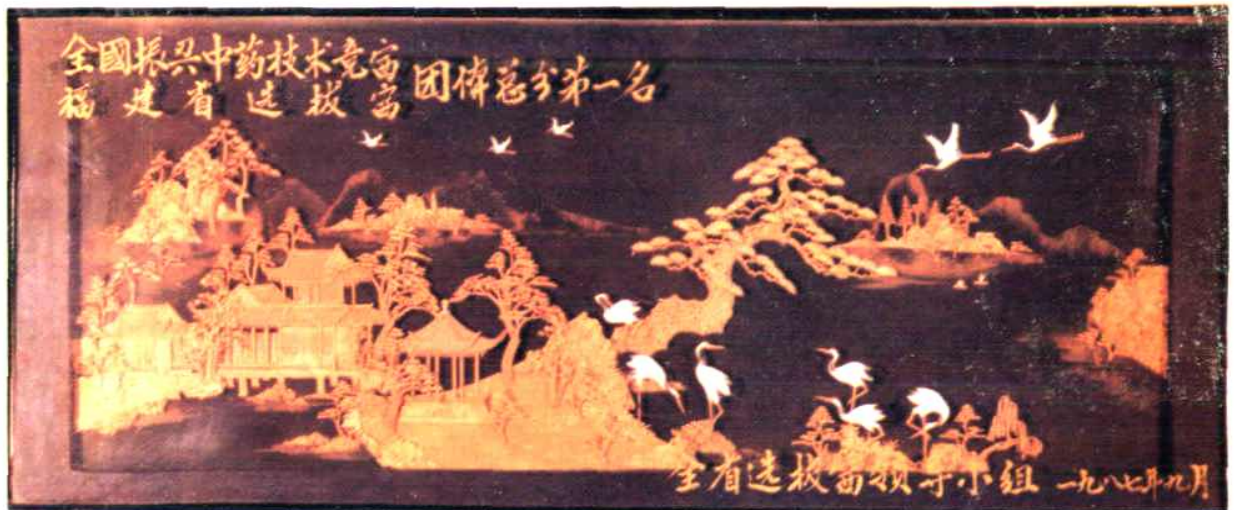
1987年省药材公司、省选拔赛领导小组授予：泉州市医药公司“全国振兴中药技术竞赛福建省选拔赛团体总分第一名”称号。