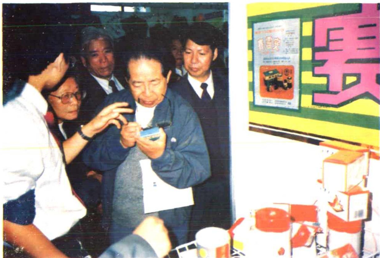
94年10月在北京《泉州侨乡商品展销会》上，国务院特区办主任、原福建省长、国家商业部长胡平亲临我厂展馆指导。