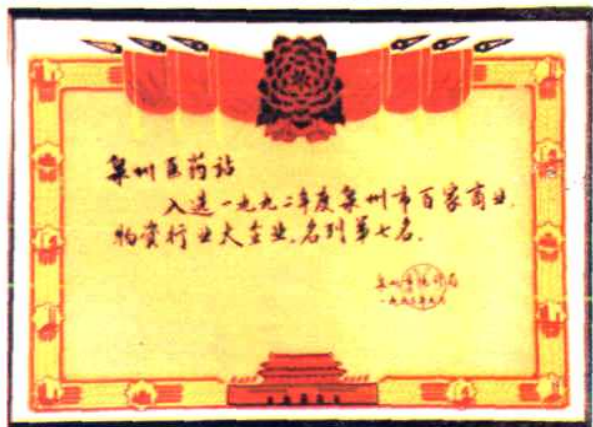
1993年泉州市统计局授予：泉州医药站入选1992年度泉州市百家商业物资行业大企业、名列第七名称号。