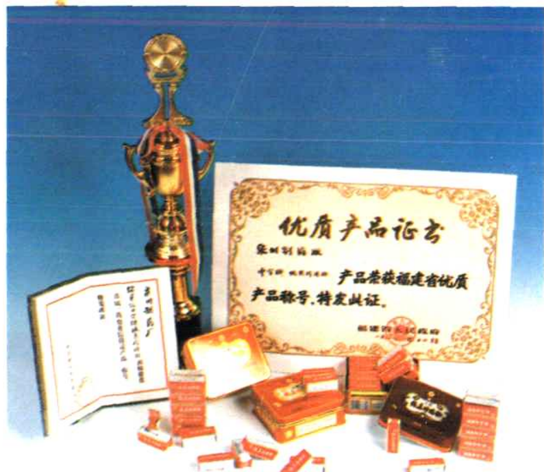
1989年12月省人民政府授予:泉州制药厂“中字牌纯真珍珠粉”产品荣获福建省优质产品称号