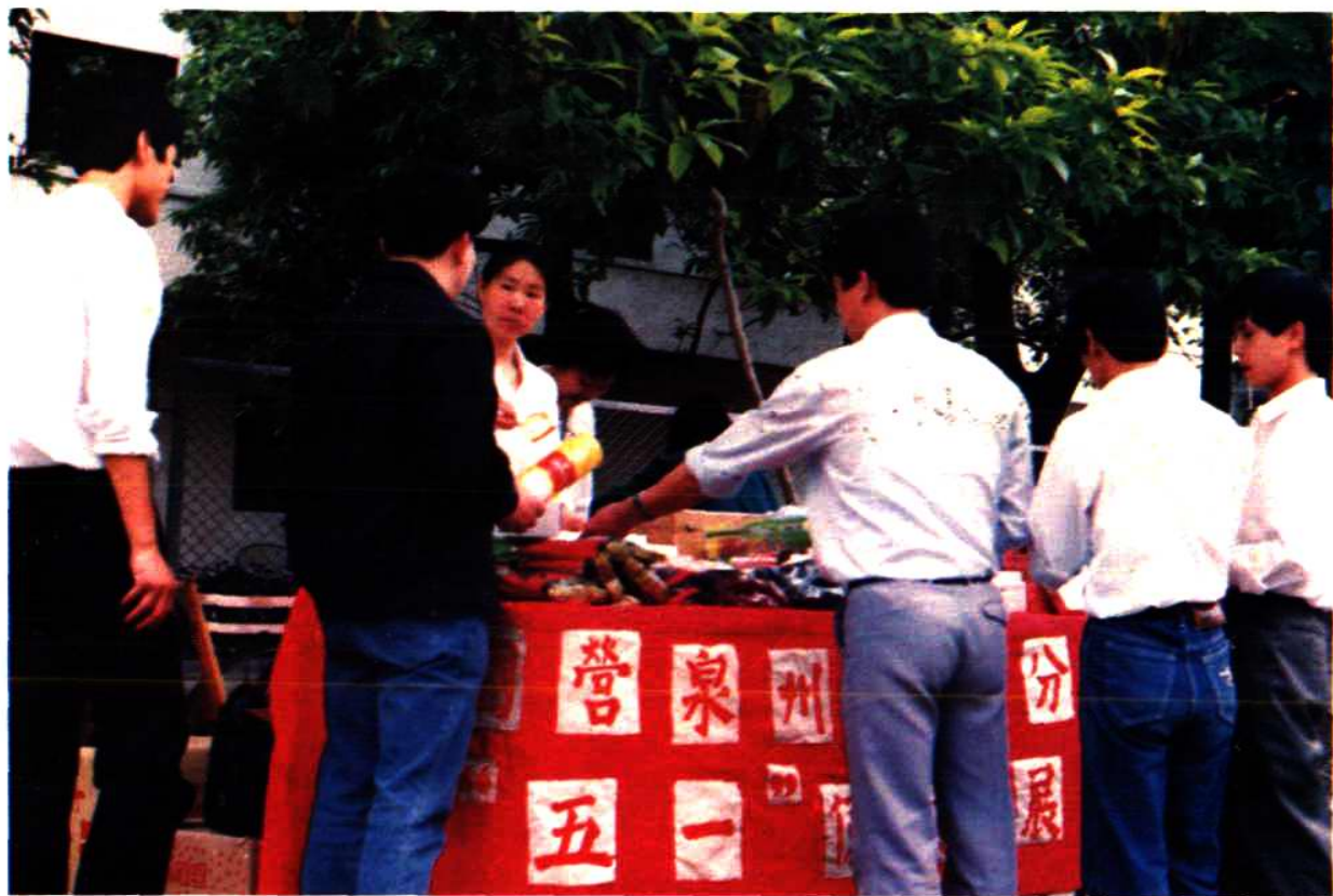
鲤城医药公司“五一”节组织药品巡回供应。