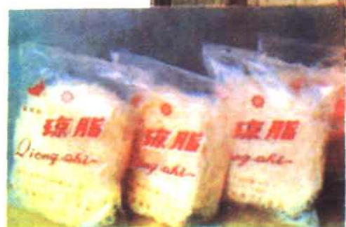
惠安化工厂主要产品—琼脂