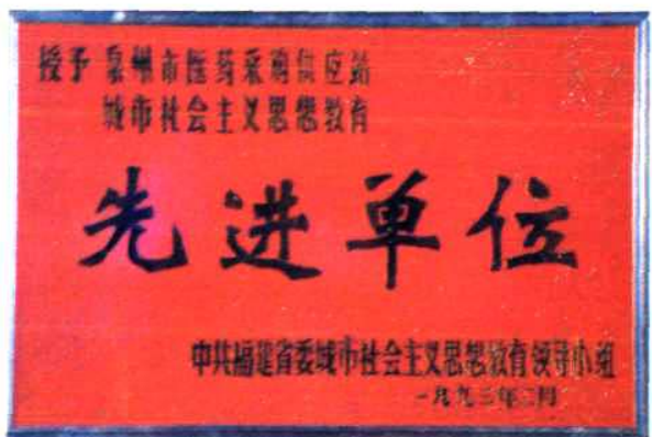
1993年中共福建省委城市社会主义思想教育领导小组授予泉州医药站城市社会主义思想教育“先进单位”称号。