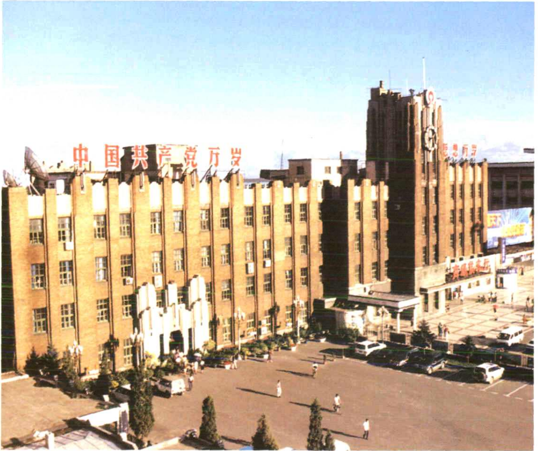
齐齐哈尔铁路分局办公楼