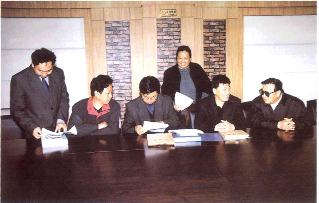
2002年4月6日《印刷厂志稿》通过分局终审