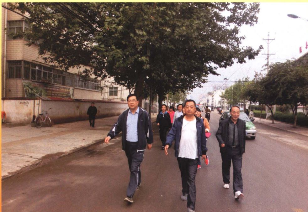
组织机关爬山活动