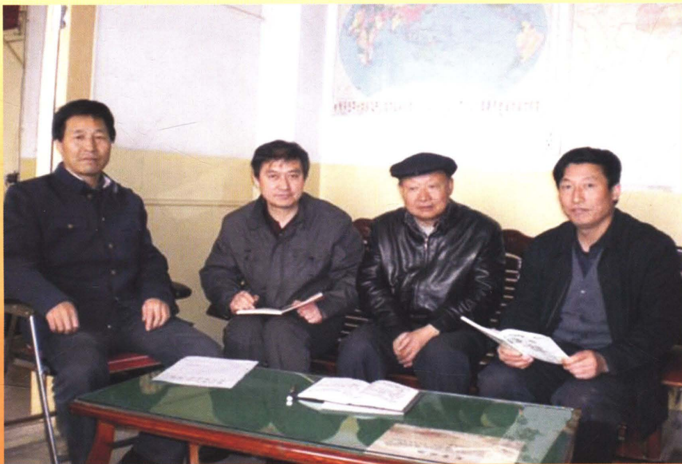
局领导班子研究《物价志》编写工作