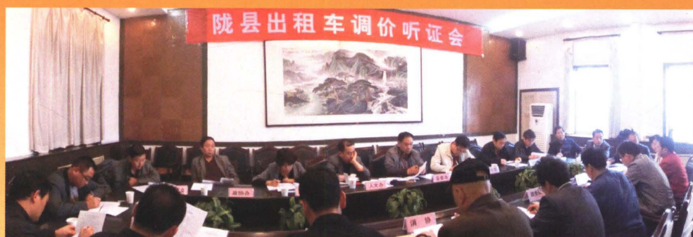
出租车调价听证会