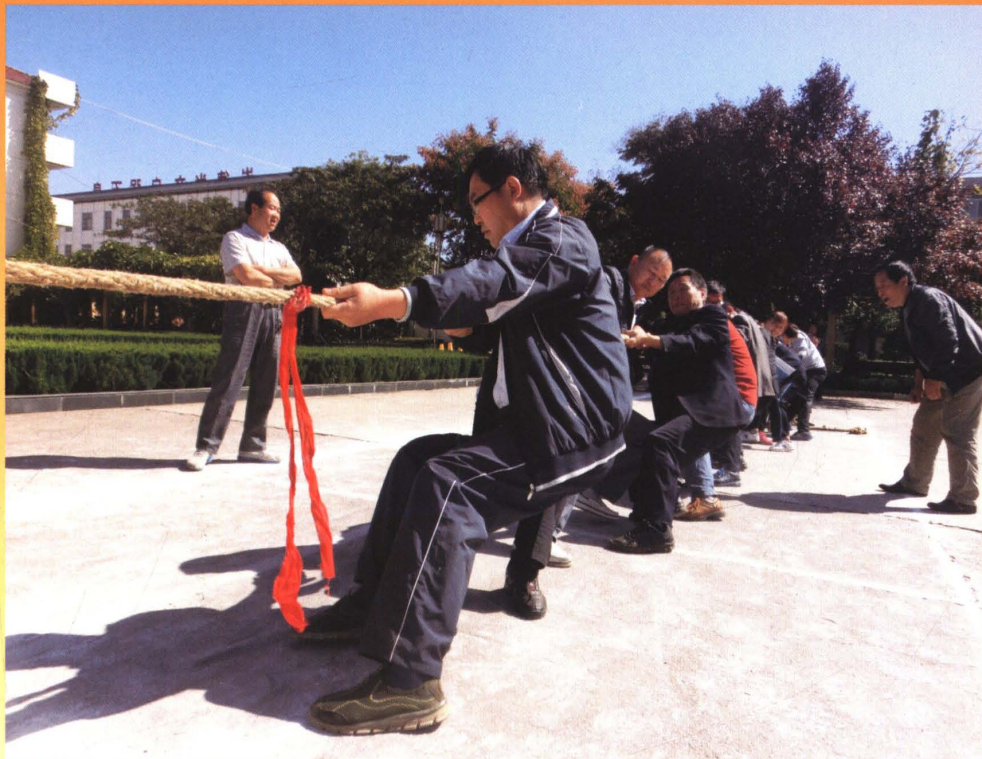
参加政府机关拔河比赛