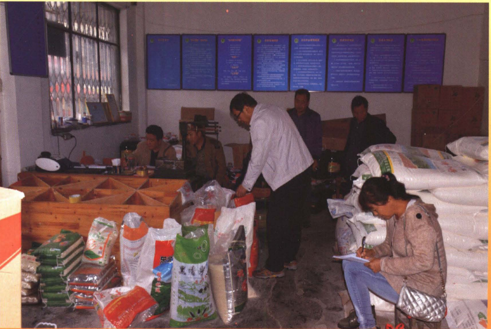
节假日市场价格检查