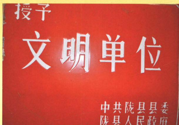
被县委、县政府授予文明单位