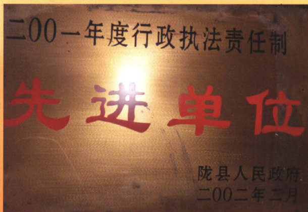
2001年度行政执法责任制先进单位