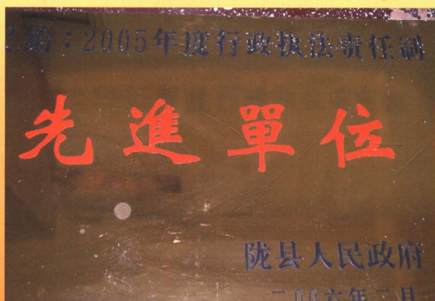
2005年度行政执法责任制先进单位