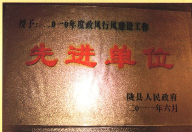
2010年度政风行风建设工作先进单位