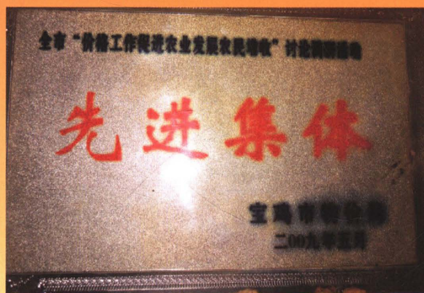
全市“价格工作促进农业发展农民增收” 调研活动先进集体